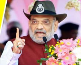
ଗୋଷ୍ଠୀ ଭାବେ ବିରୋଧୀ ପୁସ୍ତକ କରୁଛି ଏବଂ ଜମ୍ମୁ-କଶ୍ମୀରରେ ବିଚ୍ଛିନ୍ନତାବାଦକୁ ପ୍ରୋତ୍ସାହିତ କରିବା ପାଇଁ ଆତଙ୍କବାଦୀ କାର୍ଯ୍ୟକଳାପ ଜାରି ରଖୁଛି । ଆତଙ୍କବାଦୀ ବିରୋଧରେ ପ୍ରଧାନମନ୍ତ୍ରୀ ନରେନ୍ଦ୍ର ମୋଦିଙ୍କ ଶୂନ୍ୟ ସହନଶୀଳ ନୀତି ଅନୁଯାୟୀ, ଭାରତ ବିରୋଧୀ କାର୍ଯ୍ୟକଳାପରେ ଜଡ଼ିତ ଯେକୌଣସି ବ୍ୟକ୍ତି କିମ୍ବା ସଂଗଠନକୁ ବନ୍ଦନ କରାଯିବ । ଡେହରିକ-ଏ-ହୁରିୟତ୍ ସହ ସମ୍ପର୍କ ଶାହା ଗିଳାନିକ ଦ୍ୱାରା ପ୍ରତିଷ୍ଠିତ ଏକ (ପୃଷ୍ଠା ୭ରେ)

ନୂଆଦିଲ୍ଲୀ, ୩୧।୧୨ : ଜମ୍ମୁ-କଶ୍ମୀରର ବିଚ୍ଛିନ୍ନତାବାଦୀ ସଂଗଠନ ଗୁଡ଼ିକ ବିରୋଧରେ କେନ୍ଦ୍ର ସରକାର କଡ଼ା ଆର୍ତ୍ତମୁଖ୍ୟ ଗ୍ରହଣ କରିଛନ୍ତି । ସରକାର ରବିବାର ଡେହରିକ-ଏ-ହୁରିୟତ୍ କୁ ବେଆଇନ ସଂଗଠନ ଘୋଷଣା କରିଛନ୍ତି । ସରକାରଙ୍କ ଏହି ପଦକ୍ଷେପ ସମ୍ପର୍କରେ ବିତ୍ତ କରି ପୂର୍ତ୍ତା ଦେଇଛନ୍ତି ଗୃହମନ୍ତ୍ରୀ ଅମିତ ଶାହ ।