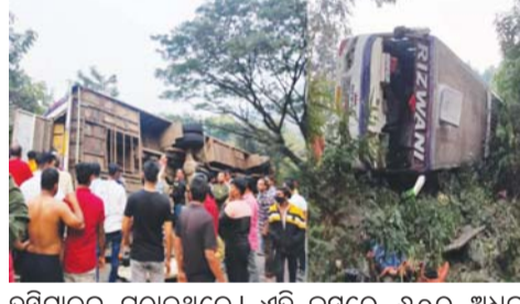
ହସିଗାଳକୁ ପଠାଇଥିଲେ । ଏହି ବସ୍ରେ ୬୦ରୁ ଅଧିକ ପର୍ଯ୍ୟଟକ ଥିବା ଜଣାପଡ଼ିଛି ।

ଦିଗପହଣ୍ଡି, ୩୧।୧୨ : ନ୍ୟୁଜ୍ ବ୍ୟୁରୋ ତପ୍ତପାଣି ଘାଟିରେ ପିକନିକ୍ ବସ୍ ଓଲଟି ୩୫ ଜଣ ଆହତ ହୋଇଛନ୍ତି । ଯାକପୁରରୁ ପିକନିକ୍ ଯାଇଥିବା ଏକ ଘରୋଇ ବସ୍ ରିକାଡ଼ି ଭାରସାମ୍ୟ ହରାଇ ଘାଟି ତଳକୁ ଖସିପଡ଼ି ଓଲଟି ପଡ଼ିଥିଲା । ପିକନିକ୍ ସାରି ଗଜପତି ଜିଲ୍ଲା ଜିରାଙ୍ଗରୁ ଫେରିବା ବେଳେ ପାଟପୁର ଥାନା ଅନ୍ତର୍ଗତ ତପ୍ତପାଣି ଘାଟିରେ ଏହି ଦୁର୍ଘଟଣା ଘଟିଛି । ଆହତ ମାନଙ୍କ ମଧ୍ୟରୁ ୬ ଜଣଙ୍କ ସ୍ୱାସ୍ଥ୍ୟାବସ୍ଥା ଗୁରୁତର ରହିଥିବା ଜଣାପଡ଼ିଛି । ଆହତମାନଙ୍କୁ ପ୍ରଥମେ ସ୍ଥାନୀୟ ଲୋକେ ଓ ପିକନିକରୁ ସେହି ବାଟ ଦେଇ ଫେରୁଥିବା ଅନ୍ୟ ଲୋକମାନେ ଉଦ୍ଧାର କରି