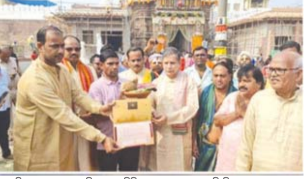
ଶ୍ରୀମନ୍ଦିରରେ ମହାପ୍ରଭୁଙ୍କୁ ନିମନ୍ତ୍ରଣ କରିଛି । ମାନ୍ୟଗଣ୍ୟ ବ୍ୟକ୍ତି ବିଶେଷ ଯୋଗଦେବାର ରାମଲୀଳାଙ୍କ ପ୍ରାଣ ପ୍ରତିଷ୍ଠା ଉତ୍ସବରେ ବହୁ କାର୍ଯ୍ୟକ୍ରମ ରହିଛି ।

ଉନ୍ନତିକରଣ ପାଇଁ ଏହି ଯୋଜନା ଆରମ୍ଭ କରାଯାଇଥିଲା । ଏହି ଯୋଜନା ଅଧୀନରେ ଥିବା ଗୋଟିଏ ପ୍ରକଳ୍ପ ହେଉଛି ଶ୍ରୀମନ୍ଦିର ଏକାନ୍ତ କରିବାର ବା ପରିକ୍ରମା ପ୍ରକଳ୍ପ । ଏଥିପାଇଁ ୮୦୦କୋଟି ଟଙ୍କା ବ୍ୟୟବରାଦ କରିଛନ୍ତି ମୁଖ୍ୟମନ୍ତ୍ରୀ ନବୀନ ପଟ୍ଟନାୟକ । ପୁରୀକୁ ଆସୁଥିବା ସମସ୍ତ ଯାତ୍ରୀଙ୍କ ପାଇଁ ଏଥିରେ ରହିବ ସମସ୍ତ ମୌଳିକ ସୁବିଧା । ପୁରୁଷ ଓ ମହିଳାମାନଙ୍କ ପାଇଁ ପୃଥକ ପୃଥକ ଶୈବାଳୟ ନିର୍ମାଣ ହୋଇଛି । ଯାତ୍ରୀ ଅଭ୍ୟର୍ଥନା କେନ୍ଦ୍ର, କୁଳରୁମ୍, ସୁତନା ଓ ଦାନକେନ୍ଦ୍ର, ବିଶ୍ରାମସ୍ଥଳ, କେଟିପି ଆଉଟପୋଷ୍ଟ, ଏଟିଏମ କିଓଷ୍ଟ, କରୁରି ଯାତାଯାତ ମାର୍ଗ, ସ୍ତ୍ରୀ ଯାତାଯାତ ମାର୍ଗ, ଲ୍ୟାଣ୍ଡସ୍କେପ ଏବଂ ପୁଟପାଥ ଭଳି ବ୍ୟବସ୍ଥା ହୋଇଛି । ଏହାସହ ଶ୍ରଦ୍ଧାଳୁଙ୍କ ନିର୍ଦ୍ଦିଷ୍ଟ ଦର୍ଶନ ପାଇଁ ଶୀତତାପ ନିୟନ୍ତ୍ରିତ ସେଲ୍‌ଗରର ବ୍ୟବସ୍ଥା କରାଯାଇଛି । ଅଧିକରେ କିଭଳି ମନ୍ଦିର ଦେବା ପରିକ୍ରମା କରିପାରିବେ ଶ୍ରଦ୍ଧାଳୁ ଏବଂ ପୁରୀକୁ ଆସୁଥିବା ବିଦେଶୀ ପର୍ଯ୍ୟଟକ କିଭଳି ଭଲ ଅନୁଭୂତି ସାଉଁଟିବେ ସେହି ଉଦ୍ଦେଶ୍ୟରେ ପରିକ୍ରମା ପ୍ରକଳ୍ପର ପରିକଳ୍ପନା କରିଥିଲେ ରାଜ୍ୟ ସରକାର, ଯାହା ଏବେ ବାସ୍ତବ ରୂପ ନେବାକୁ ଯାଉଛି ।