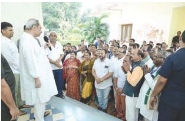
ଭୁବନେଶ୍ୱର : ନବୀନ ନିବାସ ଠାରେ ହିଜ୍ଜିଲି ବିଧାନସଭା ନିର୍ବାଚନମଣ୍ଡଳର ନେତାମାନଙ୍କ ସହ ମୁଖ୍ୟମନ୍ତ୍ରୀ ନବୀନ ପଟ୍ଟନାୟକ ସେମାନଙ୍କ ସମ୍ପର୍କରେ ଆଲୋଚନା କରୁଛନ୍ତି ।