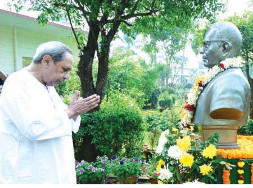
ଭୁବନେଶ୍ୱର : ଶ୍ରୀକୋସ୍ତବ ପାଳନ ଅବସରରେ ସ୍ୱର୍ଗତ ଡ. ହରେକୃଷ୍ଣ ମହତାବଙ୍କ ପ୍ରତିମୂର୍ତ୍ତିରେ ଶ୍ରଦ୍ଧାଞ୍ଜଳି ଅର୍ପଣ କରୁଛନ୍ତି ମୁଖ୍ୟମନ୍ତ୍ରୀ ନବୀନ ପଟ୍ଟନାୟକ ।