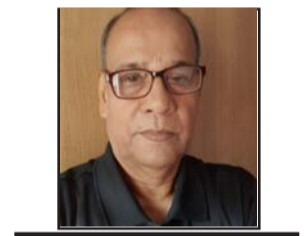
ଶ୍ରୀଶ୍ରୀ ଅଭିରାମ ସରସ୍ୱତୀ