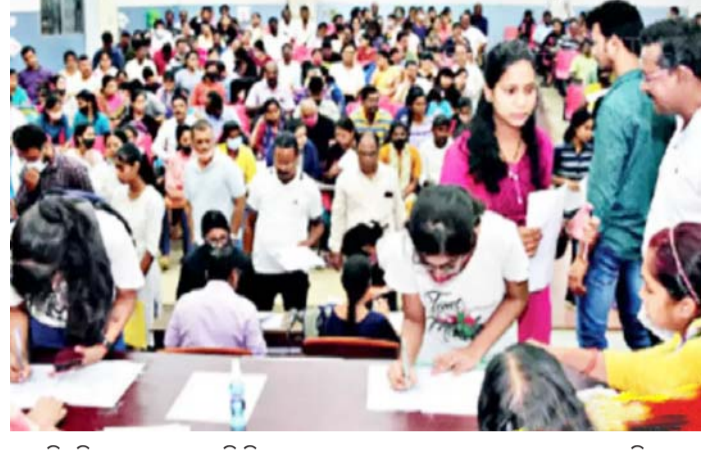
ବିଜ୍ଞପ୍ତି ଅନୁଯାୟୀ, ଗଜପତି ଜିଲ୍ଲାର ଗୁମ୍ଫା, ଗଞ୍ଜାମର ଧରାକୋଟ, କଳାହାଣ୍ଡିର ଥୁଆପୁର, ରାମପୁର, କନ୍ଧମାଳର ଖଜୁରିପଡ଼ା, କୋରାପୁଟର ବନ୍ଧୁଆଁ ଓ ନାରାୟଣପାଟଣା,

ଭୁବନେଶ୍ୱର ନୂଆ ଦିନ ମହାବିଦ୍ୟାଳୟ ନଥିବା ୧୮ଟି ବ୍ଲକ୍‌ରେ ଖୋଲିବ ୮୩ ମହାବିଦ୍ୟାଳୟ। କଳା ବିଭାଗରେ ଛାତ୍ରଛାତ୍ରୀମାନେ ଏଠାରେ ଅଧ୍ୟୟନ କରିପାରିବେ। ୨୦୨୪-୨୫ ଶିକ୍ଷାବର୍ଷରୁ ଶିକ୍ଷାଦାନ ପ୍ରକ୍ରିୟା ଆରମ୍ଭ ହେବ। ଶିକ୍ଷାରେ ସମାନ୍ତରାଣ ଓ ଉତ୍କର୍ଷ ଆଣିବା ସହ ସୁଦୂରପ୍ରସାରୀ କରିବା ପାଇଁ ରାଜ୍ୟ ସରକାର ଏପରି ନିଷ୍ପତ୍ତି ନେଇଛନ୍ତି। ଉଚ୍ଚଶିକ୍ଷା ବିଭାଗ ପକ୍ଷରୁ ଗୁରୁତ୍ୱ ଦେଇ ବିଜ୍ଞପ୍ତି ପ୍ରକାଶ ପାଇଛି। ନବରଙ୍ଗପୁର ଜିଲ୍ଲାରେ ସର୍ବାଧିକ ୪ଟି ମହାବିଦ୍ୟାଳୟ ଖୋଲିବାକୁ ଥିବା ବେଳେ ରାୟଗଡ଼ା ଓ ସୁନ୍ଦରଗଡ଼ ଜିଲ୍ଲାରେ ୩ଟି ଲେଖାଏଁ ମହାବିଦ୍ୟାଳୟ ଖୋଲିବ।