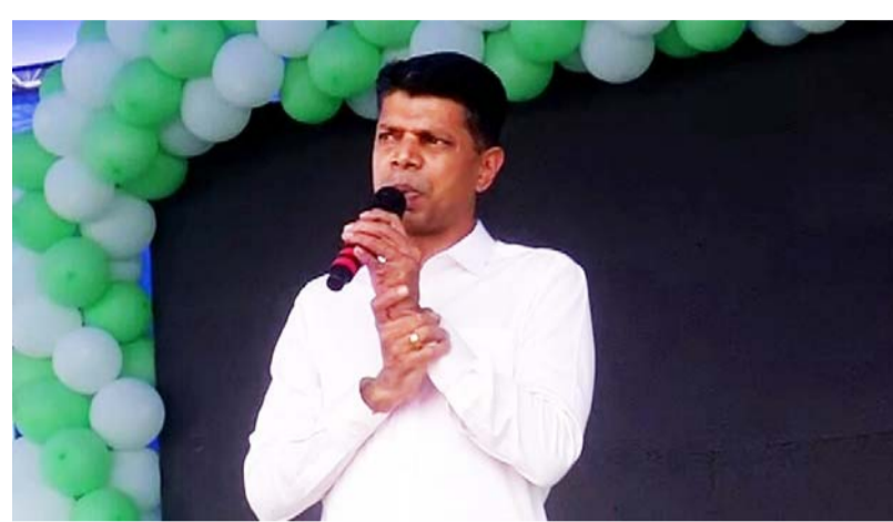
କଟକର ମେଡିକାଲ ଡାକ୍ତରୀ କେନାଲକୁ ନୂଆ କେନ୍ଦ୍ରାପଡ଼ାରୁ ହେଲିକପ୍ଟରରେ ଆସିଲା ବେଳେ ରୂପ ଦିଆଯିବା ପଛର କାରଣ କହିଥିଲେ ଶ୍ରୀ ପାଣିଆନ । ସେ କହିଥିଲେ ଯେ, ଥରେ ମୁଖ୍ୟମନ୍ତ୍ରୀ ଡାକ୍ତରୀ କେନାଲ କଥା କହିଥିଲେ । ଡାକ୍ତରୀ କେନାଲର ସିତିହ୍ୟ (ପୃଷ୍ଠା ୭ରେ)

ଭୁବନେଶ୍ୱର, ୫।୧ ନ୍ୟୁଜ୍ ବ୍ୟୁରୋ ବତ୍ତାକୃତ ପରିକ୍ରମା ପ୍ରକଳ୍ପ ଆଉ ବଡ଼ ମେଡିକାଲର ରୂପାନ୍ତରଣ ମୁଖ୍ୟମନ୍ତ୍ରୀଙ୍କ ବଡ଼ ସ୍ୱପ୍ନ ଥିଲା । କଟକ ଏସପିବି ମେଡିକାଲର ରୂପାନ୍ତରଣ କରାଯାଇଛି । ମୁଖ୍ୟମନ୍ତ୍ରୀ ଉଦ୍ଦେଶ୍ୟରେ, ଚିକିତ୍ସା ପାଇଁ କେହି ଓଡ଼ିଶା ବାହାରକୁ ନଯାଆନ୍ତୁ । ଏମସ ପୂର୍ବ ଭଳି ଏସପିବିକୁ କରିବାକୁ ଉଦ୍ଦେଶ୍ୟରେ । ଏବେ ଏହାକୁ ଭାରତରେ ୫ ନମ୍ବର ବଡ଼ ହସପିଟାଲ କରିଛନ୍ତି । ବତ୍ତାକୃତ ପରିକ୍ରମା ପ୍ରକଳ୍ପ ଆଉ ବଡ଼ ମେଡିକାଲର ରୂପାନ୍ତରଣ କାମ ମୁଖ୍ୟମନ୍ତ୍ରୀଙ୍କ ବଡ଼ ସ୍ୱପ୍ନ ଥିଲା ବୋଲି କହିଛନ୍ତି ୫-ଟି ତଥା ଆମ ଓଡ଼ିଶା ଅଧ୍ୟକ୍ଷ ଭି.କେ. ପାଣିଆନ । ସେ କହିଛନ୍ତି ଆସନ୍ତା ଶହେ ବର୍ଷକୁ ପୁନଃ କରି ମୁଖ୍ୟମନ୍ତ୍ରୀ ନବୀନ ପଟ୍ଟନାୟକ ଏପରି ରୂପାନ୍ତରଣ କରିଛନ୍ତି । ଦିନିକିଆ କଟକ ଗସ୍ତରେ ଯାଇଥିବାବେଳେ ଉପର ବାଲିଯାତ୍ରା ପଡିଆଠାରେ ଆୟୋଜିତ ସଭାରେ ଏହା କହିଛନ୍ତି ଶ୍ରୀ ପାଣିଆନ ।