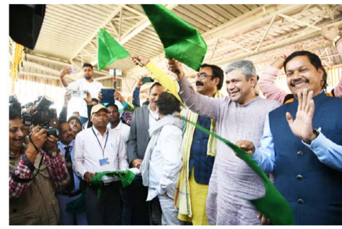
ଭୁବନେଶ୍ୱର-ନୂଆଗାରୋଡ଼-ଭୁବନେଶ୍ୱର ପାସେଞ୍ଜର ସେକ୍ସନ, ୦୮୪୨୩/ ୦୮୪୨୪ ପୁରୀ-ନୂଆଗାରୋଡ଼-ପୁରୀ ପାସେଞ୍ଜର ସେକ୍ସନ, ୦୮୪୨୯/୦୮୪୩୦

ଦଶପଲ୍ଲୀ, ୬।୧ ନୂଆଳୁ ବ୍ୟୁରୋ ଦଶପଲ୍ଲୀ ରେଳ ଷ୍ଟେସନରେ ପ୍ରାୟ ୮ ହଜାର ଲୋକଙ୍କ ସମାଗମରେ ଆୟୋଜିତ କାର୍ଯ୍ୟକ୍ରମରେ ରେଳ ଯୋଗାଯୋଗ ଓ ଇଲେକ୍ଟ୍ରୋନିକ୍ସ ଓ ସୂଚନା ପ୍ରଯୁକ୍ତିମନ୍ତ୍ରୀ ଅଶ୍ୱିନୀ ଦେବିଶଙ୍କର ଶନିବାର ନବନିର୍ମିତ ନୂଆଗାରୋଡ଼ - ଦଶପଲ୍ଲୀ ରେଳ ସେକ୍ସନ, ଦଶପଲ୍ଲୀ ରେଳଷ୍ଟେସନ ବିଲ୍ଡିଂକୁ ଉଦ୍‌ଘାଟନ କରିବା ସହ ଦଶପଲ୍ଲୀକୁ ଯାତ୍ରୀବାହୀ ଟ୍ରେନ୍ ଚଳାଚଳକୁ ପତାକା ଦେଖାଇ ଶୁଭାରମ୍ଭ କରିଛନ୍ତି । ପତାକା ଉତ୍ତୋଳନ ପରେ ୪ଟି ପାସେଞ୍ଜର ଟ୍ରେନ୍, ୧୮୪୨୩/୧୮୪୨୪ ଭୁବନେଶ୍ୱର-ନୟାଗଡ଼ ଟାଉନ୍-ଭୁବନେଶ୍ୱର ଏକ୍ସପ୍ରେସ୍, ୦୮୪୨୯/୦୮୪୩୦