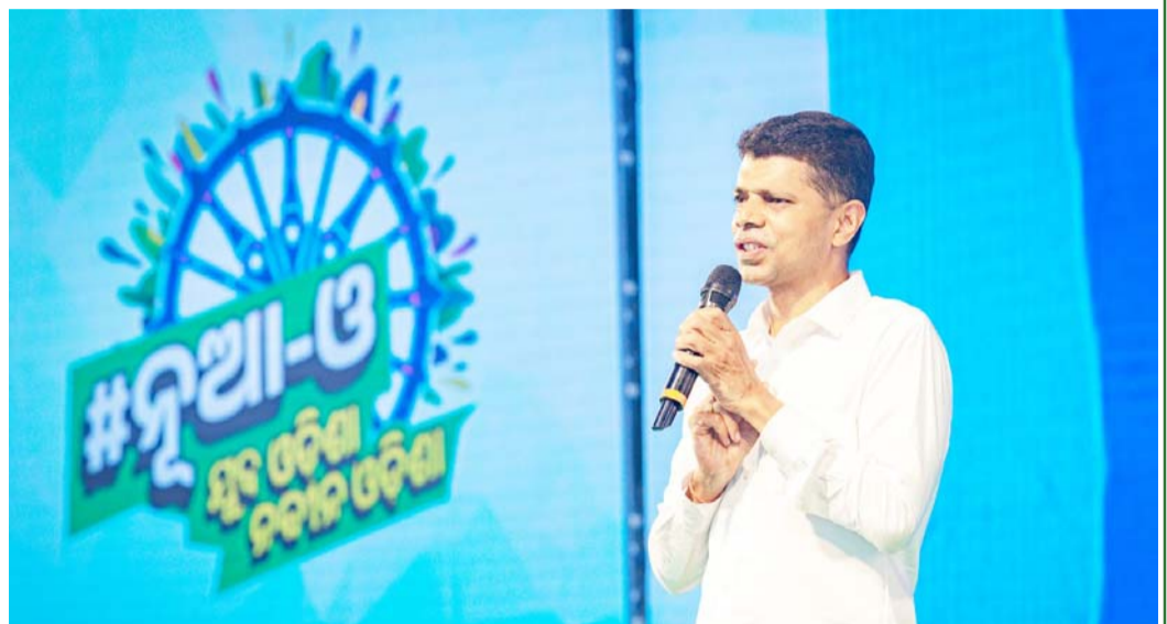
ଓଡ଼ିଶା ଗଠନରେ ଯୁବଶକ୍ତିର ଯୋଗଦାନ ପାଇଁ ପ୍ରେରଣା ଦେଇଥିଲେ। ନୂଆ-ଓ କାର୍ଯ୍ୟକ୍ରମରେ ଯୋଗ ଦେଇ ସେ କହିଥିଲେ ଯେ ଏହା ଯୁବକମ୍ପଦତାମାନଙ୍କ ପାଇଁ ବିପୁଳ ସୁଯୋଗ ସୃଷ୍ଟି କରିଛି । ଏହି କାର୍ଯ୍ୟକ୍ରମ ଦ୍ୱାରା ସେମାନେ (ପୃଷ୍ଠା ୭ରେ)