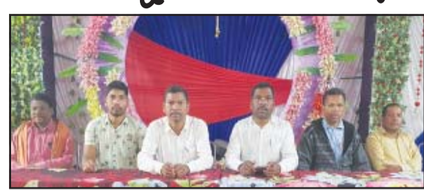
ମୁଖ୍ୟମନ୍ତ୍ରୀ ତୁରନ୍ତ ଏହାର ସୁବିଚାର କରି ରାଇଘର ଚାନ୍ଦିଆ ଗଣ ସମୟରେ କମିଟିର କର୍ମକର୍ତ୍ତା, ସଭ୍ୟ ଭେଟି ଅସମ୍ପୂର୍ଣ୍ଣ ଗୁଡ଼ିକୁ ସଂପୂର୍ଣ୍ଣ କରିବା ପାଇଁ ଆର୍ଥିକ ସହାୟତା ପ୍ରଦାନ କରିବା ପାଇଁ ଏକ ଅନୁରୋଧ ପତ୍ର ପ୍ରଦାନ କରାଯାଇଛି ।