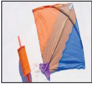
ଭୁବନେଶ୍ୱର, ୧୪।୧: ଦୁଧିକବୁଦ୍ଧରେ

ଗୁଡ଼ି ଉଡ଼ାଇବା ସମୟରେ ସଡ଼କଚିତା ଅବଲମ୍ବନ କରିବା ସହ ବିପଦଜନକ ମାଞ୍ଜା ପୂଡ଼ା ବ୍ୟବହାର ନ କରି ସାଧାରଣ ସୁଡ଼ାରେ ଗୁଡ଼ି ଉଡ଼ାଇବାକୁ ଓଡ଼ିଶା ପୋଲିସ ପରାମର୍ଶ ଦେଇଛି। ମାଞ୍ଜା ପୂଡ଼ା ବ୍ୟବହାର କରି ଗୁଡ଼ି ଉଡ଼ାଇବା ଆଲନଦଃ ଦଃକ୍ଷ୍ୟଣ୍ୟ ବୋଲି କମିଶନରେଟ୍ ପୋଲିସ ପକ୍ଷରୁ କୁହାଯାଇଛି। ବିପଦଜନକ ମାଞ୍ଜା ପୂଡ଼ା ବିକ୍ରୟ କିମ୍ବା ବ୍ୟବହାର ଉପରେ ଲାଗିବ ରୋକ୍। ଗୁଡ଼ି ଉଡ଼ାଇବା ବେଳେ ନିୟମ ଅବମାନନା କଲେ ହେବ କାର୍ଯ୍ୟାନୁଷ୍ଠାନ। ମନର ସଂକ୍ରାନ୍ତିରେ ଗୁଡ଼ି ଉଡ଼ାଇବାର ପରମ୍ପରା ରହିଛି। ଗୁଡ଼ି ଉଡ଼ାଇବା ପାଇଁ ମାଞ୍ଜା ପୂଡ଼ା ବ୍ୟବହାର କରିଆଣି ଲୋକେ। ଏହି ସୁଡ଼ା ଅନେକ ଲୋକଙ୍କ ଜୀବନ ନେଇଆଏ। ତେଣୁ ଗୁଡ଼ି ଉଡ଼ାଇବା ବେଳେ ମାଞ୍ଜା ପୂଡ଼ା ବ୍ୟବହାର ନକରିବାକୁ ଅପିଲ କରିଛି କମିଶନରେଟ୍ ପୋଲିସ।