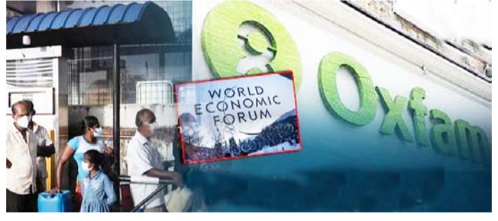
ଡଲାର ହୋଇଛି । ସୋମବାର ସମ୍ପତ୍ତି ପ୍ରତି ଘଣ୍ଟା ଏକ ଲକ୍ଷ ୪୦ କୋଟି ଡଲାର ହାରରେ ବଢ଼ିଛି । ଅକ୍ସଫର୍ମର କହିବା ଅନୁସାରେ ୨୦୨୦ପରଠୁ (ପୃଷ୍ଠା ୭ରେ)

ନୂଆଦିଲ୍ଲୀ, ୧୫।୧ : ଦୁନିଆର ସବୁଠୁ ପାଞ୍ଚ ଧନୀ ବ୍ୟକ୍ତିଙ୍କ ସମ୍ପତ୍ତି ୨୦୨୦ ମସିହାରୁ ବଡ଼ ଦ୍ୱିଗୁଣା ହୋଇଛି । ଦ୍ୟାରିଟି ଅକ୍ସଫର୍ମ ଏକ ରିପୋର୍ଟ ଜାରି କରି ଏହି ଦାବି କରିଛି । ଖୁଲିତ ଲକ୍ଷକୋଟିଙ୍କ ଫୋରମର ତାତକାଳୀନ ହୋଇଥିବା ବୈଦିକରେ ଏହି ରିପୋର୍ଟ ଜାରି କରାଯାଇଛି । ରିପୋର୍ଟରେ କୁହାଯାଇଛି ଯେ ଦୁନିଆର ଶୀର୍ଷ ପାଞ୍ଚ ଧନୀଙ୍କ ମୋଟ ସମ୍ପତ୍ତି ୨୦୨୦ ପରଠୁ ଏବେ ସୁଦ୍ଧା ୪୦୫ ବିଲିୟନ ଡଲାର ବଡ଼ି ୮୬୯ ବିଲିୟନ