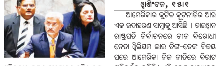
ସମ୍ମିଳନୀର ସଫଳ ଆୟୋଜନ ସହିତ ରକ୍ଷ-ଯୁକ୍ତେନ ଯୁଦ୍ଧ ଛିତରେ ଅନ୍ତର୍ଜାତୀୟ ସ୍ତରରେ ଭାରତର ଗୁରୁତ୍ୱ ବଢ଼ିଛି । ପ୍ରତ୍ୟେକ ଗୁରୁତ୍ୱପୂର୍ଣ୍ଣ ଅନ୍ତର୍ଜାତୀୟ ପ୍ରସଙ୍ଗରେ ନୂଆଦିଲ୍ଲୀ ସହ ବିଚାରବିମର୍ଶ କରାଯାଇଛି ବୋଲି ଜୟଶଙ୍କର କହିଛନ୍ତି । ଭାରତ-ଚୀନ ସଂପର୍କରେ ସେ କହିଛନ୍ତି, ଗୋଟିଏ ପଡ଼େ ସାମାଜିକ ସଂସ୍କୃତି (ପୃଷ୍ଠା ୭ରେ)

ନାଗପୁର, ୧୫।୧ : ଜାତିସଂଘର ପ୍ରାସଙ୍ଗିକତା ହ୍ରାସ ପାଇଛି । ବିଶ୍ୱର ୫ଟି ଦେଶର ନିୟନ୍ତ୍ରଣ କମିଥିବା ଏକ ରିପୋର୍ଟ ହୋଇଛି । ଏହି ୫ଟି ଦେଶ ମଧ୍ୟରୁ କେତୋଟି ଦେଶ ବିଶ୍ୱର ବଡ଼ ଆର୍ଥିକ ଶକ୍ତି ହୋଇ ରହିନାହିଁ । ଅନ୍ୟପକ୍ଷରେ ଗତ ଦଶନ୍ଧିରେ ଭୌଗୋଳିକ ଏବଂ ରାଜନୈତିକ କ୍ଷେତ୍ରରେ ଭାରତର ନାଟକୀୟ ଉନ୍ନତି ହୋଇଛି । ଜରାଣ ସମର୍ଥ ହୁଡ଼ି ମିଳିସିଆ ଉପରେ ଆମେରିକା ଓ ବ୍ରିଟେନର ମିଳିତ ଆକ୍ରମଣ ପରେ ବୈଦେଶିକ ବ୍ୟାପାର ମନ୍ତ୍ରୀ ଏସ ଜୟଶଙ୍କର ନାଗପୁରଠାରେ ଆୟୋଜିତ ଏକ କାର୍ଯ୍ୟକ୍ରମରେ ଏହା କହିଛନ୍ତି । କୋଭିଡ଼-୧୯ କୁଟନୀତି ଏବଂ ୯-୨୦