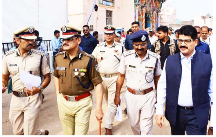
ସେହିଭଳି ୧୦୦ ଜଣ ବରିଷ୍ଠ ପୋଲିସ୍ ଅଧିକାରୀ, ୨୫୦ଜଣ ସବ୍ ଇନ୍ସପେକ୍ଟର, ୪ଟି ବୋମା ନିଶ୍ଚିତକାରୀ ଟିମ୍, ୩ଟି ଅତ୍ୟାଧୁନିକ ଏସିକ୍ୟୁରିଟି ଟିମ୍, ସାଧା ଯୋଷାକଧାରୀ ପୋଲିସ୍ ସହ ୪ ଆକିଆ ସୁରକ୍ଷା ବ୍ୟବସ୍ଥା ଗ୍ରହଣ କରାଯିବ । ସଭାସ୍ଥଳକୁ ଏବଂ ଯଜ୍ଞସ୍ଥଳକୁ କେବଳ ପାସ୍ ପାଇଥିବା ବ୍ୟକ୍ତିଙ୍କୁ ହିଁ ପ୍ରବେଶ ଅନୁମତି ମିଳିବ । ସଭାସ୍ଥଳରେ ଏ ଶହ ଅତିଥି ବସିବା ଭଳି ବ୍ୟବସ୍ଥା କରାଯାଇଛି । ଯଜ୍ଞସ୍ଥଳକୁ କେବଳ ପୁଲୀରେ ନିୟୋଜିତ ଥିବା ଆରକ୍ଷୀ, ଶ୍ରୀମନ୍ଦିର ପରିଚଳନା କମିଟି ସଦସ୍ୟଙ୍କ ପ୍ରବେଶ ପାଇଁ ଅନୁମତି ରହିଛି । ପୋଲିସ୍ ଡିଭିଜନ୍ ଅଧିକାରୀଙ୍କ ସହ ଲୋକାର୍ପଣ ଉତ୍ସବରେ ୮୦ ପ୍ଲାଟ୍ଫର୍ମ ଫୋର୍ସ ଅନୁମତି ମିଳିବ । ସଭାସ୍ଥଳରେ ଏ ଶହ ଅତିଥି ବସିବା ଭଳି ବ୍ୟବସ୍ଥା କରାଯାଇଛି ।