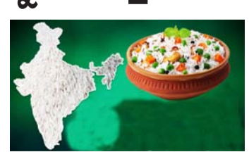
ପାଦଦେଶର ନିର୍ଦ୍ଦିଷ୍ଟ କେତେକ ଅଞ୍ଚଳରେ ଉପୁଦନ ହୋଇ ଆସୁଛି । ଭାରତ ସମେତ ପାକିସ୍ତାନରେ ମଧ୍ୟ ଏହି ଗବେଷକ ଉପୁଦନ କରାଯାଇଛି । ଏହାର ସ୍ୱାଦ ଓ ସୁଗନ୍ଧ ହେଉଛି ଏହି ଗବେଷକ ସ୍ୱତନ୍ତ୍ରତା । ଭାରତରେ ୩୪ ପ୍ରକାରର ବାସ୍ତୁତତ୍ତ୍ୱ ଗବେଷକ ଉପୁଦନ କରାଯାଇଥାଏ । ଏଥିରେ ବାସ୍ତୁତତ୍ତ୍ୱ ୨୧୭, ଭାରତୀୟ ଉପମହାଦେଶୀୟ ହିମାଳୟ (ପୃଷ୍ଠା ୭ରେ)

ନୂଆଦିଲ୍ଲୀ, ୧୫।୧ : ଭାରତୀୟ ବାସ୍ତୁତତ୍ତ୍ୱ ଗବେଷକ ବିଶ୍ୱର ଶ୍ରେଷ୍ଠ ଗବେଷକ ମାନସ୍ୟା ମିଲିଛି । ଲୋକପ୍ରିୟ ଖାଦ୍ୟ ବିଶ୍ୱାସନାକାରୀ ସଂସ୍ଥା ଚେଷ୍ଟ ଆଚଳାସ୍ତ ପକ୍ଷରୁ ବାସ୍ତୁତତ୍ତ୍ୱ ଗବେଷକ ବର୍ଷ ୨୦୨୩-୨୪ ପାଇଁ ବିଶ୍ୱର ସର୍ବୋତ୍ତମ ଗବେଷକ ମାନସ୍ୟା ପ୍ରଦାନ କରାଯାଇଛି । ନିକଟରେ ଏହି ସଂସ୍ଥା ବିଶ୍ୱର ୧୦୦ ଶ୍ରେଷ୍ଠ ବ୍ୟକ୍ତିଙ୍କ ତାଲିକାରେ ଭାରତକୁ ୧୧ ତମ ସ୍ଥାନରେ ରଖିଥିଲା । ଏବେ ଭାରତର ବାସ୍ତୁତତ୍ତ୍ୱ ଗବେଷକ ଚେଷ୍ଟ ଆଚଳାସ୍ତ ଦୁନିଆର ସବୁଠାରୁ ଭଲ ଗବେଷକ ବୋଲି କହିଛି । ସୁଗନ୍ଧିତ ବାସ୍ତୁତତ୍ତ୍ୱ ଗବେଷକ ଶତାଧାରୀ ଧରି ଭାରତୀୟ ଉପମହାଦେଶୀୟ ହିମାଳୟ