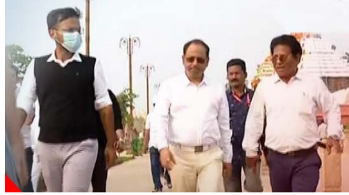
ଖୋଲାଯିବ । ଶ୍ରୀମନ୍ଦିର ପରିକ୍ରମା ପ୍ରକଳ୍ପର ଆମ ସମସ୍ତଙ୍କ ଦାୟିତ୍ୱ । ସୋମବାର ଠାରୁ ସୁଛତା ରକ୍ଷା ସହ ରକ୍ଷଣାବେକ୍ଷଣ କରିବା