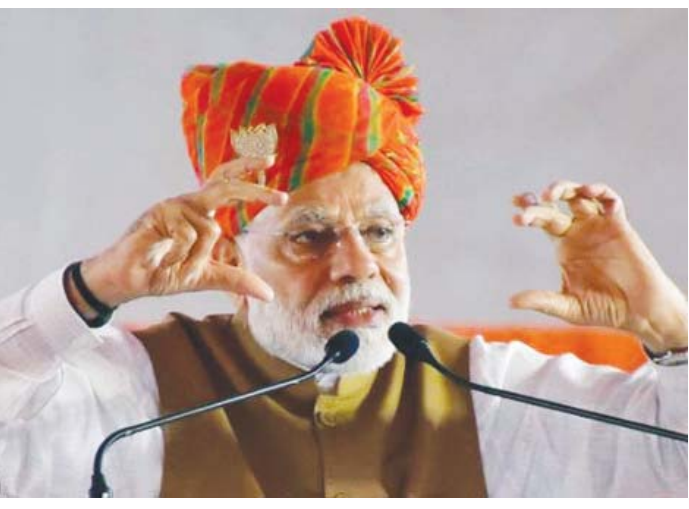
ନୂଆଦିଲ୍ଲୀ, ୧୯।୧ ମହାରାଷ୍ଟ୍ରର ଘୋଲାପୁରରେ ପ୍ରଧାନମନ୍ତ୍ରୀ ଶ୍ରୀମନ୍ତ୍ରୀଙ୍କୁ ଘର ଚାରି ଦେଇଛନ୍ତି। ଏହି ଯୋଜନା ଉଦ୍‌ଘାଟନ କରିବା ସହ ମୋଦି ୧୫ ହଜାର ଶ୍ରମିକଙ୍କୁ ଘର ଚାରି (ପୃଷ୍ଠା ୭ରେ)