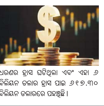
ଧରଣର ହ୍ରାସ ଘଟିଥିଲା ଏବଂ ଏହା ୬ ବିଲିୟନ ଡଲାର ହ୍ରାସ ପାଇ ୬୧୭.୯୩ ବିଲିୟନ ଡଲାରରେ ପହଞ୍ଚିଛି। ଏହି ସମୟ (ପୃଷ୍ଠା ୭ରେ)

ନୂଆଦିଲ୍ଲୀ, ୧୯।୧ ଦେଶର ବୈଦେଶିକ ମୁଦ୍ରା ଭଣ୍ଡାରରେ ପୁଣି ବୃଦ୍ଧି ଦେଖିବାକୁ ମିଳିଛି। ଚିକିତ୍ସା ବ୍ୟାଙ୍କ ପକ୍ଷରୁ ପ୍ରକାଶିତ ତଥ୍ୟ ଅନୁଯାୟୀ, ୨୦୨୪ ଜାନୁଆରୀ ୧୨ରେ ଶେଷ ହୋଇଥିବା ସପ୍ତାହରେ ବିଦେଶୀ ମୁଦ୍ରା ଭଣ୍ଡାର ୧.୬୩ ବିଲିୟନ ଡଲାର ବୃଦ୍ଧି ପାଇ ୬୧୮.୯୩ ବିଲିୟନ ଡଲାରରେ ପହଞ୍ଚିଛି। ପ୍ରଥମ ସପ୍ତାହରେ ବିଦେଶୀ ମୁଦ୍ରା ଭଣ୍ଡାରରେ ବଡ଼