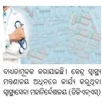
ବାଧ୍ୟତାପୂର୍ଣ୍ଣକ କରାଯାଇଛି। କେନ୍ଦ୍ର ସ୍ୱାସ୍ଥ୍ୟ ମନ୍ତ୍ରଣାଳୟ ଅଧିକାରୀ କାର୍ଯ୍ୟ କରୁଥିବା ସ୍ୱାସ୍ଥ୍ୟସେବା ମହାନିର୍ଦ୍ଦେଶାଳୟ (ଡିଜିଏଏଏସ୍) କହିବା ପାଇଁ ଏହି ପଦକ୍ଷେପ (ପୃଷ୍ଠା ୭ରେ)

ନୂଆଦିଲ୍ଲୀ, ୧୯।୧ ଦେଶରେ ଆର୍ଷିବାୟୋଟିକ୍ସ ଔଷଧର ବ୍ୟବହାର ବୃଦ୍ଧି ପାଇବାରେ ଲାଗିଛି। ଏହା ମନୁଷ୍ୟ ସ୍ୱାସ୍ଥ୍ୟ ପାଇଁ କ୍ଷତିକାରକ। ଏହାକୁ ଦୂଷିତ ରଖି ଆର୍ଷିବାୟୋଟିକ୍ସ ବ୍ୟବହାରକୁ ପ୍ରୋତ୍ସାହନ ନ ଦେବା ପାଇଁ କେନ୍ଦ୍ର ସରକାର ଡାକ୍ତରମାନଙ୍କୁ କହିଛନ୍ତି। ଯଦି ରୋଗୀଙ୍କୁ ଏହା ଦିଆଯାଉଛି ତେବେ ତାହାର କାରଣ ଦର୍ଶାଇବାକୁ କୁହାଯାଇଛି। ଏହି ନିୟମକୁ