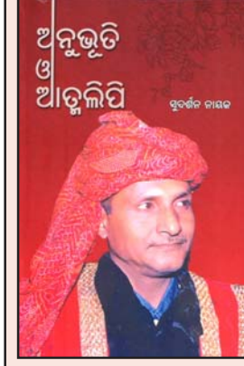
ଅନୁଭୂତି ଓ ଆତ୍ମଲିପି