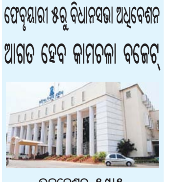
ଫେବୃୟାରୀ ୫ରୁ ବିଧାନସଭା ଅଧିବେଶନ ଆଗତ ହେବ କାମଚଳା ବଜେଟ୍