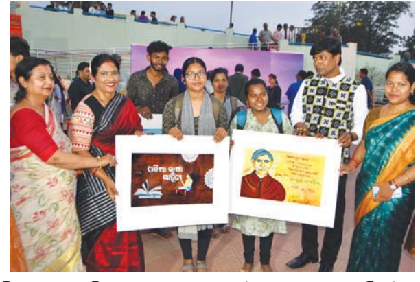
ଭୁବନେଶ୍ୱର : ପ୍ରଥମ ବିଶ୍ୱ ଓଡ଼ିଆ ଭାଷା ସମ୍ମିଳନୀ-୨୦୨୪ କେନ୍ଦ୍ର ବିଏମସି ପକ୍ଷରୁ ଉତ୍କଳ କଳାମଣ୍ଡଳରେ ଆୟୋଜିତ 'ଅକ୍ଷର'କୁ ବୁଲି ଦେଖୁଛନ୍ତି ମେଣ୍ଡର, କମିଶନର ଓ ଅନ୍ୟମାନେ ।