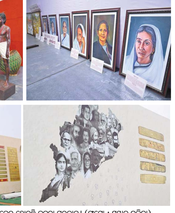
ଭୁବନେଶ୍ୱର : ପ୍ରଥମ ବିଶ୍ୱ ଓଡ଼ିଆ ଭାଷା ସମ୍ମିଳନୀ-୨୦୨୪ ନିମନ୍ତେ ଓଡ଼ିଆ ଭାଷା ସାହିତ୍ୟକୁ ନେଇ ସଜେଇ ହୋଇଛି ଜନତା ମନ୍ଦିର ।