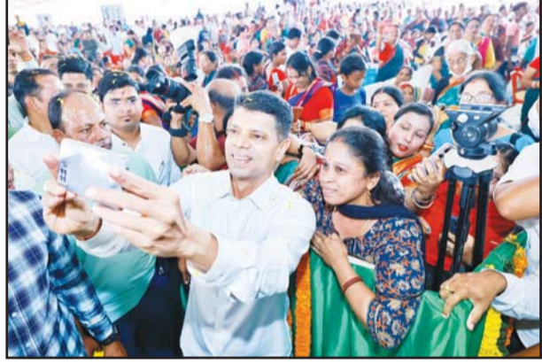
ପୁରୀ ଗଣ ଅବସରରେ '୫-ଟି ଓ ନବୀନ ଓଡ଼ିଶା' ଅଧ୍ୟକ୍ଷ ଭି.କେ. ପାଣ୍ଡିଆନ ବିଭିନ୍ନ ପ୍ରକଳ୍ପ କାର୍ଯ୍ୟ ଅନୁଷ୍ଠାନ କରିବା ସହ ଛାତ୍ରଛାତ୍ରୀ ଓ ସାଧାରଣ ଜନତାଙ୍କୁ ଭେଟି ସେମାନଙ୍କ ସମସ୍ୟା ରୁଚୁଛନ୍ତି ।