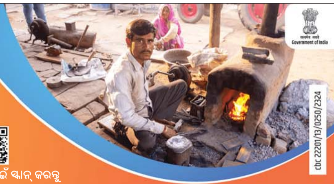
ଡିଏ 22/01/23 10/50/2324