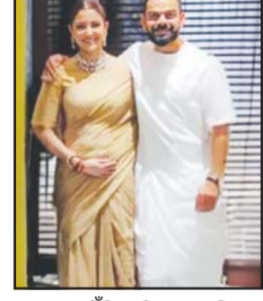
ତେବେ କାର୍ଯ୍ୟକ୍ରମ ନେତୃତ୍ୱରେ ଯେ ନେଇ କିଛି ଜଣା ନଥିଲେ । ଏବେ ବିରାଟ କାର୍ଯ୍ୟକ୍ରମ ଟି ୨୦ ଷ୍ଟାର୍ କୋହଲି ବିରାଟ କୋହଲିଙ୍କୁ ଶୁଭେଚ୍ଛା ପତ୍ର ପଠାଇଛନ୍ତି ।

ନୂଆବିଲ୍ ପୁଣି ମା' ହେବେ ଅନୁଷ୍ଠା ଶର୍ମା । ବାପା ହେବେ ଭାରତୀୟ ଟି ୨୦ ଷ୍ଟାର୍ କ୍ରିକେଟର ବିରାଟ କୋହଲି । ନିଜ ଦ୍ୱିତୀୟ ସନ୍ତାନକୁ ଘରକୁ ସ୍ୱାଗତ କରିବେ ବିଶ୍ୱାସୀ ।