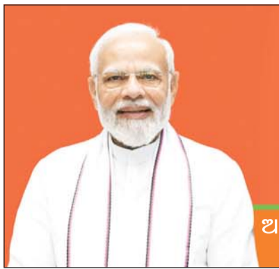
ଆମ ସଂକଳ୍ପ ବିକଶିତ ଭାରତ

• ବର୍ଷ-୩୯ • ସଂଖ୍ୟା-୧୦ • ୫ ଫେବୃଆରୀ ୨୦୨୪, ସୋମବାର • ଭୁବନେଶ୍ୱର • Vol -31 • Issue-10 • 5 th February 2024, Monday • Bhubaneswar | Licensed to post without pre-payment of postage No-BN-60/22-24