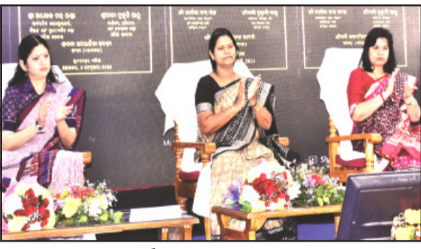
ଆଧୁନିକ ଶୈଳୀରେ ନିର୍ମିତ ଏହି ସଂଯୋଗ କୋଠା ୩୩୬୦ ବର୍ଗମିଟର ଅଞ୍ଚଳ ପରିମିତ । ଏହାକୁ ସ୍ୱତନ୍ତ୍ର ଭାବେ ଆନ୍ତର୍ଜାତୀୟ ବିମାନ ଯାତ୍ରୀଙ୍କ ଆଗମନ ପାଇଁ ବ୍ୟବହାର କରାଯିବ । କୋଠାରେ ଯାତ୍ରୀଙ୍କ ପାଇଁ