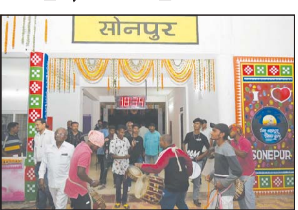
କରିବ । ପୁରୀ-ସୋନପୁର ଏକପ୍ରେସ୍ ପୁରୀ ଷ୍ଟେସନ ଠାରୁ ପ୍ରତି ଗୁରୁବାର ଦିନ

ଭୁବନେଶ୍ୱର, ୯/୨: ନ୍ୟୁଜ୍‌ସ୍କାନ୍ଦେ ଶୁକ୍ରବାର ସୋନପୁର ରେଳ ଷ୍ଟେସନ ଠାରେ ସୋନପୁର-ପୁରୀ ସାପ୍ତାହିକ ଏକପ୍ରେସ୍ ପ୍ରାରମ୍ଭିକ ଚଳାଚଳ ଦିବସରେ ପୁସ୍ତକପୁର ଜିଲ୍ଲାର ଲୋକମାନେ ଉଭୟ ଟ୍ରେନ ଓ ଯାତ୍ରୀମାନଙ୍କୁ ଭବ୍ୟ ସ୍ୱାଗତ କରିଥିଲେ । ଏହି ଟ୍ରେନ ଗଠିତ ହେବା ପରେ ଓଡ଼ିଶା ଜିଲ୍ଲା ଯାତ୍ରା ସୋନପୁର, ବଲାଙ୍ଗୀର, ବରଗଡ଼ ଏବଂ ସମ୍ବଲପୁର ସହିତ ପୁରୀ, ଖୋର୍ଦ୍ଧା, କଟକ, ତେଜାନାଳ ଓ ଅନୁଗୁଳ ଜିଲ୍ଲାକୁ ସଂଯୋଗ କରୁଛି । ଏହି ଟ୍ରେନ ଏହି ଅଞ୍ଚଳର ଛାତ୍ର, କୃଷକ, ଚାଷିଯାତ୍ରୀ ଏବଂ ବ୍ୟବସାୟୀ ମାନଙ୍କୁ ଲାଭ ପ୍ରଦାନ