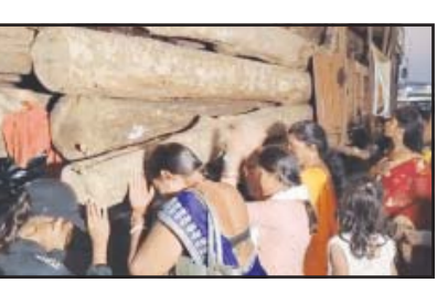
ପୁରୀରଥକାଠ, ଚଳଚର୍ଚ୍ଚିତ ପୁରୀ ଯୋଗାଣରେ ରଥ ନିର୍ମାଣ ପାଇଁ ନୟାଗଡ଼ ବନ୍ଦୁଖରୁ କାଠ ଯୋଗାଇ ଦିଆଯାଇଛି । ଶୁକ୍ରବାର ପ୍ରଥମ ପର୍ଯ୍ୟାୟରେ ତିନୋଟି ଟ୍ରକରେ ୧୦୨ ଖଣ୍ଡ କାଠ ପଠାଯାଇଛି । ଏଥିରେ ୫୨ ଖଣ୍ଡ ଥରଣ ଏବଂ ୫୦ ଖଣ୍ଡ ଅସନ କାଠ ରହିଛି । ସକାଳେ ବନ୍ଦୁଖରୁ ମହାବୀର ମନ୍ଦିର ସମ୍ମୁଖରେ ପୂଜାର୍ଚ୍ଚନା କରାଯିବପରେ ଟ୍ରକ ଦୁଇଟି ଯାତ୍ରା ଆରମ୍ଭ କରିଥିଲା । ତେବେ ନୟାଗଡ଼ ବ୍ୟତୀତ ବୌଦ୍ଧ, ଗୁମ୍ଫା ଏବଂ ରେଡ଼ିଫୋର ବନ୍ଦୁଖରୁ କାଠ ସଂଗ୍ରହ କରାଯାଇଛି । ପରମ୍ପରା ଅନୁଯାୟୀ ସରସ୍ୱତୀ ପୂଜା ପୂର୍ବରୁ ପ୍ରଥମ ରଥକାଠ ପୁରୀ ରଥଖଳାରେ ପହଞ୍ଚିବା ପାଇଁ ନିୟମ ରହିଛି ।

ପୁରୀ, ୯/୨: ନ୍ୟୁଜ୍‌ସ୍କାନ୍ଦେ ବି. ଶ. ପ୍ର. ସି. ବି. ରଥଯାତ୍ରା ପାଇଁ ପୁରୀରେ ପହଞ୍ଚିଲା ପ୍ରଥମ ପର୍ଯ୍ୟାୟ ରଥକାଠ । ନୟାଗଡ଼ ରେଞ୍ଜରୁ ତିନୋଟି ଟ୍ରକରେ ଆସିଥିବା ପ୍ରାୟ ୧୦୨ ଖଣ୍ଡ ରଥକାଠ । ଆସନ୍ତା ୧୪ ତାରିଖ ଶ୍ରୀପଞ୍ଚମୀ ଦିନ ବିଧି ଅନୁଯାୟୀ ଶ୍ରୀମନ୍ଦିର କାର୍ଯ୍ୟାଳୟ ସମ୍ମୁଖରେ ରଥ ନିର୍ମାଣ ପାଇଁ ତିନୋଟି ରଥକାଠ ପୂଜା କରାଯିବ ।