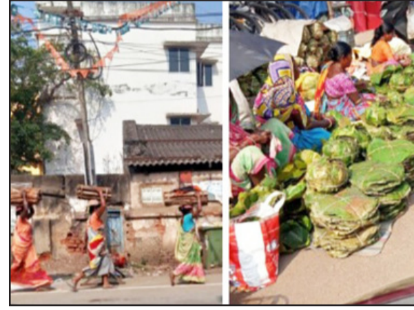
ଜାତିକା ପାଇଁ ଜଙ୍ଗଲ ଯତ୍ନ