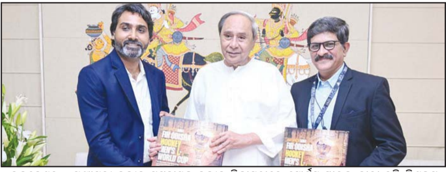
ଭୁବନେଶ୍ୱର : ମୁଖ୍ୟମନ୍ତ୍ରୀ ନବୀନ ପଟ୍ଟନାୟକ ନବୀନ ନିବାସରେ ଷୋର୍ଟସ୍ଟୋରୀ ସ୍ତମ୍ଭର ଲୋକାରମ୍ଭ କରୁଛନ୍ତି।

ଭୁବନେଶ୍ୱର, ୧ମାର୍ଚ୍ଚ:ନ୍ୟୁଜ୍‌ସ୍କ୍ୟାରେ ମାଲକାନଗିରି ଜିଲ୍ଲାବାସୀଙ୍କ ପାଇଁ ଖୁବ୍ ଖବର। ଆସନ୍ତା ୫ ତାରିଖରୁ ମାଲକାନଗିରି ବିମାନ ବନ୍ଦରରୁ ଉଡ଼ିବ ବିମାନ। ଏନେଇ ପୂର୍ତ୍ତା ଦେଲେ ଏୟାର ଓଡ଼ିଶା ବିମାନ ଅଧିକାରୀ।