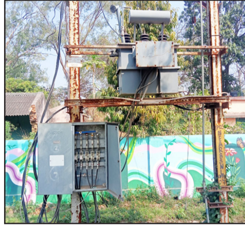
ଖୋଲାମୋଲାରେ ବିଦ୍ୟୁତ୍ ସରବେଷଣ