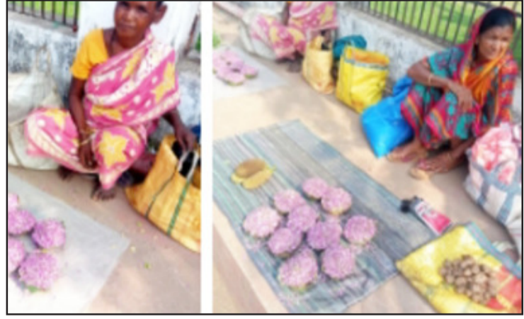
ଜଙ୍ଗଲରୁ ସଂଗୃହୀତ ଗିଳିରା ଫୁଲର ପସରା