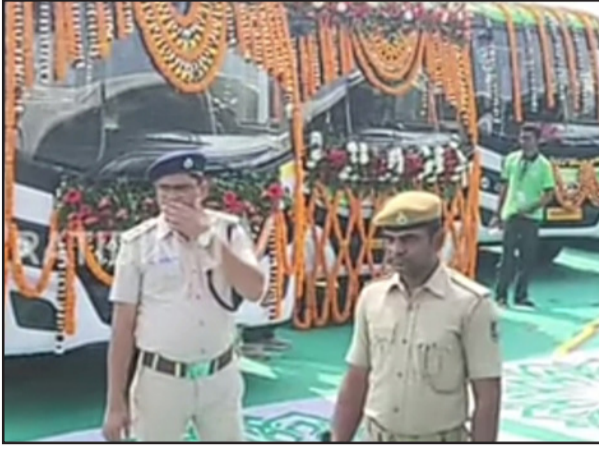
କେନ୍ଦ୍ରରେ: ଲକ୍ଷ୍ମୀ ବସ୍ ଦ୍ୱାରା ୧୦ ଲକ୍ଷରୁ ଅଧିକ ଲୋକ ଉପକୃତ ହେବେ