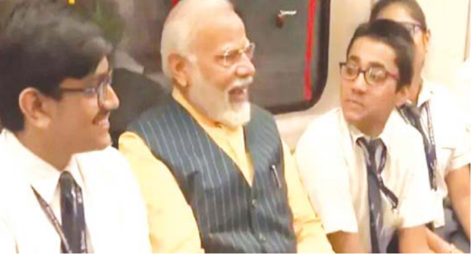
ନୂଆଦିଲ୍ଲୀ, ୬/୩ ପ୍ରଧାନମନ୍ତ୍ରୀ ନରେନ୍ଦ୍ର ମୋଦି ରୂପବାର କୋଲକାତାରେ ଭାରତର ପ୍ରଥମ ଅଖର ଖୁଚର ମେଟ୍ରୋ ରୁଟ୍ ବା ପାଣି ତଳ ମାର୍ଗର

ପରିବାରର ଲୋକମାନେ କିପରି ଭଲରେ ରହିବେ ସେଥିପାଇଁ ମୁଁ ସବୁବେଳେ କାମ କରି ଚାଲିଛି ଓ କରି ଚାଲିବି । ସୁଚନାଯୋଗ୍ୟ ଯେ ବିଜୁ ସ୍ୱାସ୍ଥ୍ୟ କଲ୍ୟାଣ ଯୋଜନାରେ ରାଜ୍ୟର ୧ କୋଟିରୁ ଅଧିକ ପରିବାର ଯାହାକି ରାଜ୍ୟ ଜନସଂଖ୍ୟାର ୮୦ ଭାଗ ହେବେ, କ୍ୟାସଲେସ୍ ଚିକିତ୍ସା ସୁବିଧା ପାଇଛନ୍ତି । ମହିଳାମାନଙ୍କ ପାଇଁ ୧୦ ଲକ୍ଷ ଟଙ୍କା ପର୍ଯ୍ୟନ୍ତ ଚିକିତ୍ସା ସୁବିଧା ଥିବାବେଳେ ପରିବାରର ଅନ୍ୟ ସଦସ୍ୟମାନଙ୍କ ପାଇଁ ୫ ଲକ୍ଷ ଟଙ୍କା ପର୍ଯ୍ୟନ୍ତ ଚିକିତ୍ସା ସୁବିଧା କରାଯାଇଛି । ଏହି ଯୋଜନାରେ ମାସକୁ ୧ ଲକ୍ଷ ୩୦ ହଜାର ହିତାଧିକାରୀ ୮୧.୬ଟି ପଞ୍ଜିକୃତ ବେସରକାରୀ ହସ୍ପିଟାଲରେ ଚିକିତ୍ସା ସୁବିଧା ପାଇଛନ୍ତି । (ପୃଷ୍ଠା ୭ରେ)