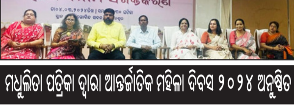
ମଧୁଲିତା ପତ୍ରିକା ଦ୍ୱାରା ଆୟୋଜିତ ମହିଳା ଦିବସ ୨୦୨୪ ଅନୁଷ୍ଠିତ

ଭୁବନେଶ୍ୱର, ବୁଧକ ବ୍ୟବସାୟ ପୁରୁଷ ଓ ନାରୀ ମଧ୍ୟରେ ଥିବା ପାରତ୍ୱ୍ୟ ଯୋଗୁଁ ଘଟୁଥିବା ବିଭିନ୍ନ ପ୍ରକାରର ଅସମତାକୁ ଦୂର କରିବା ପାଇଁ ଏକ ସମାବେଶ ଆୟୋଜିତ ହୋଇଥିଲା । ଏଥିରେ ବିଜୁବାବୁଙ୍କ ଚୈତ୍ତ୍ୱ ଚିତ୍ରରେ ଅଭିଯୋଗ ପୁସ୍ତକାଳୟ ଅର୍ପଣ କରାଯାଇଛି । ପ୍ରାୟ ୧୫୦ରୁ ଅଧିକ ପୁସ୍ତକାଳୟ ଅର୍ପଣ କରାଯାଇଛି । ଏଥିରେ ବିଜୁବାବୁଙ୍କ ଚୈତ୍ତ୍ୱ ଚିତ୍ରରେ ଅଭିଯୋଗ ପୁସ୍ତକାଳୟ ଅର୍ପଣ କରାଯାଇଛି ।