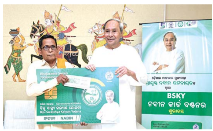
ଆପଣମାନଙ୍କ ଖୁସି ମୋ ଖୁସି । ସୁସ୍ଥ ସମାଜ ସହିତ ଏହାର ଗଭୀର ସଂପର୍କ ରହିଛି ବୋଲି ଏକ ସମୃଦ୍ଧ ରାଷ୍ଟ୍ରର ଆଧାର ଏବଂ ସ୍ୱାସ୍ଥ୍ୟ

ଭୁବନେଶ୍ୱର, ୬/୩ ରୁଧିକ ରୁଧିକେ ମୁଖ୍ୟମନ୍ତ୍ରୀ ନବୀନ ପଟ୍ଟନାୟକ ରୂପବାର ରାଜ୍ୟରେ ବିଏସକେଏଲ ନବୀନ କାର୍ତ୍ତର ଶୁଭାରମ୍ଭ କରିଛନ୍ତି । ନିୟମିତ ସରକାରୀ କର୍ମଚାରୀ ଓ ଆୟକର ଦେଉଥିବା ଲୋକଙ୍କୁ ଛାଡି ଗାଁର ସବୁ ଲୋକ ଏହି ସୁବିଧା ପାଇବେ । ରୂପବାର ଠାରୁ ଏହି କାର୍ତ୍ତ ବନ୍ଧନ ଆରମ୍ଭ ହୋଇଥିବା ବେଳେ ମୋ' ପରିଲା ଠାରୁ ହିତାଧିକାରୀମାନେ ଏହାର ସୁବିଧା ପାଇବେ । ରାଜ୍ୟ ସରକାରଙ୍କ ୫-ଟି ଉପକ୍ରମରେ ଏହି ଯୋଜନା କାର୍ଯ୍ୟକାରୀ କରାଯାଉଛି । ଏହି ଅବସରରେ ମୁଖ୍ୟମନ୍ତ୍ରୀ କହିଛନ୍ତି ଯେ ସାତେ ୪ କୋଟି ଓଡ଼ିଶାବାସୀ ହେଉଛନ୍ତି ମୋ ପରିବାର । ଆପଣମାନଙ୍କ ସୁଖ ଦୁଃଖରେ ମୁଁ ସବୁବେଳେ ରହିଛି ଓ ରହିଥିବି ।