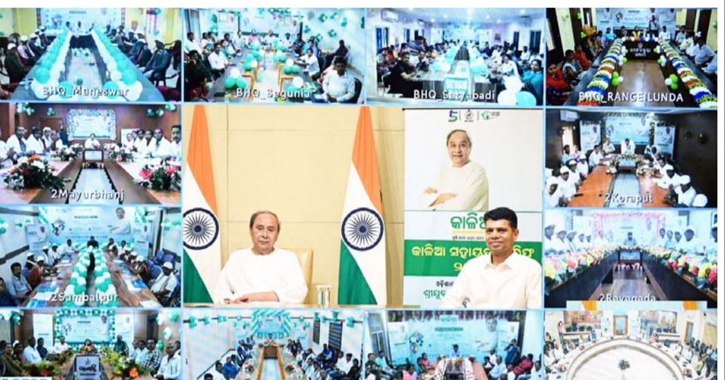
ଯୋଜନାର ସମୟ ଅବଧି ଆଉ ୩ ବର୍ଷ ଅର୍ଥାତ୍ ୨୦୨୬-୨୭ ପର୍ଯ୍ୟନ୍ତ ବୃଦ୍ଧି କରାଗଲା ବୋଲି ଘୋଷଣା କରିଥିଲେ ।