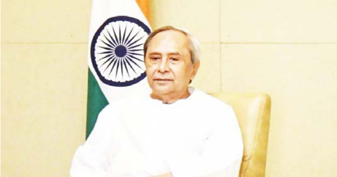
ପ୍ରକଟ ଓ ବିଭିନ୍ନ ଉନ୍ନୟନମୂଳକ କାର୍ଯ୍ୟର ଅଧ୍ୟକ୍ଷ କାର୍ଯ୍ୟକ୍ରମ ପ୍ରତିଆର ଅନେକ ଥର ପୁରୀ ସେବାୟତମାନଙ୍କୁ ସ-ଟି ତଥା ନବୀନ ଓଡ଼ିଶା ଗଠ୍ୟ କରିଛନ୍ତି । ଏହି ଅବସରରେ

ଭୁବନେଶ୍ୱର, ୧୨ମାର୍ଚ୍ଚ ନୂଆ ବ୍ୟବସ୍ଥା ମଙ୍ଗଳବାର ମୁଖ୍ୟମନ୍ତ୍ରୀ ନବୀନ ପଟ୍ଟନାୟକ ପୁରୀ ଶ୍ରୀକଗନ୍ଧାର୍ଯ୍ୟ ମନ୍ଦିର ସେବାୟତମାନଙ୍କ କଲ୍ୟାଣ ପାଇଁ ବିଭିନ୍ନ ଯୋଜନା ଘୋଷଣା କରିଛନ୍ତି । ଏଥିରେ ବିଭିନ୍ନ ଭଣ୍ଡା ପରିମାଣ ଓ ସ୍ୱାସ୍ଥ୍ୟ ବାମାନେ ବୁଦ୍ଧି କରାଯାଇଥିବା ବେଳେ ପରିବାରର ଛାତ୍ରଛାତ୍ରୀଙ୍କ ପ୍ରବେଶିକା ପରୀକ୍ଷା ପାଇଁ କୋଟି ବ୍ୟୟ ମଧ୍ୟ କରାଯାଇଛି । ଏହି ସବୁ କଲ୍ୟାଣ ଯୋଜନା ଶ୍ରୀମନ୍ଦିର ପ୍ରଶାସନ ପକ୍ଷରୁ କାର୍ଯ୍ୟକାରୀ କରାଯାଇଛି । ପୁରୀନାୟକ ଯେ ଶ୍ରୀମନ୍ଦିର ପରିଚ୍ଛଳା