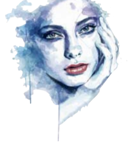
ଦଶରଥପୁର, ଯାଜପୁର, ୭୫୫୦୦୭, ଫୋନ-୭୩୭୭୩୧୮୭୮୯

ଶକ୍ତି ପାଇଁ ତୁମେ ଆଦ୍ୟମାତା ସାକି କରୁଣାକୁ ବିଧି ବଦ୍ଧ ସାରା ଦୁନିଆଁ ଖେଳାଅ ଏମିତି ଅଦୃଶ୍ୟ ଶକ୍ତି ହୋଇ ।