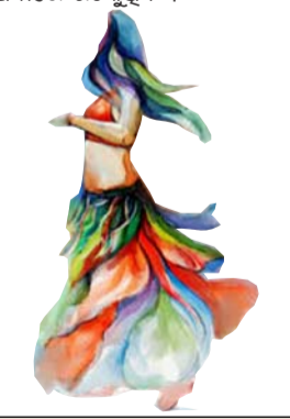
ଭିକାରିପଡ଼ା, ଶରଣକୁଳ, ନୟାଗଡ଼ । ଦୂରଭାଷ --- ୯୨୩୮୯୯୭୪୪୯

ଜୀବନଟା ଏକ ଜଉଘର ବିଏ ଫୋଡ଼ିଦେଲେ ଜଳିଯିବ ଜୀବନଟା ଗୋଟେ କ୍ଷଣିକ ନିଶ୍ୱାସ ରହିଗଲେ ଚଳିଯିବ ।