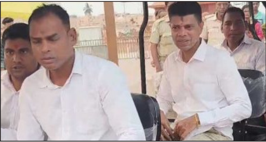
ପୁରୀ, ୫.୪: ନ୍ୟୁଜ୍‌ବ୍ୟୁରୋ ପୁରୀ ଯାଇ ମହାପ୍ରଭୁଙ୍କୁ ଦର୍ଶନ କଲେ ୫-ଟି ନବୀନ ଓଡ଼ିଶାର ଅଧ୍ୟକ୍ଷ କାର୍ତ୍ତିକ ପାଣ୍ଡିଆନ । ଭୋରକୁ ଶ୍ରୀମନ୍ଦିରରେ ପହଞ୍ଚି ଶ୍ରୀଜୀଉଙ୍କୁ ଦର୍ଶନ କରିଛନ୍ତି ପାଣ୍ଡିଆନ । ମହାପ୍ରଭୁଙ୍କୁ ଦର୍ଶନ କରିବା ପରେ ସେ ଭିତର ବେଢା ପରିକ୍ରମା କରିଥିଲେ । ଭରଣଦ୍ୱାର ଦେଇ ଶ୍ରୀମନ୍ଦିରକୁ ବାହାରିବା ପରେ ତାଙ୍କୁ ଜନସାଧାରଣମାନେ ଅଭିବାଦନ ଜଣାଇଥିଲେ । ପରେ ୫-ଟି ଅଧ୍ୟକ୍ଷ ଭୂବନେଶ୍ୱର ପ୍ରତ୍ୟାବର୍ତ୍ତନ କରିଥିବା ନେଇ ସୂଚନା ମିଳିଛି ।

ବରିଷ୍ଠ ନାଗରିକଙ୍କୁ ଘରୁ ପୋଲିଂ ଷ୍ଟେସନକୁ ଆଣି ଘରକୁ ପହଞ୍ଚାଇବା ପର୍ଯ୍ୟନ୍ତ ଗାଡ଼ିର ବ୍ୟବସ୍ଥା ହେବ ବୋଲି ସୂଚନା ଦିଆଯାଇଛି । କେତେକ ଭୋଟର ପୋଷାକ ବାଳାଚର ସୁବିଧା ନେଇ ପାରିବେ ଓ ତାହା ସୁନିଶ୍ଚିତ କରିବା ପାଇଁ କୁହାଯାଇଛି । ଆଚରଣ ବିଧି ଉଲ୍ଲଙ୍ଘନ ହେଲେ ନିର୍ବାଚନ ସମ୍ପର୍କରେ କାର୍ଯ୍ୟକଳାପ ୨୦୧୯ ଅପରେସନ୍ ହାତୀ ପାଇଁ ଥିବା ବେଳେ ଏଥର ମଧ୍ୟ ମାଓ କାର୍ଯ୍ୟକଳାପ ଉପରେ ତାହା ନଜର ରଖାଯିବ । ଯେମିତି କଳାଚରୀ ବ୍ୟବହାର ନହୁଏ ସେନେଇ ଧ୍ୟାନ ଦିଆଯିବ । ସ୍ତର ଓ ଅଧ୍ୟକ୍ଷ ନିର୍ବାଚନ ଉପରେ ଦେଖିବା ଦିଆଯାଇଛି । ୨୦୧୭ ୭୦% ରୂପରେ ଡେବ କାଷ୍ଟି କରାଯିବ ବୋଲି ସିଇଓ କହିଛନ୍ତି ।