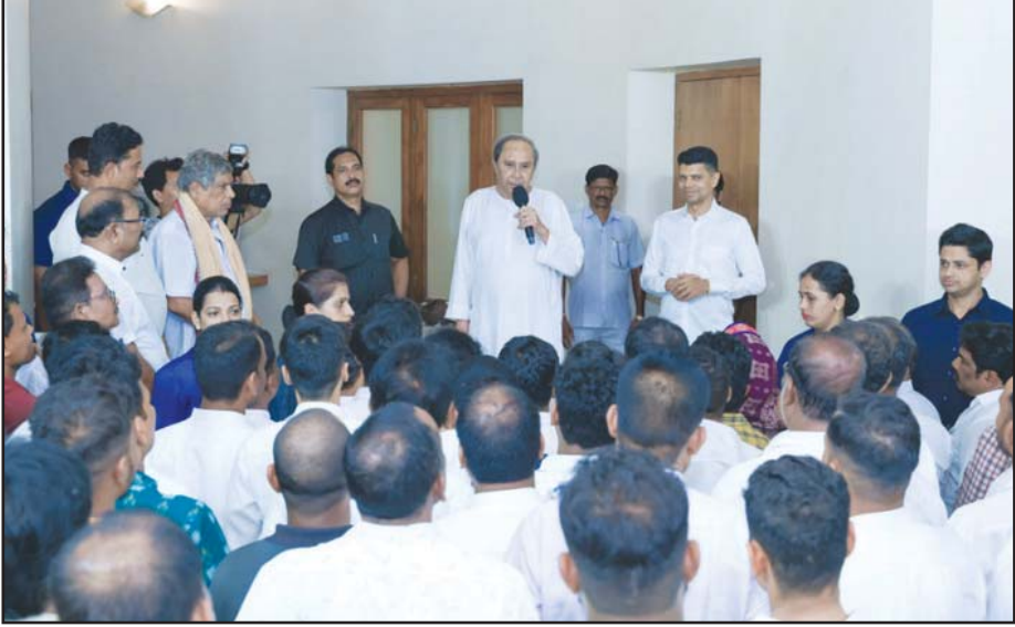
ଭୂବନେଶ୍ୱର : ନବୀନ ନିବାସରେ ବିଜୁ ଜନତା ଦଳର ସମର୍ଥକଙ୍କ ଭିଡ଼ ।