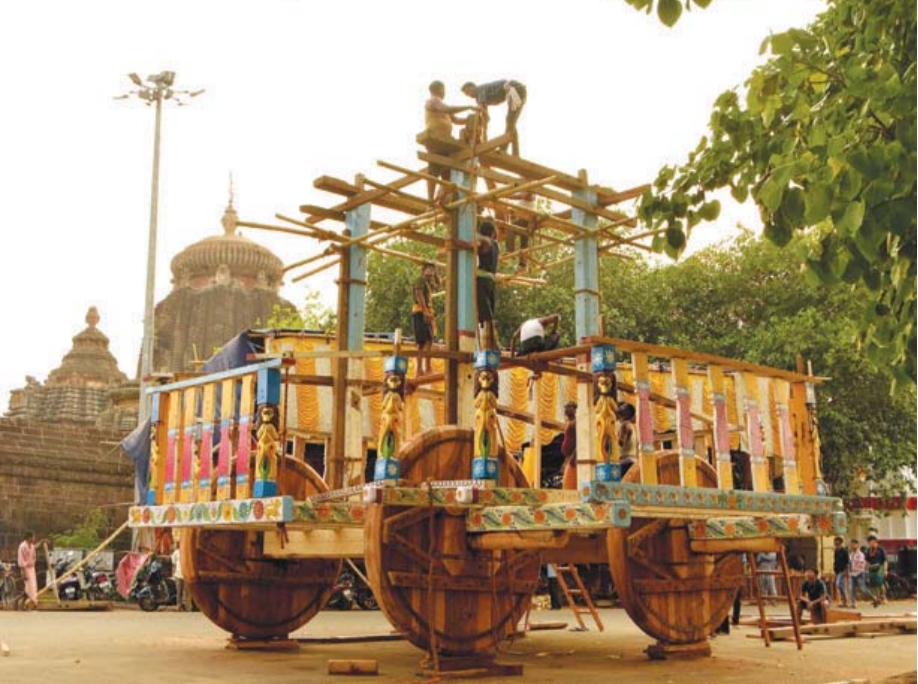
ଭୁବନେଶ୍ୱର : ପାଖେଇ ଆସୁଛି ପ୍ରଭୁ ଶ୍ରୀଲିଙ୍ଗରାଜଙ୍କ ରୁକୁଣା ରଥଯାତ୍ରା। ରଥ ନିର୍ମାଣରେ ଲାଗିପଡ଼ିଛନ୍ତି ମହାରଣା ସେବକମାନେ।