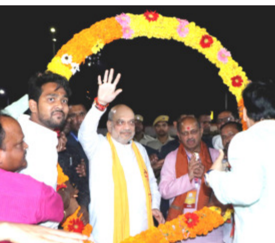
ଭୁବନେଶ୍ଵର, ୨୫/୦୪ ନ୍ୟୁକ କ୍ୟୁବୋ ଭୁବନେଶ୍ଵରରେ ପହଞ୍ଚିଲେ ଅମିତ ଶାହ । ସୋନପୁର ସଭା ସାରି

ଶ୍ରୀମନ୍ଦିର ପ୍ରଶାସନ ନିକଟରେ ମହଜୁଦ ରହିଛି । ତେବେ ତିନି ରଥ ନିର୍ମାଣ ପାଇଁ ପ୍ରତିବର୍ଷ ମୋଟ ୮୬୫ ଖଣ୍ଡ କାଠ ଦରକାର ହୋଇଥାଏ । ତେବେ ପର୍ଯ୍ୟାୟ କ୍ରମେ ପୁରୀରେ ରଥ କାଠ ଆସି ପହଞ୍ଚିବ । ଆସନ୍ତା ଅକ୍ଷୟ ତୃତୀୟା ଅବସରରେ ରଥ ନିର୍ମାଣ ଅନୁକୂଳ ହେବାର ପରମ୍ପରା ରହିଛି । ସେହିପରି ପରମ୍ପରା ଅନୁଯାୟୀ ଶ୍ରୀପଞ୍ଚମୀ ଅବସରରେ ଚଳିତ ୨୦୨୪ ରଥଯାତ୍ରା ପାଇଁ ରଥକାଠ ଅନୁକୂଳ ହୋଇଥିଲା । ତେବେ ଗତ ୧୮ ଏପ୍ରିଲରେ ତିନିରଥ ପାଇଁ ୧୪ ଖଣ୍ଡ କାଠ ଯୋଗେ ପହଞ୍ଚିଥିଲା । ସମୁଦାୟ ୨୬ଟି ଦଣ୍ଡର ଶ୍ରୀମନ୍ଦିର କାର୍ଯ୍ୟାଳୟରେ ପହଞ୍ଚିଥିଲା । ପୁରୀ ବାରପ୍ରଦାପପୁରରେ ଥିବା ଓଡ଼ିଶା ସମବାୟକ ନିଗମ ପକ୍ଷରୁ ପ୍ରାୟ ଏକ ମାସ ଧରି ୧୪ ଜଣ କାରିଗର ଏହି ରଥ ଦଣ୍ଡର ପ୍ରସ୍ତୁତ କରୁଥିଲେ । ରଥଗଣା ପାଇଁ ରଥ ଦଣ୍ଡର ଲମ୍ବ ୨୨୦ ଫୁଟ ହୋଇଥିବା ବେଳେ ଏହାର ଗୋଲେଇ ରହିଛି ୮ ଇଞ୍ଚ ।