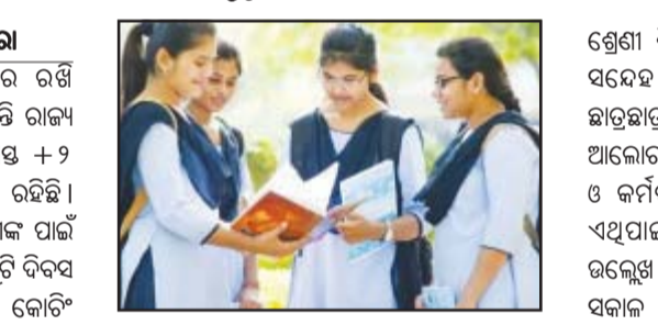
ଛୁଟି ସମୟରେ ଛାତ୍ରଛାତ୍ରୀମାନେ ଶିକ୍ଷା ସହ ଜଡ଼ିତ ହୋଇ ରହିବା ପାଇଁ ସେମାନଙ୍କୁ ହୋମୱର୍କ ପ୍ରଦାନ କରିବେ ଶିକ୍ଷକ। କୌଣସି ବିଷୟରେ ଦୃଢ଼ ଥିଲେ, ସେମାନେ ସେହି ବିଷୟରେ ଶିକ୍ଷକ ବା

ଭୁବନେଶ୍ୱର, ୨ ଅଧିକାଂଶ ପ୍ରତ୍ୟେକ ଶିକ୍ଷା ପ୍ରଦାନକାରୀ ସଂସ୍ଥାରେ ଉତ୍ତମ ଶିକ୍ଷା ଦେବା ଲାଗି ଉଚ୍ଚ ଶିକ୍ଷା ଦେବାକୁ ଉତ୍ସାହ ଦେବାକୁ ଉପାଦେଇଛନ୍ତି। ଏହି ଉପାଦେୟ ଉପାଦାନ ଉପରେ ଉତ୍ସାହ ଦେବାକୁ ଉପାଦେଇଛନ୍ତି।