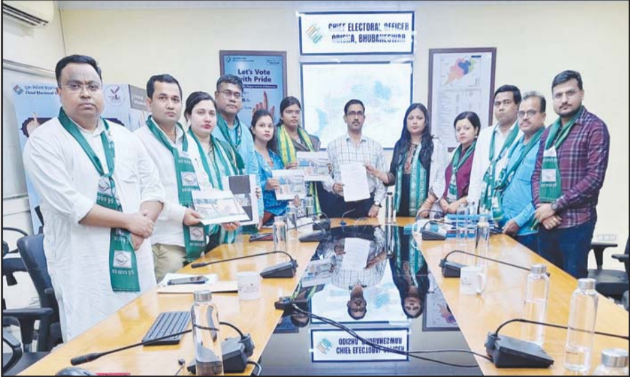
ଭୁବନେଶ୍ୱର: ସାଲପୁରରେ ବିଜେପି ମଦ ଓ ଟଙ୍କା ବାଣ୍ଟିବା ଅଭିଯୋଗରେ ସିଦ୍ଧାଂଶୁ ନିକଟରେ ଫେରାଦ ହୋଇ ବିଜେଡି

ଭୁବନେଶ୍ୱର ୨୭ ଅପ୍ରେଲ ଶନିବାର, ୨୦୨୪ RNI Regd. No. : 52640/94 Postal Regd. No. : BN/60/22-24