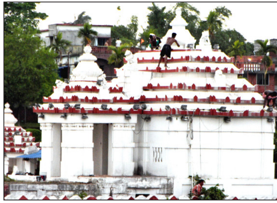
ଭୁବନେଶ୍ୱର : ପ୍ରଭୁ ଶ୍ରୀଜୀଉଙ୍କ ଚନ୍ଦନ ଯାତ୍ରା ପାଇଁ ମନ୍ଦିର କମିଟି ପକ୍ଷରୁ ବିନ୍ଦୁ ସାଗର ପରିସରରେ ଥିବା ଜଗତିରେ ରଙ୍ଗ ଦିଆଯାଇଛି ।