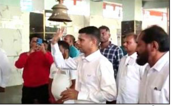
ଉଦ୍‌ବୋଧନ ଦେଇଥିଲେ ଆଉ ଲୋକଙ୍କଠାରୁ ସମର୍ଥନା ବି ପାଇଥିଲେ ।

ଜୟପୁର, ୨/୫ ବ୍ୟୁତ ବ୍ୟବସ୍ଥା ଜୟପୁରରେ ବରିଷ୍ଠ ବିଜେଡି ନେତା କାର୍ତ୍ତିକ ପାଣ୍ଡିଆନ । ସେ ବିଶାଳ ରୋଡ ଶୋ'ରେ ଦକ୍ଷାୟ ପ୍ରାର୍ଥନା ପାଇଁ ଭୋଟ ମାଗିଥିଲେ । ଗୁରୁବାର ସକାଳୁ ଜୟପୁରର ପ୍ରସିଦ୍ଧ ଜଗତଜନନୀ ମନ୍ଦିର ଯାଇ ମାଆଙ୍କୁ ଦର୍ଶନ କରିଛନ୍ତି । ସେଠାରେ ପୂଜାର୍ଚ୍ଚନା କରି ପୂଜକ ଓ ଶ୍ରଦ୍ଧାଳୁଙ୍କ ସହ ଆଲୋଚନା କରିଛନ୍ତି । ବୁଧବାର ସନ୍ଧ୍ୟାରେ କାର୍ତ୍ତିକ ପାଣ୍ଡିଆନ ଜୟପୁର ସହରରେ ଦକ୍ଷାୟ ପ୍ରାର୍ଥନା ପ୍ରଚାର ମଇଦାନକୁ ଉନ୍ମୁକ୍ତ ହୋଇଥିଲେ । ବିଶାଳ ରୋଡ ଶୋ'ରେ ଜନତାଙ୍କୁ