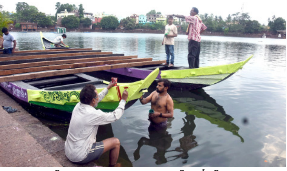
ଭୁବନେଶ୍ୱର : ଶ୍ରୀଲିଙ୍ଗରାଜ ମହାପ୍ରଭୁଙ୍କ ଚନ୍ଦନ ଯାତ୍ରାର ଅବ୍ୟବହୃତ ପୂର୍ବରୁ ବିଦ୍ୟୁତ୍‌ସାଗରରେ ଜଳକ୍ରୀଡ଼ା ପାଇଁ ତଜା 'ପାର୍ବତୀ'କୁ ସଜାଇବାରେ ବ୍ୟସ୍ତ ରଜା କାରିଗର ।

ଭୁବନେଶ୍ୱର, ନ୍ୟୁକ ବ୍ୟୁରୋ ବର୍ତ୍ତମାନ ସୁଦ୍ଧା ରାଜ୍ୟରେ ଅଂଶୁଦାତରେ ୩ ଜଣଙ୍କ ମୃତ୍ୟୁ ହୋଇଛି ବୋଲି ଜନସ୍ୱାସ୍ଥ୍ୟ ନିର୍ଦ୍ଦେଶକ ତାଲୁକ ବିଜୟ ମହାପାତ୍ର ସୂଚନା ଦେଇଛନ୍ତି । ସେ କହିଛନ୍ତି ଯେ ବେକାମଲ, ବାଲେଶ୍ୱର ଓ ମୟୂରଭଞ୍ଜରେ ଜଣେ ଲେଖାଏଁ ମୃତ୍ୟୁବରଣ କରିଛନ୍ତି । ସେ କହିଛନ୍ତି ଯେ ଅଂଶୁଦାତରେ ୨୦ ଜଣଙ୍କର ମୃତ୍ୟୁ ହୋଇଥିବା ଅଭିଯୋଗ ହୋଇଛି । ଏଥି ମଧ୍ୟରୁ ୩ ଜଣଙ୍କ ମୃତ୍ୟୁ ସ୍ୱସ୍ଥ ହୋଇଥିବା ବେଳେ ୧୭ ଜଣଙ୍କ ମୃତ୍ୟୁ ଅଭିଯୋଗ ବେଳେ ତଦନ୍ତ ଚାଲିଛି । ସେ କହିଛନ୍ତି ଯେ ରାଜ୍ୟରେ ମୋଟ ୭୮୭ ଅଂଶୁଦାତ ମାମଲା ଆସିଛି ।