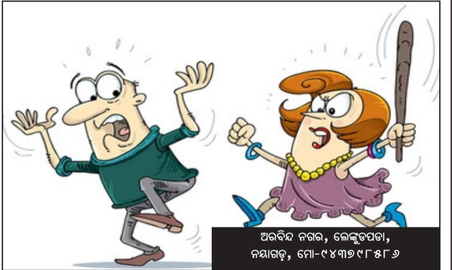
ଅରବିନ୍ଦ ନଗର, ଲୋକ୍ଷତପଡ଼ା, ନୟାଗଡ଼, ମୋ-୯୪୩୭୭୮୫୮୭

- ମା' ଆପଣ ଏହି ଅମୃତଭଣ୍ଡାକୁ କେତେ ଚକାରେ ଦେବେ ? ସେ କହିଲା, 'ପୁଅ ! ତୁମେ ଯାହା ଦେଉଛ ଦିଅ । ଭଗବାନ ତୁମକୁ ଆଶୀର୍ବାଦ କରିବେ । ମୁଁ କ'ଣ କରିପାରିବି ପୁଅ, ମୁଁ ବହୁତ ଗରିବ ନୋକ । ଘରେ ଦୁଇ ଚାରିଟି ଅମୃତଭଣ୍ଡା ଗଛ ଅଛି । ସେଗୁଡ଼ିକ ହେଉଛନ୍ତି ମୋ ଜୀବନଧାରଣର ସାହାଯ୍ୟ । କିଛି ଦିନ ତଳେ ପାଚିଲା ଅମୃତଭଣ୍ଡା ବିକି କରୁଥିଲି । ସେଥିରେ ଦୁଇ ଖଲି ଚୁଲୁ କରୁଥିଲି । କିନ୍ତୁ ଏବେ ପାଚିଲା ଅମୃତଭଣ୍ଡା ସରିଲା । କଥା ଭଣ୍ଡା ଲୋକ ନେବାକୁ ସେତେ ଆଗ୍ରହୀ ନୁହଁନ୍ତି । ଘରେ ମୋର ଛୋଟ ନାହୁଣାଟିଏ । ଘରେ ଦୁଇ ଦିନ ହେଲା ଭୋକିଲା । ଦୁଇ ବର୍ଷ ତଳେ ପୁଅ ବୋହୂ ଜଗତରେ ଚାଲିଗଲେ । ସେବେଠାରୁ ମୋର ସାହାଯ୍ୟ ହୋଇଛି ଏହି ଅମୃତଭଣ୍ଡା ଗଛ । ତାକରି ଦ୍ୱାରା ଜୀବନ ବିତାଉଛି । ମୁଁ ଶହେ ଚକାରେ ତାଙ୍କୁ ସମସ୍ତ ଅମୃତଭଣ୍ଡା କିଣିଲି । ସ୍ୱାମୀଙ୍କ ତର ତର କଥାରେ ପତ୍ନୀଙ୍କ ଆଖିରୁ ଅଜାଣତରେ ଲୋତକ ଝରି କପୋଳ ଦେଇ ବୋହି ଆସିଲା । ପତ୍ନୀ ଲୋତକାତୁ ଠେରେ କହିଲେ, 'ଓହ ! ଗରିବ ଅସହାୟ ବୁଢ଼ାଟିକୁ ଶହେ ଟଙ୍କା ବନ୍ଦୁ ଚାହୁଁଛନ୍ତି ଦେଖାଆନ୍ତୁ... ସେମାନଙ୍କର ଆଶୀର୍ବାଦ ଆମକୁ କେତେ ଚକା ଦେବ... । ଏହା ଶୁଣି ସ୍ୱାମୀ ନିର୍ବାକ ହୋଇ ପତ୍ନୀଙ୍କୁ ଚାହିଁ ରହିଥିଲେ...