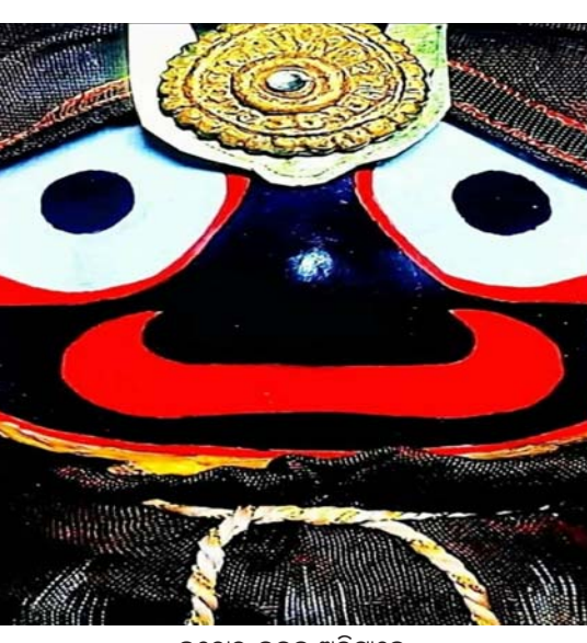
କଠୋର ବଚନ ଅଭିନୀତେ କିନ୍ତୁ ମୁଁ ସେ ମୃତୁ କେମିତି ଜାଣିବି କ'ଣ ଥିଲା ତ ତୁମ୍ଭ ମନେ ।।୪।।

ଗୀତରେ ଅଭିଷେକ କାର୍ଯ୍ୟମାନ ହେବା ପୂର୍ବରୁ କୌଶ୍ଟିନୟ ଓ ଭାବା ମହାରାଣୀ ସୋମା କପରି ଜଗନ୍ନାଥଙ୍କୁ ପୂଜା କରିବା ପୂର୍ବକ ତାଙ୍କର ଜଣାଣ ଗାୟି ଅଛନ୍ତି, ତାହା ପ୍ରତିପାଦିତ ହୋଇଅଛି । କୌଶ୍ଟିନୟଙ୍କ ମୁଖରେ ସ୍ଥାନିତ ହୋଇଥିବା ଏ ଜଣାଣଟି ଯଥାସାଧ୍ୟ ଭାବପୂର୍ଣ୍ଣ କରିବାକୁ ମୁଁ ପ୍ରୟାସ କରିଛି । ଏହାର ତାତ୍ପର୍ଯ୍ୟ ଏହି ପ୍ରତ୍ୟେକ ପଦ ଗୁଡ଼ିକ ଯଥା ଅଂଶ ବିଶିଷ୍ଟ ଅଟେ ଓ ସମସ୍ତ ଅଂଶର ପ୍ରଥମ ଅକ୍ଷର 'କ' ଅଟେ । ଏହି ଗୀତ ପଠନ କରନ୍ତୁ ।