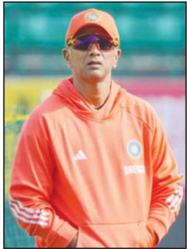
କିଛି ଜାତୀୟ ଗଣମାଧ୍ୟମରେ ପ୍ରକାଶିତ ରିପୋର୍ଟ ଅନୁଯାୟୀ, କେବଳ କୋଲକାତା ନାଇଟ୍ ରାଇଡର୍ସ ନୁହେଁ, ଆଇପିଏଲ୍ ଖେଳୁଥିବା ଆହୁରି ଅନେକ ଟିମ୍ ୨୦୨୫ ସିକିନ ପୂର୍ବରୁ ରାହୁଲ

ନୂଆଦିଲ୍ଲୀ ଗୌତମ ଗମ୍ଭୀର ଟିମ୍ ଇଣ୍ଡିଆର ମୁଖ୍ୟ କୋଚ୍ ହୋଇଛନ୍ତି । ଏନେଇ ବିସିସିଆର ସମ୍ପାଦକ ଜୟ ଶାହ ମଙ୍ଗଳବାର ଘୋଷଣା କରିଛନ୍ତି । ସେ ଟିମ୍ ଇଣ୍ଡିଆର ମୁଖ୍ୟ କୋଚ୍ ଦାୟିତ୍ୱ ନେବାପରେ ଆଇପିଏଲ୍ ଟିମ୍ କୋଲକାତା ନାଇଟ୍ ରାଇଡର୍ସ୍କୁ ଝେଳା ଲାଗିଛି । କାରଣ ଗମ୍ଭୀରଙ୍କ ମାର୍ଗଦର୍ଶନରେ ଦଳ ଚଳିତ ବର୍ଷ ଆଇପିଏଲ୍ ଚ୍ୟମ୍ପିୟନ ହୋଇଥିଲା । ସେହିପରି ତାଙ୍କୁ ଆସନ୍ତା ୧୦ ବର୍ଷ ପାଇଁ ଟିମ୍ ମେଣ୍ଟର ବା ମାର୍ଗଦର୍ଶକ କରି ରଖିବା ପାଇଁ ଘୋଷଣା କରିଥିଲେ ଏହାର ସହ-ମାଲିକ ଶାହରୁଖ ଖାନ । ତେବେ ଗମ୍ଭୀରଙ୍କ ସ୍ଥାନ ପୂରଣ କରିବାକୁ ରାହୁଲ ଦ୍ରାବିଡ଼ଙ୍କ ଉପରେ ନଜର ପକାଇଛି କୋଲକାତା ନାଇଟ୍ ରାଇଡର୍ସ । ସୁଦର୍ଶା ଅନୁଯାୟୀ, ଗମ୍ଭୀରଙ୍କ ପରେ ଦଳ ଆଉ କାହାକୁ ମେଣ୍ଟର କରିବ, ସେ ନେଇ ଏକ ତାଲିକା ପ୍ରସ୍ତୁତ କରିଛି । ଆଉ ସେଥିରେ ରାହୁଲ ଦ୍ରାବିଡ଼ଙ୍କ ନାଁ ମଧ୍ୟ ରହିଛି । କିନ୍ତୁ ଦଳ ଏଯାବତ୍ ରାହୁଲଙ୍କ ସହିତ ଏ ନେଇ କଥାବାର୍ତ୍ତା କରି ନାହିଁ ।