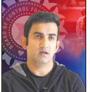
ନୂଆର ପୂର୍ବତନ ଭାରତୀୟ ଓପେନିଂ ବ୍ୟାଟ୍ସମ୍ୟାନ ଗୌତମ ଗମ୍ଭୀର ଟିମ୍ ଇଣ୍ଡିଆର ନୂଆ ମୁଖ୍ୟ କୋଚ୍ ନିଯୁକ୍ତ ହୋଇଛନ୍ତି । ରାହୁଲ ଦ୍ରାବିଡ଼ଙ୍କ କାର୍ଯ୍ୟକାଳ ଶେଷ ହେବା ପରେ ତାଙ୍କ ସ୍ଥାନରେ ଗୌତମଙ୍କୁ ନିଯୁକ୍ତ କରାଯାଇଛି । ଗୌତମ ଟିମ୍ ଇଣ୍ଡିଆର ମୁଖ୍ୟ କୋଚ୍ ହେବା ନେଇ ଗତ କିଛି ମାସ ହେଲା ଚର୍ଚ୍ଚା ଖିଲିଥିଲା । ଏ ନେଇ

ବିସିସିଆଇ ଓ ଗମ୍ଭୀରଙ୍କ ମଧ୍ୟରେ ଅନେକ ଥର କଥାବାର୍ତ୍ତା ହୋଇଥିଲା । ସେଥିରୁ କଟକଣା କରାଯାଇଥିଲା ଯେ, ଗୌତମ ଗମ୍ଭୀର ଟିମ୍ ଇଣ୍ଡିଆର ମୁଖ୍ୟ କୋଚ୍ ହେବା ନିଷ୍ପତ୍ତି । ଗୌତମ ଗମ୍ଭୀରଙ୍କୁ ଭାରତୀୟ କ୍ରିକେଟ ଦଳର ନୂଆ ମୁଖ୍ୟ ପ୍ରଶିକ୍ଷକ ଭାବେ ସ୍ୱାଗତ କରି ଫୁଲ ଆନନ୍ଦିତ ବୋଲି କହିଛନ୍ତି ଜୟ ଶାହ । ସେ କହିଛନ୍ତି ଯେ, ଆଜିର ସମୟରେ କ୍ରିକେଟ୍ ବହୁତ ଦ୍ରୁତ ଗତିରେ ବିକଶିତ ହୋଇଛି ଏବଂ ଗୌତମ ଏହି ପରିବର୍ତ୍ତିତ ଦୃଶ୍ୟକୁ ଅତି ନିକଟରୁ ଦେଖିଛନ୍ତି । ନିଜ କ୍ୟାରିୟରରେ ବିଭିନ୍ନ ଭୂମିକାରେ ଭଲ ପ୍ରଦର୍ଶନ କରିଥିବା ଗୌତମ ଭାରତୀୟ କ୍ରିକେଟକୁ ଆଗକୁ ନେବା ପାଇଁ ଆଦର୍ଶ ବ୍ୟକ୍ତି ବୋଲି ମୋର ବିଶ୍ୱାସ ରହିଛି । ଭାରତୀୟ ଦଳ ପାଇଁ ତାଙ୍କର ସ୍ୱଳ୍ପ ଦୃଷ୍ଟିକୋଣ ଓ ତାଙ୍କର ବିଶାଳ ଅଭିଜ୍ଞତା ତାଙ୍କୁ ଏହି ଗୁରୁତ୍ୱପୂର୍ଣ୍ଣ ଏବଂ ସବୁଠାରୁ ଉଚ୍ଚତମ ପୂର୍ଣ୍ଣ ପ୍ରଶିକ୍ଷକ ଭୂମିକା ଗ୍ରହଣ କରିବାକୁ ସମର୍ଥ ପ୍ରସ୍ତୁତ କରିଛି । ସେ ଏହି ନୂଆ ଯାତ୍ରା ଆରମ୍ଭ କରୁଥିବାବେଳେ ବିସିସିଆଇ ତାଙ୍କୁ ପୂର୍ଣ୍ଣ ସମର୍ଥନ କରୁଛି । ଟିମ୍ ଇଣ୍ଡିଆ ମୁଖ୍ୟ କୋଚ୍ ନିଯୁକ୍ତ ହେବା ପରେ ଗୌତମ ଏକସେକ୍ସନ୍ସିଭି ଯେ, ଏହି ପଦବୀ ଗ୍ରହଣ କରିବା ତାଙ୍କ ପାଇଁ ବେଶ୍ ସମ୍ମାନର ବିଷୟ ।