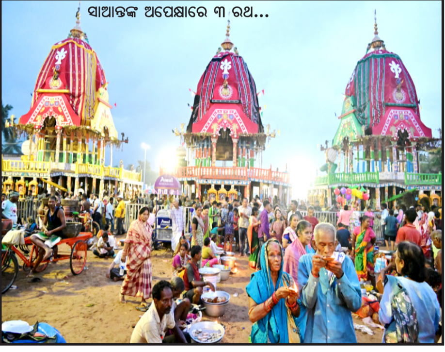
ପୁରୀ : ମାଉସୀ ମା' ମନ୍ଦିରରେ ଭକ୍ତିମୟ ପରିବେଶରେ କମ୍ପୁଛି ଶରଧାବାଳି...

କାଠମାଣ୍ଡୁ, ୧୪/୭ ଶୁକ୍ରବାର ଭୋରରେ ନଦୀକୁ ଖସିପଡି ଦୁର୍ଭିକ୍ଷଗ୍ରସ୍ତ ହୋଇଥିବା ଦୁଇଟି ବସରେ ଥିବା ୬୫ ଯାତ୍ରୀଙ୍କ ତୁଳସୀରେ ଚାଲି ଥିବା ଅଭିଯାନରେ ଏବେ ଦୁଇ କେବଳ ୫ଟି ମୃତଦେହ ଜବତ ହୋଇଛି । ୧୫୦ କିଲୋମିଟର ପରିସର ଯାଏ ତଳାସା ଅଭିଯାନ ପରେ ବି ରବିବାର ସକାଳ ସୁଦ୍ଧା ସେତେଟା ସଫଳତା ମିଳିନି । ଏପରିକି ଦୁର୍ଭିକ୍ଷଗାର ଶିକାର ହୋଇଥିବା ଦୁଇଟି ବସର ଏବେ ସୁଦ୍ଧା କୌଣସି ପରା ମିଳିନି । ଶନିବାର ତିନୋଟି ମୃତଦେହ ଜବତ ହୋଇଥିବା ବେଳେ ରବିବାର ସକାଳେ ଦୁଇଟି ମୃତଦେହ ଉଦ୍ଧାର ହୋଇଛି । ପୂର୍ବ ନଭଲପରାସା ଜିଲ୍ଲାର ଗୋଲାଘାଟ ନିକଟରୁ ଏହି ମୃତଦେହ ଜବତ ହୋଇଛି ।