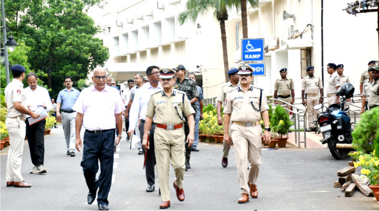
ଭୁବନେଶ୍ୱର : ବିଧାନସଭାର ବଜେଟ୍ ଅଧିବେଶନ ଆରମ୍ଭ ହେବାର ଅବ୍ୟବହୃତ ପୂର୍ବରୁ ସୁରକ୍ଷା ବ୍ୟବସ୍ଥା ଯାଞ୍ଚ କରୁଛନ୍ତି ଡିଜିପି ଅରୁଣ ଷଡ଼ଙ୍ଗୀଙ୍କ ସମେତ ବରିଷ୍ଠ ପୋଲିସ୍ ଅଧିକାରୀମାନେ ।

RNI Regd. No. : 52640/94 Postal Regd. No. : BN/60/22-24