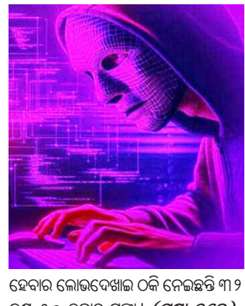
ହେବାର ଲୋଭଦେଖାଇ ଠକି ନେଇଛନ୍ତି ୩୨ ଲକ୍ଷ ୫୦ ହଜାର ଟଙ୍କା । (ପୃଷ୍ଠା ୭ରେ)

ରାଉରକେଲା, ୨୫:୭ ନ୍ୟୁଜ୍ ବ୍ୟୁରୋ ଦିନକୁ ଦିନ ଠକିବାର ତରଳା ବଦଳାଉଛନ୍ତି ସାଇବର ଠକ ଗ୍ୟାଙ୍ଗ । ରାତାରାତି ଲକ୍ଷପତି ଟଙ୍କା ଠକିବାକୁ ସୁଦ୍ଧା ଦେଖାଇ ଠକି ନେଉଛନ୍ତି ଲକ୍ଷ ଲକ୍ଷ ଟଙ୍କା । ଯାହାର ଟେରପାଉନି ସାଇବର ପ୍ରଲିପ୍ତ । ରାଉରକେଲା ସହରରେ ମାସକୁ ଜଣେ ଦୁଇଜଣ ସାଇବର ଠକାପିରେ ଶିକାର ହେଉଛନ୍ତି । ଏବେ ପୁଣି ସାଇବରଠକ ଗ୍ୟାଙ୍ଗ ପଞ୍ଚାରେ ପଡିଛନ୍ତି ରାଉରକେଲା ସାଇବର ଠକିଲା ଛକର ଜଣେ ଯୁବ ବ୍ୟବସାୟୀ । ଅନିଚ୍ଛାକ୍ତ ବ୍ୟବସାୟ ନାଁରେ ଠକିପିଡି