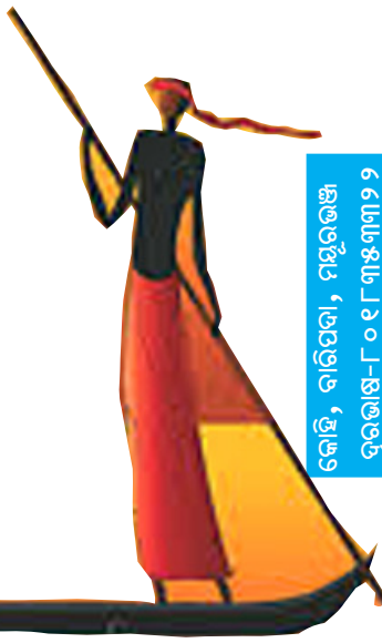
କେହି, ବାଉଁଶ, ମାଉଁଶ ତୁମେ ଖୁସି ମାଉଁଶ

ହୃଦୟେ ଆନନ୍ଦ ଭରି ଯାଏ ଆଶାତୀତ, ସେ ମାଟିର ବାମ୍ଫା ଛୁଇଁଯାଏ ପ୍ରତି ଆତ୍ମାକୁ ମହାଶୂନ୍ୟତାରୁ ପୁଣ୍ୟତା ଆଣି ଦିଅ ଗତ ମାଟିର ସ୍ୱର୍ଗରେ ଉଜ୍ଜ୍ୱଳ ଭବିଷ୍ୟତ । ବର୍ଷା ! ଚାଷୀକୁ ଦିଅ ଅସୀମ ଶକ୍ତି ସାହସ କର୍ଷଣେ କୃଷି କରେ ସେ ଯୈର୍ଯ୍ୟ ଧରି ସାରା ଜଗତକୁ ଯୋଗାଏ ଆହାର, ବିରହୀ ବିଧିର ପ୍ରାଣର ପାୟୁଷ ହୋଇ ଦିଅ ତୁମେ ବାସ୍ତବ ଭଲ ପାଇବାର ମନ୍ତ୍ର ପ୍ରେମମୟ ହୁଏ ସୁନାର ଘର ସଂସାର । ପ୍ରତିଟି ଜୀବନର ଜୀବନ ହୋଇ ତୁମେ ସ୍ୱପ୍ନା ତୃଷ୍ଣା ନିବାରଣରେ ହୁଅ ମହାପ୍ରସାଦ ସୃଷ୍ଟିର ଶିରୀ ତୁମେ କଳାଶା କାରିଣୀ, ବନ ବନାଦୀ ନଦୀ ଝରଣା ମହାସାଗର ତୁମ ପ୍ରକୃତ ପ୍ରେମର ସାହିତ୍ୟ ପ୍ରମାଣ ତୁମ ବଦାନ୍ୟତାରେ ପ୍ରକୃତି ସାଜେ ରାଣୀ ।