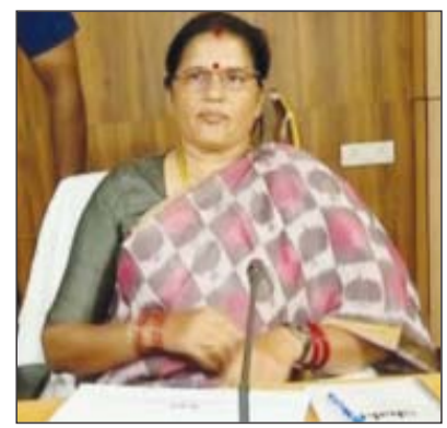
ଉପମୁଖ୍ୟମନ୍ତ୍ରୀ ପ୍ରଭାତୀ ପରିଡ଼ା ସ୍ୱୟଂ ସହାୟକ ଗୋଷ୍ଠୀ ମା'ମାନଙ୍କ ଦ୍ୱାରା କୁଟୀର ଶିଳ୍ପକୁ ଦୁରାମ୍ଭିତ କରିବାକୁ ନିର୍ଦ୍ଦେଶ ଦିଆଯାଇଥିଲା ।

ଭୁବନେଶ୍ୱର, ୦୨।୦୮.ଝୁଙ୍କଦ୍ୱାରା ଭୁବନେଶ୍ୱରସ୍ଥିତ ମିଶନ ଶକ୍ତି ଭବନରେ ଉପମୁଖ୍ୟମନ୍ତ୍ରୀ ପ୍ରଭାତୀ ପରିଡ଼ା ବିଭାଗର ବିଭିନ୍ନ ଯୋଜନା ଏବଂ କାର୍ଯ୍ୟକାରୀତାକୁ ପରୀକ୍ଷା କରିଥିଲେ । ଏହି ବୈଠକରେ ବିଭାଗର ଉପମୁଖ୍ୟମନ୍ତ୍ରୀ ସ୍ୱୟଂ ସହାୟକ ଗୋଷ୍ଠୀ ମା'ମାନଙ୍କ ଦ୍ୱାରା କୁଟୀର ଶିଳ୍ପକୁ ଦୁରାମ୍ଭିତ କରିବାକୁ ନିର୍ଦ୍ଦେଶ ଦିଆଯାଇଥିଲା ।