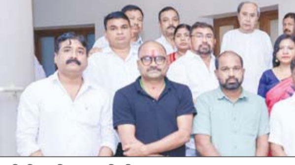
ମୟୂରଭଞ୍ଜ ବିଜୁ ଜନତା ଦଳର ନେତୃବୃନ୍ଦଙ୍କୁ ବିଜେଡି ସୁପ୍ରିମୋଙ୍କ ପରାମର୍ଶ ଦିଆଯାଇଛି ।

ଭୁବନେଶ୍ୱର, ୦୨।୦୮. ଝୁଙ୍କଦ୍ୱାରା ମୟୂରଭଞ୍ଜ ବିଜୁ ଜନତା ଦଳର ନେତୃବୃନ୍ଦଙ୍କୁ ବିଜେଡି ସୁପ୍ରିମୋଙ୍କ ପରାମର୍ଶ ଦିଆଯାଇଛି ।