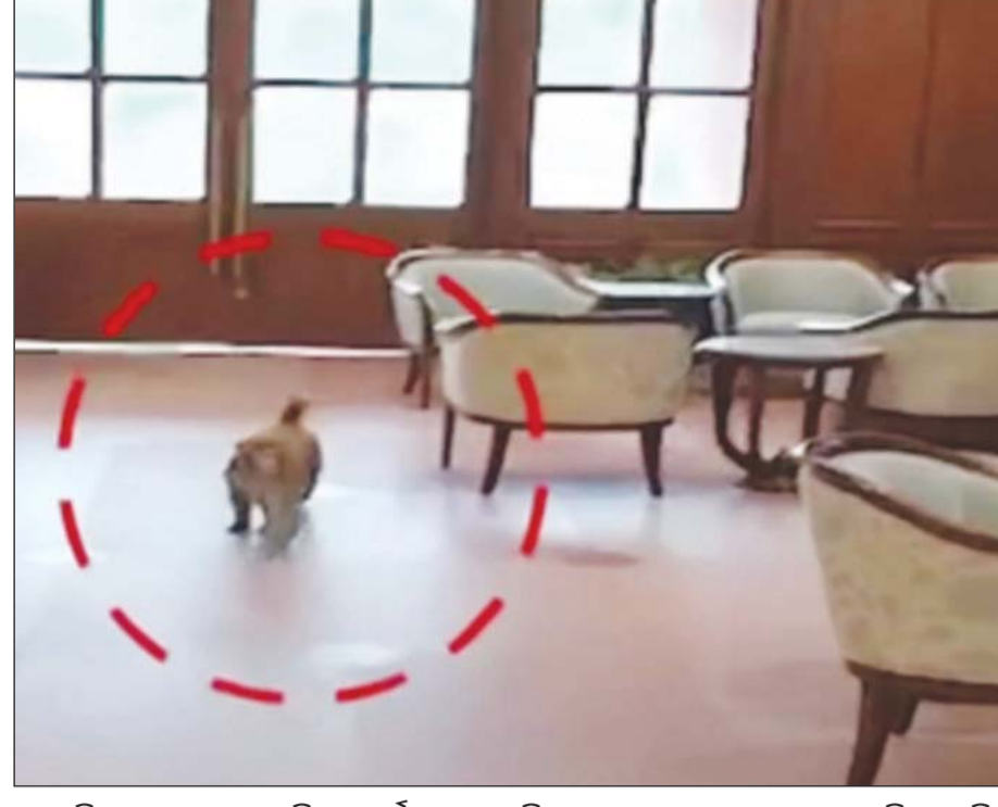
ନୂଆଦିଲ୍ଲୀ : ଶୁକ୍ରବାର ଦିନ ପାର୍ଲିାମେଣ୍ଟ ଲବିରେ ଏକ ମାଙ୍କଡ଼ ପ୍ରବେଶ କରି ଦୁଇଇି ।

ଗୋଷ୍ଠୀମାନଙ୍କୁ ପ୍ରଦତ୍ତ ରଶମ ପଠିକ ବିନିଯୋଗକୁ ତଦାରଖ କରିବା ପାଇଁ ମନ୍ତ୍ରୀ ନିର୍ଦ୍ଦେଶ ଦେଇଛନ୍ତି । ଆର୍ଥିକ ଅଭିଭବନା, ଦକ୍ଷତା ବିକାଶ ଏବଂ ବଜାରସଂଯୋଗ ପ୍ରଦାନ ଆଦି କାର୍ଯ୍ୟକ୍ରମ କରାଯିବ । କୁଟୀର ଶିଳ୍ପକୁ ଦୁରାମ୍ଭିତ କରିବା ପାଇଁ ପ୍ରତ୍ୟେକ ମା'ମାନଙ୍କୁ ନିର୍ଦ୍ଦେଶ ଦିଆଯାଇଛି ।