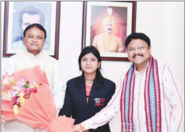
ମୁଖ୍ୟମନ୍ତ୍ରୀଙ୍କୁ ଭେଟିବା ପାଇଁ ଆଗାମୀ ଦିନକାର ଆରମ୍ଭ ହେଉଛି । ମୁଖ୍ୟମନ୍ତ୍ରୀଙ୍କୁ ଭେଟିବା ପାଇଁ ଆଗାମୀ ଦିନକାର ଆରମ୍ଭ ହେଉଛି ।

ଭୁବନେଶ୍ୱର, ୦୨।୦୮. ଝୁଙ୍କଦ୍ୱାରା ଅନ୍ତର୍ଜାତୀୟ ଖ୍ୟାତି ସମ୍ପନ୍ନ ପର୍ବତାରୋହୀ ବିଭାଗୀଣୀ ପ୍ରଭାତୀ ପରିଡ଼ାଙ୍କୁ ଭେଟିବା ପାଇଁ ସମ୍ଭାଷଣ ଶୁଣାଣି କଲେ । ମୁଖ୍ୟମନ୍ତ୍ରୀଙ୍କୁ ଭେଟିବା ପାଇଁ ଆଗାମୀ ଦିନକାର ଆରମ୍ଭ ହେଉଛି ।