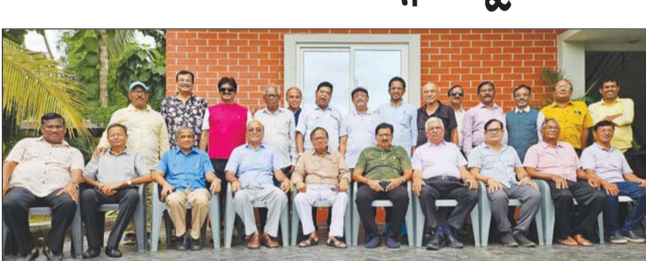
ଓଡ଼ିଆ ପ୍ରାଣୀଲୋକୀ ଲୋକମାନଙ୍କୁ ଜୀବନକୁ ଜୀଇଁବା ପାଇଁ ସମଭାବାପନ୍ନ ବନ୍ଧୁ ମିଳନର ପ୍ରାସଙ୍ଗିକତା ଉପରେ ଆଲୋଚନା କରାଯାଇଛି ।

ଭୁବନେଶ୍ୱର, ୦୨।୦୮. ଝୁଙ୍କଦ୍ୱାରା ଓଡ଼ିଆ ପ୍ରାଣୀଲୋକୀ ଲୋକମାନଙ୍କୁ ଜୀବନକୁ ଜୀଇଁବା ପାଇଁ ସମଭାବାପନ୍ନ ବନ୍ଧୁ ମିଳନର ପ୍ରାସଙ୍ଗିକତା ଉପରେ ଆଲୋଚନା କରାଯାଇଛି ।