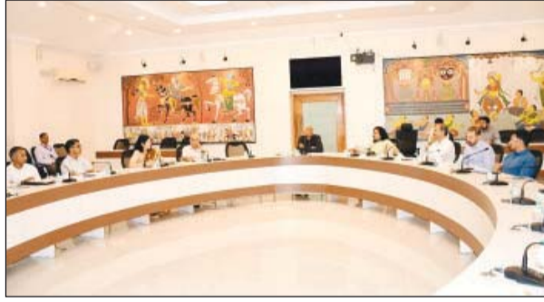
ଅନୁଧ୍ୟାନ କରିବା ପାଇଁ ଅନୁଧ୍ୟାନ କରାଯାଉଛି ।

ଭୁବନେଶ୍ୱର, ୦୨।୦୮. ଝୁଙ୍କଦ୍ୱାରା ଭିକ୍ଷୁମାନଙ୍କୁ ଉଦ୍ଧାର କରିବା ପାଇଁ ଅନୁଧ୍ୟାନ କରାଯାଉଛି ।