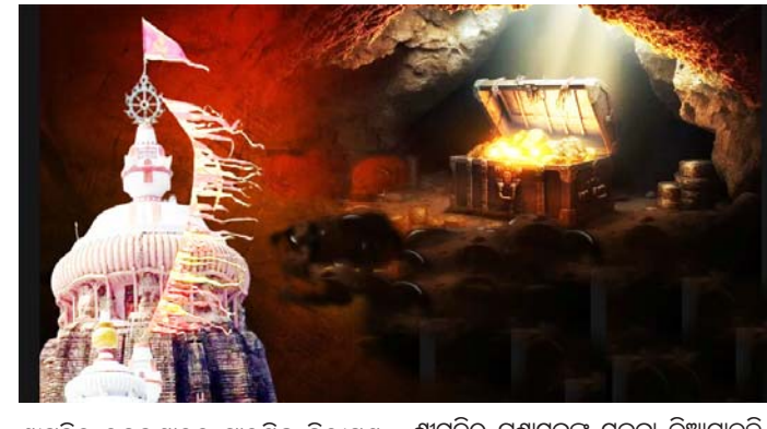
ଶ୍ରୀମନ୍ଦିର ରତ୍ନଭଣ୍ଡାରର ପ୍ରାରମ୍ଭିକ ନିରୀକ୍ଷଣ କରାଯିବ । ଏନେଇ ଏ.ଏସ.ଆଇ ପକ୍ଷରୁ

ପୁରୀ, ୧୭।୯ ଦୁଧିଲ କୁମ୍ଭରୋ ମହାପ୍ରଭୁଙ୍କ ରତ୍ନଭଣ୍ଡାର ପୁଣି ଖୋଲିବ । ଖୁବ ଶୀଘ୍ର ରତ୍ନଭଣ୍ଡାର ରହସ୍ୟ ଉପରୁ ପରଦା ହଟିବ । ଗୁପ୍ତ କୋଠା, ଗୁପ୍ତ ସୁତରାଂ ଓ ଗୁପ୍ତ ଯାତ୍ରା ଇତ୍ୟାଦି ପୂର୍ବରୁ ପଡ଼ିବାକୁ ଯାଉଛି । ଦୀର୍ଘ ୬ ବର୍ଷ ତଳୁ ରତ୍ନଭଣ୍ଡାର ସ୍ଥିତି ସଙ୍ଗୀନ ଥିବା ବେଳେ ରୂପବାର ଦିନ ରତ୍ନଭଣ୍ଡାର ମରାମତି ପାଇଁ ପ୍ରକ୍ରିୟା ଆରମ୍ଭ ହେବ । ମରାମତି ପୂର୍ବରୁ ପ୍ରାରମ୍ଭିକ ପର୍ଯ୍ୟାୟରେ ଏସଏଆଇ ରତ୍ନଭଣ୍ଡାର ଯାଞ୍ଚ କରିବ । ଭାରତୀୟ ପ୍ରତ୍ନତାତ୍ତ୍ୱିକ ସର୍ବେକ୍ଷଣ ସଂସ୍ଥା (ଏସଏଆଇ) ପକ୍ଷରୁ ରୂପବାର