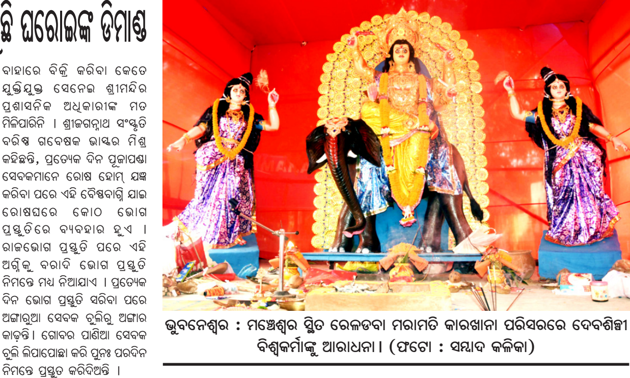
ଭୁବନେଶ୍ୱର : ମଞ୍ଜୁଶ୍ରୀଙ୍କ ସ୍ଥିତ ରେଳଡବା ମାରାମତି କାରଖାନା ପରିସରରେ ଦେବଶିଳ୍ପୀ ବିଶ୍ୱକର୍ମାଙ୍କୁ ଆରାଧନା ।

ଶ୍ରୀମନ୍ଦିର ରୋଷ ଘର ଅଙ୍ଗାର ଖୋଜୁଛନ୍ତି ସୁନାରୀ: ବସ୍ତା ୭୦୦, ବଢ଼ୁଛି ଘରୋଇଙ୍କ ଡିମାଣ୍ଡ ପରେ ଜଣାପଡ଼ିଛି । ସେମାନଙ୍କ କହିବା ମୁତାବକ, ଶ୍ରୀମନ୍ଦିରକୁ କର୍ମଚାରୀଙ୍କୁ ହାତ କରି ସେମାନେ ଏହି ଅଙ୍ଗାର ପାଉଛନ୍ତି । ଏ ବ୍ୟବସ୍ଥାରେ ଉଚ୍ଚ କର୍ମଚାରୀଙ୍କୁ କିଛି ଟଙ୍କା ଦେଉଛନ୍ତି । ପରେ ଏହାକୁ ଶୁଖାଇ ପାଉଁଶରୁ ଅଙ୍ଗାରକୁ ଅଲଗା କରୁଛନ୍ତି । ଏହି ଅଙ୍ଗାରକୁ ନେବା ନିମନ୍ତେ ଲୋକଙ୍କ ଦେଶ ରାହିବା ହେଉଛି । ବିଶେଷ ଭାବେ ସୁନାରୀ ଓ ଆର୍ଥିକ କରୁଥିବା ଲୋକେ ଏହି ଅଙ୍ଗାର ନେବାକୁ ଆଗ୍ରହ ପ୍ରକାଶ କରୁଛନ୍ତି । ତେଣୁ ସେମାନେ ଏହି କାମରେ ଲାଗିଛନ୍ତି । ଏହି କାମ କରୁଥିବା ଲୋକଙ୍କୁ ଦେଶ ରୋଜଗାର ମଧ୍ୟ ହୋଇଯାଇଛି । ତେବେ ଶ୍ରୀମନ୍ଦିରକୁ ଅଙ୍ଗାର ଅଣାଯାଇ