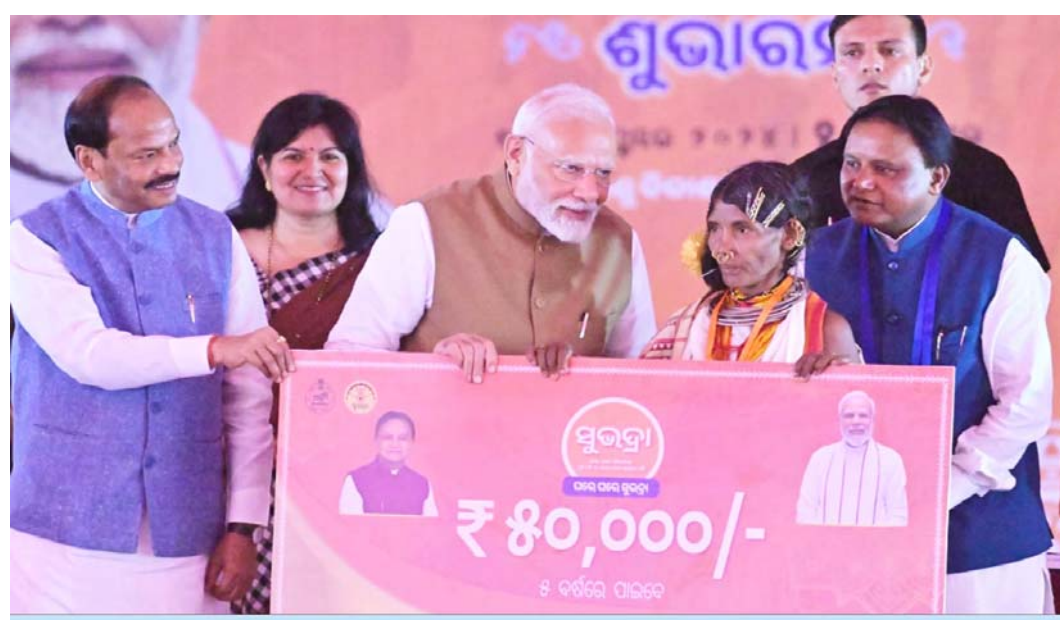
କରୁଥିବାରୁ ସେ ମୁଖ୍ୟମନ୍ତ୍ରୀ ଓ ପୂଜ୍ୟ ଉପ-ମୁଖ୍ୟମନ୍ତ୍ରୀ, ମନ୍ତ୍ରୀ ମନ୍ତ୍ରଣାଳୟ ସଦସ୍ୟ ଏବଂ ପୂରୀ ଓଡ଼ିଶା ସରକାରଙ୍କୁ ଉକ୍ତ ପ୍ରଶଂସା ପାଳନ କଲେ । ଓଡ଼ିଶାର ନୂଆ ସରକାର ସାଧାରଣ ଲୋକମାନଙ୍କୁ ଭେଟି ସେମାନଙ୍କ ସମସ୍ୟାର ସମାଧାନ ପାଇଁ ପ୍ରଚେଷ୍ଟା

ସୁଭଦ୍ରା ଯୋଜନାର ଶୁଭାରମ୍ଭ ଅବସରରେ ସବୁଠି ଖୁସି ଓ ଆନନ୍ଦର ପରିବେଶ ଦେଖିବାକୁ ମିଳିଥିଲା । ଭୁବନେଶ୍ୱରରେ ଲକ୍ଷାଧିକ ମହିଳା ଏହି କାର୍ଯ୍ୟକ୍ରମରେ ଯୋଗ ଦେଇଥିଲେ । ମା'ମାନଙ୍କ ମୁହଁରେ ଖୁସିର ଲହରୀ ଦେଖିବାକୁ ମିଳିଥିଲା । ସୂଚନାଯୋଗ୍ୟ ଯେ, ଏହି ଯୋଜନା ରାଜ୍ୟର ସବୁଠାରୁ ବଡ଼, ବ୍ୟକ୍ତିଗତ ମହିଳାକେନ୍ଦ୍ରିତ ଯୋଜନା । ଏଥିରେ ୫ ହଜାର ଟଙ୍କା ଲେଖାଏଁ ସୁକ୍ଷ୍ମକିଷ୍ତିରେ ପ୍ରତି ବର୍ଷ ୧୦ ହଜାର ଟଙ୍କା ଦିଆଯିବ । ୫ ବର୍ଷରେ ମିଳିବ ୫୦ ହଜାର