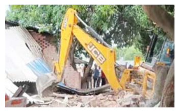
ନିର୍ମାଣ ହୋଇଛି, ତେବେ ସେଥିରେ ଆମର କୌଣସି ଆପତ୍ତି ନାହିଁ । କିନ୍ତୁ ଉଚ୍ଚେଦନ ଆଇନସମ୍ମତ ହେବା ଉଚିତ । ମାମଲାର ପରବର୍ତ୍ତୀ ଶୁଣାଣି ଅକ୍ଟୋବର ୧ରେ ହେବ । ଶୁଣାଣି ସମୟରେ (ପୃଷ୍ଠା ୭ରେ)

ନୂଆଦିଲ୍ଲୀ, ୧୭।୯ ସାରା ଦେଶରେ ଝଲିଥିବା ବୁଲଡୋଜର କାର୍ଯ୍ୟାନୁଷ୍ଠାନକୁ ନେଇ ମଙ୍ଗଳବାର ସୁପ୍ରିମ କୋର୍ଟ ଏକ ବଡ଼ ଆଦେଶ ଦେଇଛନ୍ତି । ସର୍ବୋଚ୍ଚ ନ୍ୟାୟାଳୟ ସମଗ୍ର ଦେଶରେ ବୁଲଡୋଜର କାର୍ଯ୍ୟାନୁଷ୍ଠାନ ଉପରେ ରୋକ୍ ଲଗାଇଛନ୍ତି । ସର୍ବୋଚ୍ଚ ନ୍ୟାୟାଳୟଙ୍କ ବିନା ଅନୁମତିରେ କୌଣସି ଉଚ୍ଚେଦନ କରାଯିବ ନାହିଁ ବୋଲି କୋର୍ଟ ନିର୍ଦ୍ଦେଶ ଦେଇଛନ୍ତି । ଯଦି କୌଣସି ମନ୍ଦିର, ମସଜିଦ୍, ଗୁରୁଦ୍ୱାରା କିମ୍ବା କୌଣସି ଧାର୍ମିକ ସ୍ଥାନ ସରକାରୀ ସମ୍ପତ୍ତିରେ