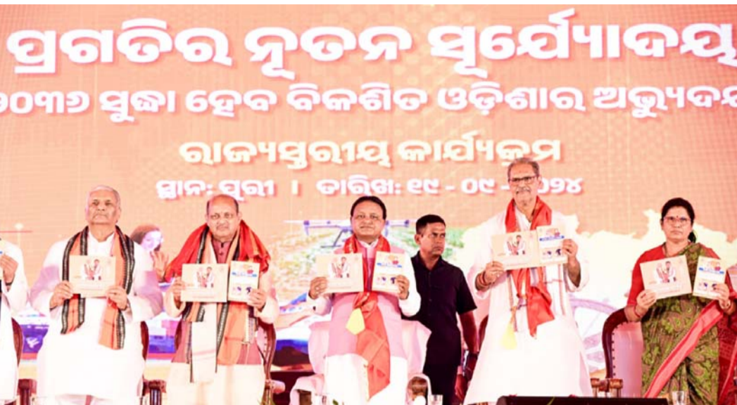
୧୦୦ ଦିନ ମଧ୍ୟରେ ସମସ୍ତ ପ୍ରମୁଖ ପ୍ରତିଶ୍ରୁତି ପାଳନ କରିବୁ ଆଗାମୀ ୧୨ ବର୍ଷର କାଳଖଣ୍ଡରେ ସମଗ୍ର ଓଡ଼ିଶା ଗଠନ ହେବ ପ୍ରଥମ ୪ ବର୍ଷରେ ଏହାର ମୂଳଦୁଆ ପଡ଼ିବ ସଂକଳ୍ପ ପତ୍ର ଆମ ପାଇଁ ଧର୍ମଗ୍ରନ୍ଥ

ମୁଖ୍ୟମନ୍ତ୍ରୀ କହିଥିଲେ ଯେ ଜନତାଙ୍କ ଆଶୀର୍ବାଦରେ ୨୦୨୩ରେ ସମସ୍ତ ଓଡ଼ିଶା ଗଠନର ଏକକ ପୂରଣ ହେବ । ଏହାର ମୂଳଦୁଆ ପ୍ରଥମ ୪ ବର୍ଷରେ ପଡ଼ିବ । ଏହାର ପ୍ରକ୍ରିୟା ପ୍ରଥମ ୧୦୦ ଦିନ ମଧ୍ୟରେ ଆରମ୍ଭ ହୋଇ ଯାଉଛି । ବିକଶିତ ଭାରତରେ ଓଡ଼ିଶା ନିର୍ଦ୍ଦିଷ୍ଟ ଭାବରେ ବିକାଶର ରେକ ଗାଡ଼ିରେ ପ୍ରଥମ ବସି ହେବ ।