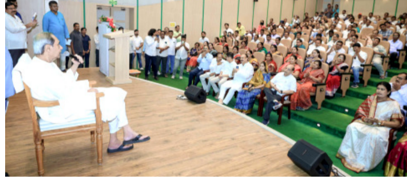
ବରଗଡ଼ ଏବଂ ବୌଦ୍ଧ ଜିଲ୍ଲାର ସାଙ୍ଗଠନିକ ବୈଠକ ଚଳୁଥିଲା ।