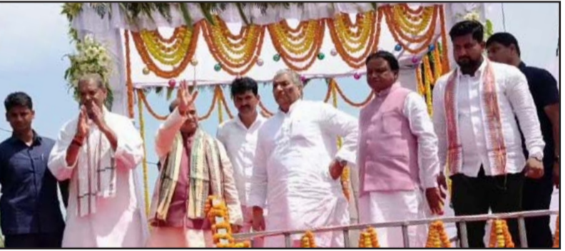
ପୂର୍ବତନ ବିଧାୟକ ତଥା ବିରୋଧୀ ଦଳ ଉପନେତା ସ୍ୱର୍ଗତ ବିଷ୍ଣୁ ଚରଣ ସେଠୀଙ୍କ ଦ୍ୱିତୀୟ ଶ୍ରାଦ୍ଧ ବାର୍ଷିକୀରେ ଯୋଗଦେଲେ ମୁଖ୍ୟମନ୍ତ୍ରୀ ମୋହନ ଚରଣ ମାଝୀ ।