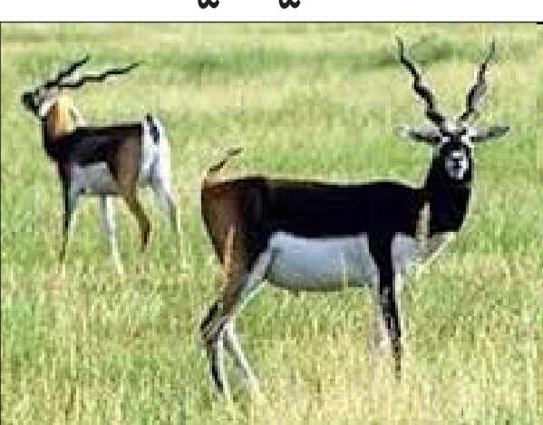
ଭୁବନେଶ୍ୱର, ୧୯/୯ ମୁଖ୍ୟ ବ୍ୟବସାୟ ଭୁବନେଶ୍ୱର ସ୍ଥିତ ନନ୍ଦନକାନନରୁ କୋଣାର୍କ-ବାଲୁଖଣ୍ଡ ଅଭୟାରଣ୍ୟ ଗଲେ ୧୩ଟି କୃଷ୍ଣସାର ମୃଗ । ଏକ ସ୍ୱତନ୍ତ୍ର ଭ୍ୟାନରେ ନନ୍ଦନକାନନ ତିହିଆଖାନାରୁ କୃଷ୍ଣସାର ମୃଗମାନଙ୍କୁ କୋଣାର୍କ

ଏବେ ପର୍ଯ୍ୟନ୍ତ ପରିମାଣର ଚିତ୍ର ହରଣ ରହିଛି । ରିପୋର୍ଟ ଅନୁସାରେ ୫୦୦ରୁ ଅଧିକ ହରଣ ଥିବା ଜଣାପଡ଼ିଛି । ତେବେ କୃଷ୍ଣସାର ମୃଗ ବଂଶ କୃଷି ପାଇଁ ପ୍ରଶାସନ ଉଦ୍ୟମ ଆରମ୍ଭ କରିଛି । ପ୍ରଥମ ପର୍ଯ୍ୟାୟରେ ଅଧିକ ଗତ ଜୁନ ୧୮ ତାରିଖରେ ୬ଟି ମାଝ ଓ ୪ଟି ଅଣ୍ଡା ମୋଟ ୧୦ଟି କୃଷ୍ଣସାର ମୃଗ ଉଚ୍ଚ ଅଭୟାରଣ୍ୟକୁ ସ୍ଥାନାନ୍ତରଣ କରାଯାଇଥିଲା । ଏବେ ଆଉ ୧୩ କୃଷ୍ଣସାର ମୃଗ ନନ୍ଦନକାନନରୁ ଯାଇଛି । ଅଭୟାରଣ୍ୟକୁ ଆସିଥିବା କୃଷ୍ଣସାର ମୃଗମାନଙ୍କୁ ଏବେ କ୍ୱାରେଣ୍ଟାଇନରେ ରଖାଯାଇଛି । ପ୍ରାୟ ୧୦ ଦିନ ପରେ ସେମାନଙ୍କୁ ଅଭୟାରଣ୍ୟରେ ମୁକ୍ତ ଭାବେ ଛଡ଼ାଯିବ । ସେମାନଙ୍କୁ କୁରୁଜଙ୍ଗ ଗଡ଼ିବି ସଂଲଗ୍ନ ଜଙ୍ଗଲରେ ଛଡ଼ାଯିବ । ସେମାନଙ୍କ ଖାଦ୍ୟର ପାଇଁ ବ୍ୟବସ୍ଥା କରିଛି । କୋଣାର୍କ-ବାଲୁଖଣ୍ଡ ଅଭୟାରଣ୍ୟରେ ପୂର୍ବରୁ କୃଷ୍ଣସାର ମୃଗ ଥିଲେ । ହେଲେ ଗତ ୨୦ ବର୍ଷ ହେଲା ସେମାନଙ୍କ ବଂଶ ଲୋପ ପାଇଯାଇଛି ।