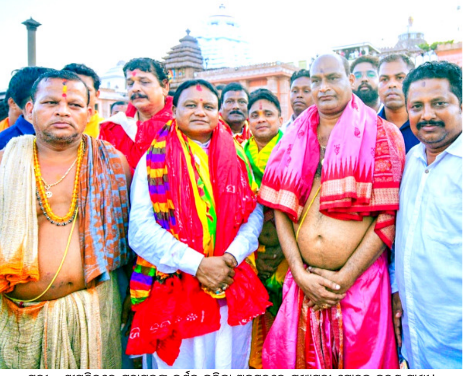
ପୁରୀ : ଶ୍ରୀମନ୍ଦିରରେ ମହାପ୍ରଭୁଙ୍କୁ ଦର୍ଶନ କରିବା ଅବସରରେ ମୁଖ୍ୟମନ୍ତ୍ରୀ ମୋହନ ଚରଣ ମାଝୀ