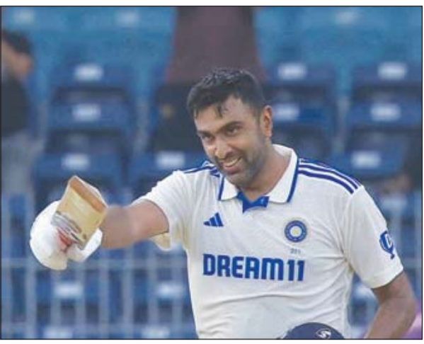
ଏକାଦି ବ୍ୟାଟି କରିଥିଲେ ଏବେ ଦଳୀୟ ଭାବେ ୩୩୯ରେ ପହଞ୍ଚି ଯାଇଛି ।

ଚେନ୍ନାଇ ଭାରତ ଓ ବାଂଲାଦେଶ ମଧ୍ୟରେ ଚେନ୍ନାଇର ଏମିଏ ବିବାହର ୨୯ ବର୍ଷ ଶତବ୍ଦୀ ପୂର୍ଣ୍ଣ କରିବା ପାଇଁ କମଳା କଲେ ଅଶ୍ୱିନ ଓ ଲାଡ଼େଜା ନିଜର କଳା ଦେଖାଇଛନ୍ତି ।