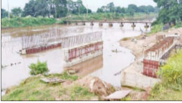
କେମାଳ ଉପରେ ୫କୋଟି ୬ ଲକ୍ଷ ଟଙ୍କା ବ୍ୟୟ ଅଟକିଥିବା ବିଜୁ ସେତୁର ନିର୍ମାଣ ଅବସ୍ଥା ଶେଷ ହୋଇଯାଇଥିବା ମଧ୍ୟ ସେତୁ କାର୍ଯ୍ୟ ଆଧାରେ ରହିଛି ।

ବାଇଙ୍ଗ, ନୂୟଦିଲ୍ଲୀ ବାଇଙ୍ଗ ବୃକ୍କ ଅଗତି ବେଳଗଣ ଆ ପଞ୍ଚାୟତର ନୟାପାଟଣାରେ ନିର୍ମାଣ ଚାଲିଥିବା ବିଜୁ ସେତୁର ନିର୍ମାଣ ଅବସ୍ଥା ଶେଷ ହୋଇଯାଇଥିବା ମଧ୍ୟ ସେତୁ କାର୍ଯ୍ୟ ଆଧାରେ ରହିଛି । ବିଭାଗ ପକ୍ଷରୁ କେବଳ ୪ଟି ପିଲାର ନିର୍ମାଣ କରାଯାଇ ସେତୁ କାର୍ଯ୍ୟ ଆଧାରେ ରହିଛି ।