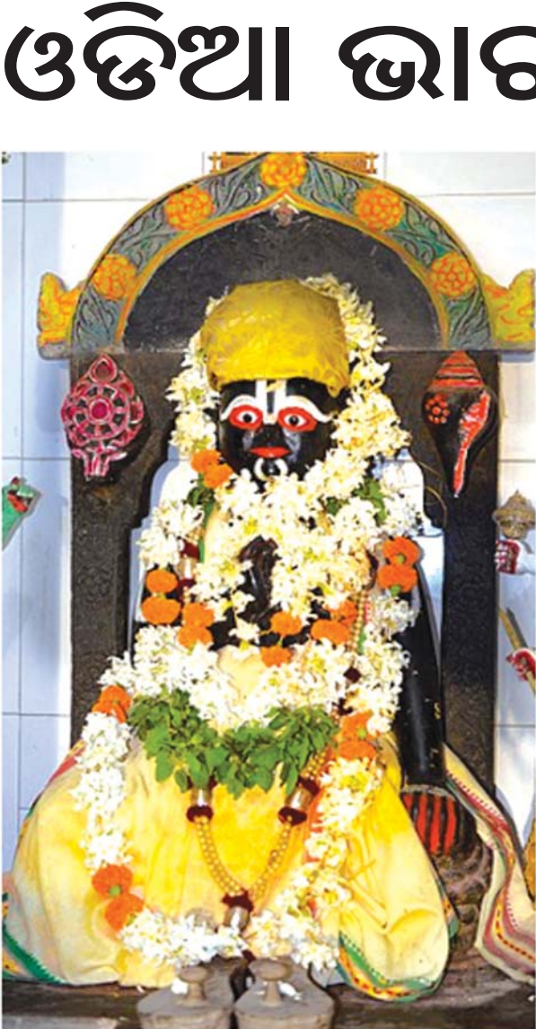
ପୁରୀ ସାତ ଲହଡ଼ି ମଠରେ ଥିବା ଅତିବଡ଼ା ଜଗନ୍ନାଥ ଦାସଙ୍କର ପ୍ରତିମୂର୍ତ୍ତି

ଭାଗବତ ଏକ ପବିତ୍ର ଗ୍ରନ୍ଥ । ଏହା ପ୍ରତିଟି ଓଡ଼ିଆଙ୍କ ଘରେ ପଠିତ ଏବଂ ‘ଭାଗବତ ଜନ୍ମଦିବସ’ ଏକ ପର୍ବ ଭାବରେ ପ୍ରଚଳିତ । ସେଥିପାଇଁ ବିଗତ ୪ ଶହ ବର୍ଷ ଧରି ଆମ ରାଜ୍ୟର ସମସ୍ତ ଭାଗବତ ପୂଜିତେ ତାଳପତ୍ର ପୋଥି ଭାଗବତ ଏବଂ ଏହାର ପୂଜିତଗ୍ରନ୍ଥ ପୂଜା ହୋଇ ଆସୁଅଛି । ଆନନ୍ଦର ବିଷୟ ବର୍ତ୍ତମାନର ବ୍ୟସ୍ତ କିନ୍ତୁ ଏବଂ ବସ୍ତୁବାଦୀ ସମାଜରେ ସମୟର ସ୍ୱଳ୍ପତା ଆଦି ବିପତ୍ତିର ସ୍ଥିତିରେ ମଧ୍ୟ ଅନେକ ନିଜ ନିଜ ଘରେ କିମ୍ବା ଗାଦି ପାଖରେ ବସି ଅଧ୍ୟାୟେ ଭାଗବତ ନିଶ୍ଚିତ ପଢୁଅଛନ୍ତି । ଓଡ଼ିଶାରେ ପ୍ରାୟ ୭୨୦୦ ଭାଗବତ ପୂଜିରହିଛି ଏବଂ ସେଠାରେ ପ୍ରତ୍ୟହ ଭାଗବତ ପଢା ଯାଉଅଛି । ପ୍ରତିବର୍ଷ ଭାଦ୍ରମାସ ଇନ୍ଦ୍ରପୂର୍ଣ୍ଣିମା ଦିନ ପ୍ରତିଘରେ ଏବଂ ପୁରୀ ଶ୍ରୀମନ୍ଦିରରେ ଥିବା ଜଟବତ ମୂଳରେ ଭଜନ କାର୍ତ୍ତନ, ଭାଗବତ ପାରାୟଣ ଓ ପ୍ରସାଦ ସେବନ ଆଦି ବିବିଧ କାର୍ଯ୍ୟକ୍ରମ ମାଧ୍ୟମରେ ଭାଗବତ ଜନ୍ମଉତ୍ସବ ପାଳିତ ହେଉଅଛି ।