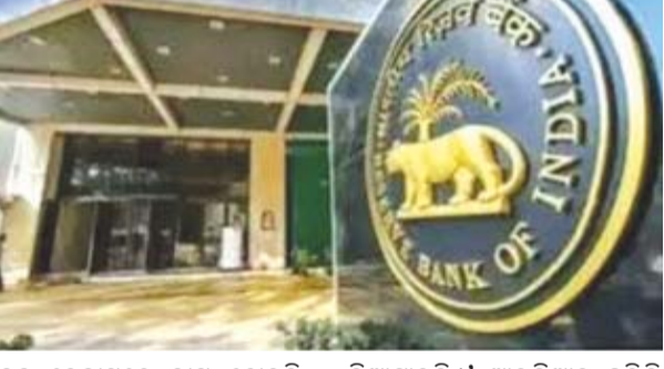
ବନ୍ଦ ହେବାପରେ ଲାଗୁ ହୋଇଛି, ଯାହାକି ୬ ମାସର ସମୟସୀମା ପାଇଁ ଜାରି ରହିବ । ତେବେ ଏହାର ସମୟ ସମୟରେ ସମାପ୍ତ କରାଯିବ ।

ନୂଆଦିଲ୍ଲୀ, ୧୪/୬ ଭାରତୀୟ ରିଜର୍ଭ ବ୍ୟାଙ୍କ (ଆରବିଆଇ) ଗ୍ରାହକଙ୍କ ହିତକୁ ଦୃଷ୍ଟିରେ ରଖି ଏକ ବଡ଼ ନିଷ୍ପତ୍ତି ନେଇଛନ୍ତି । ଆରବିଆଇ ମେଗାଭିରା ସମବାୟ ବ୍ୟାଙ୍କର ଆର୍ଥିକ ସ୍ଥିତିରେ ହ୍ରାସକୁ ଦେଖି ଏହା ଉପରେ ବହୁ କଟକଣା ଲଗାଇଛି । ଏହା ପ୍ରଥମ ଥର ନୁହେଁ ଯେତେବେଳେ ଆରବିଆଇ କଟକଣା ଲଗାଇ ବ୍ୟାଙ୍କ ଉପରେ କଟକଣା ଲଗାଇ ଦେଇଛି । ଏହା ପୂର୍ବରୁ ମଇରେ ମଧ୍ୟ ଏକ ସହକାରୀ ବ୍ୟାଙ୍କର ଲାଇସେନ୍ସ ରଦ୍ଦ କରି ଦିଆଯାଇଥିଲା ।