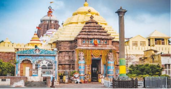
ଲାଭ କରିବେ । ଏନେଇ ପହୁଡ଼ ଖୋଲିବା ଠାରୁ ଶୁଖାଇମାନେ ଲମ୍ବା ଲାଞ୍ଜ ନିଗାଉଥିଲେ । ହେଲେ ପ୍ରବଳ ଖରା ଯୋଗୁଁ ସେମାନଙ୍କୁ କଳବଳ ହେବାକୁ ପଡ଼ିଥିଲା । ଗୁଳୁଗୁଳୁ ଅଶ୍ରୁବ୍ୟକ୍ତ କରିଦେଇଥିଲା ବେଳେ ଶ୍ରୀଜୀଉଙ୍କ ଦର୍ଶନ ଲାଗି ବ୍ୟାକୁଳ ହୋଇପଡ଼ିଥିଲେ ଶ୍ରଦ୍ଧାଳୁ ।

ଦାରିସିରେ ହାଣି ନିର୍ଦ୍ଦିଷ୍ଟ ମାପ ଅନୁସାରେ ଅଂଳା ଓ ଗାରେଡ଼ି ତିଆରି ହେଉଛି । ରଥର ଚତୁର୍ଥପାର୍ଶ୍ୱରେ ଲାଗେ ୪ ଦୁଆରଘଡ଼ା । ୩ ରଥ ପାଇଁ ନିର୍ମାଣ ହୁଏ ୧୨ ଦୁଆରଘଡ଼ା । ଦୁଆର ଘଡ଼ାର ଉପର ଅଂଶ ହେଉଛି ‘ଚନ୍ଦ୍ର ଶାଳି’ । ଗୋଟିଏ ଦୁଆରଘଡ଼ାର ଦୁଇପଟେ ଲାଗେ ଗାରେଡ଼ି । ଚନ୍ଦ୍ରଶାଳିରେ ଲାଗିବ ଅଂଳା । କାହିଁକେ ଅମଲକୁ ଏସବୁ କଞ୍ଚା କାଠରେନିର୍ମାଣ ହେଉଥିବା ସେ କୁହନ୍ତି । ଚିତ୍ରକର ସେବକମାନେ ରଥାଂଶୁକୁ ଜୀବନ୍ତ କରିବାରେ ଲାଗିଛନ୍ତି । ରଥର ଶିଖରତୁମ୍ଭରୁ ଚିତ୍ର ଚାଲିଛି । ରଥରେ ଶିଖରତୁମ୍ଭରୁ ଲାଗିଲେ ପାର୍ଶ୍ୱ ଦେବତା ସ୍ଥାପନା ହେବ । ପ୍ରତି ରଥରେ ୯ଜଣକରି ପାର୍ଶ୍ୱ ଦେବତା ବିଜେ କରିବେ ।