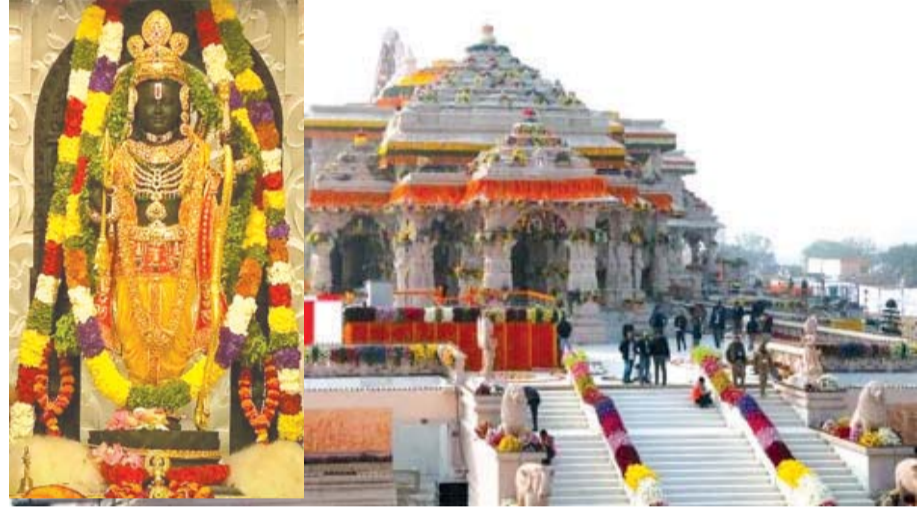
ଆଦିତ୍ୟନାଥ ଓ ରାଜ୍ୟପାଳ ଆନନ୍ଦି ବେନ ସମ୍ପର୍କରେ ଉପସ୍ଥିତ ରହିଥିଲେ। ସେପଟେ ରାମଲାଲଙ୍କ ପ୍ରାଣ ପ୍ରତିଷ୍ଠା ଉତ୍ସବ ପାଇଁ ସାରା ଅଯୋଧ୍ୟା ସହର ରାମମନ୍ଦିର ହୋଇପଡ଼ିଛି। ହଜାର ହଜାର ଭକ୍ତଙ୍କ ସହ

ଯେଉଁ ମୁହୂର୍ତ୍ତକୁ ଅଗଣିତ ଭକ୍ତ ବହୁବର୍ଷ ଧରି ଅପେକ୍ଷା କରି ରହିଥିଲେ ତାହାର ଅନ୍ତ ହୋଇଛି। ବହୁ ପ୍ରଦୀପିତ ଅଯୋଧ୍ୟା ରାମ ମନ୍ଦିରର ଗର୍ଭଗୃହରେ ପ୍ରତିଷ୍ଠା ହୋଇଛନ୍ତି ଶ୍ରୀରାମ ଲାଲା। ଶୁଭ ମୁହୂର୍ତ୍ତରେ ମହତ୍ତ୍ୱପୂର୍ଣ୍ଣ ନେତୃତ୍ୱରେ ରାମଲାଲଙ୍କ ପ୍ରତିଷ୍ଠା ହୋଇଛି। ଗର୍ଭଗୃହରେ ପ୍ରାଣ ପ୍ରତିଷ୍ଠା ପରେ ରାମଲାଲଙ୍କ ଚିତ୍ତାକର୍ଷକ ରୂପ ଓ ଅଲୌକିକ ରୂପକୁ ସାରା ବିଶ୍ୱ ଦେଖିଛି। ଗର୍ଭଗୃହରେ ସୁନା ବେଶରେ ରାମଲାଲଙ୍କ ମନୋହର ମୂର୍ତ୍ତି ମନ ମୋହୁଛି। ପ୍ରଧାନମନ୍ତ୍ରୀ ପ୍ରଥମେ ପବିତ୍ର ସରସ୍ୱ ନଦୀରେ ସ୍ନାନ ତପଣ ପରେ ପୂର୍ବ ଦିଗରେ ମନ୍ଦିର ମଧ୍ୟକୁ ପ୍ରବେଶ କରିବା ପରେ ପ୍ରାଣ ପ୍ରତିଷ୍ଠା କାର୍ତ୍ତିକାତି ଅରମ୍ଭ ହୋଇଥିଲା। ଆରବ୍ୟସ୍ୟ ମୁଖ୍ୟ ମୋହନ ଭାଗବତଙ୍କ ସହ ଉତ୍ତର ପ୍ରଦେଶ ମୁଖ୍ୟମନ୍ତ୍ରୀ ଯୋଗୀ