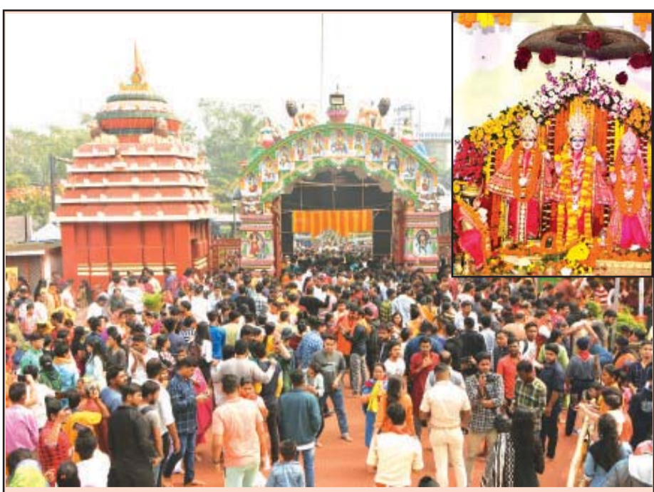
ଭୁବନେଶ୍ୱର : ଅଯୋଧ୍ୟାରେ ପ୍ରଭୁ ଶ୍ରୀରାମଙ୍କ ମନ୍ଦିର ଓ ପ୍ରାଣପ୍ରତିଷ୍ଠା ଅବସରରେ ରାଜଧାନୀର ରାମମନ୍ଦିରରେ ଉତ୍ତମାନଙ୍କ ଅସମ୍ଭାଳ ଭିଡ଼।

ବର୍ଷ ଅକ୍ଟୋବର ୨ ଗଣା ଜୟନ୍ତୀରୁ ଜୟପ୍ରକାଶ ନାରାୟଣ ଜୟନ୍ତୀ ଯାଏ ଜନ ସମ୍ପର୍କ ପଦଯାତ୍ରା ହୋଇଥିଲା। ତା'ପରେ ପ୍ରତି ନିର୍ବାଚନ ମଣ୍ଡଳରେ ୨୦୦ ପ୍ରତିନିଧିଙ୍କୁ ଶଙ୍ଖ ଭବନରେ ବିଜି ନ୍ସ ପ୍ରସଙ୍ଗରେ ଡ୍ରେ ନିଂ ବିଆଯାଇଥିଲା। ଡିସେମ୍ବର ୨୫ ସୁଦ୍ଧା ଜୋନ ସ୍ତରୀୟ ଡ୍ରେ ନିଂ ସମ୍ପୂର୍ଣ୍ଣ ହୋଇଛି। ଆସନ୍ତାକାଳି କାରୁଆରୀ ୨୩ ନେତାଜୀ ଜୟନ୍ତୀରୁ ମାର୍ଚ୍ଚ ୫ ବିଜୁ ଜୟନ୍ତୀ ଯାଏ ପରିବାର ସମ୍ପର୍କ ଅଭିଯାନ କରାଯିବ। ଘରେ ଘରେ ପହଞ୍ଚିବା ସହ, ଲିଫ୍‌ଲେଟ୍ ମାଧ୍ୟମରେ କ୍ୟାମ୍ପେନ କରାଯିବ। ନବୀନ ସରକାରଙ୍କ ସମ୍ପର୍କତା ଘରେ ଘରେ ପହଞ୍ଚାଇବାକୁ କାର୍ଯ୍ୟକ୍ରମ ହେବ। ଏହାକୁ ସ୍ଥାନୀୟ ନେତୃତ୍ୱ ଅନୁପାଳନ କରିବେ। ଜିଲ୍ଲା ପର୍ଯ୍ୟବେକ୍ଷକ ଏହାକୁ ଚଦାରଖ କରିବେ। ଏହି କାର୍ଯ୍ୟକ୍ରମ କରି ଆରେ ବିଜେଡ଼ିର ନେତୃତ୍ୱ