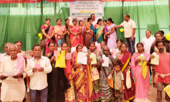
ଅଭିଭାବକଙ୍କୁ ଯୋଗାଣ କରାଯାଇଥିବା ଭଉ ଟଙ୍କା ପ୍ରଦାନ କରାଯାଇଛି । ଏହା ପରେ ପ୍ରଦାନ କରାଯାଇଥିବା ଭଉ ଟଙ୍କା ପ୍ରଦାନ କରାଯାଇଛି ।

ବ୍ରଜରାଜନଗର, ନ୍ୟୁଜ୍ ବ୍ୟୁରୋ ବ୍ରଜରାଜନଗର ପୌରାଞ୍ଚଳରେ ପରିଷଦ କାର୍ଯ୍ୟକ୍ରମ ପରିସରରେ ମଧୁବାବୁ ପେଟ୍, ସମ୍ପାଦକ ଯୋଜନାରେ ରାଜ୍ୟ ସରକାର ତରଫରୁ ପ୍ରଦାନ କରାଯାଇଥିବା ଭଉ ଟଙ୍କା ପ୍ରଦାନ କରାଯାଇଛି । ଏହା ପରେ ପ୍ରଦାନ କରାଯାଇଥିବା ଭଉ ଟଙ୍କା ପ୍ରଦାନ କରାଯାଇଛି ।