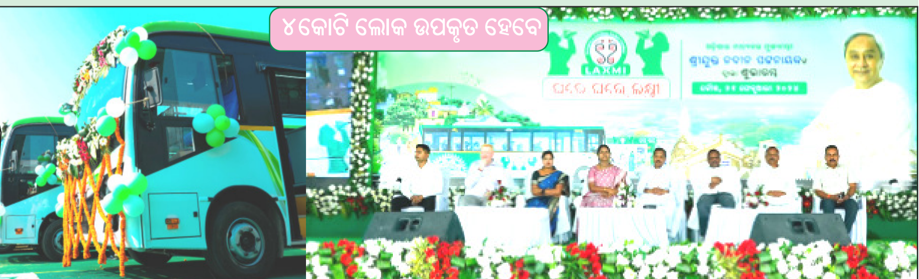
୪କୋଟି ଲୋକ ଉପକୃତ ହେବେ