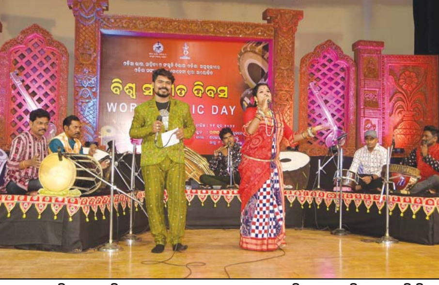
ଭୁବନେଶ୍ୱର : ବିଶ୍ୱ ସଂଗୀତ ଦିବସ ପାଳନ ଅବସରରେ ରବୀନ୍ଦ୍ର ମଣ୍ଡପରେ ଓଡ଼ିଆ ଭାଷା, ସାହିତ୍ୟ ଓ ସଂସ୍କୃତି ବିଭାଗ ପକ୍ଷରୁ ଆୟୋଜିତ ସଂଗୀତ ସଭାରେ କଳାକାରଙ୍କ ସମ୍ମାନପୂର୍ଣ୍ଣ ସଂଗୀତ ପରିବେଷଣ।

ସଂଘ ଭାବେ ଯେଉଁ ଅଖଣ୍ଡ ଜ୍ୟୋତି ପ୍ରଜ୍ୱଳିତ କରିଥିଲେ ତାହା ଆଜି ଭାରତୀୟ ସଂସ୍କୃତିର ରକ୍ଷା ଓ ରାଷ୍ଟ୍ରହିତ ସର୍ବୋପରି ମୂଲ୍ୟକୁ ନେଇ ବର୍ତ୍ତମାନ ପିଢ଼ିକୁ ନିସ୍ୱାର୍ଥ ରାଷ୍ଟ୍ରସେବାର ମାର୍ଗକୁ ପ୍ରଶଂସା କରୁଛି । ନିଜର ସଂପୂର୍ଣ୍ଣ ଜୀବନ ଦେଶ ଓ ସମାଜ ନିର୍ମାଣକୁ ସମର୍ପିତ କରୁଥିବା ଏଭଳି ଅନନ୍ୟ ରାଷ୍ଟ୍ର ଉପାସକଙ୍କ ପୁଣ୍ୟତିଥି ଅବସରରେ ସାଦର ପ୍ରଣାମ ।