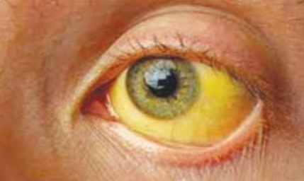
ବାହାର ଖାସ୍ତା ନ ଦେବାକୁ ଜିଲ୍ଲା ସ୍ୱାସ୍ଥ୍ୟ ବିଭାଗ ପକ୍ଷରୁ ପରାମର୍ଶ ଦିଆଯାଇଛି। ସହରରେ ବିଭିନ୍ନ ହେଉଥିବା ମୃଦୁ ପାନୀୟ ବେପାରୀମାନଙ୍କୁ ମଧ୍ୟ ମେଡିକାଲ ଟିମ୍ ଯାଞ୍ଚ କରି ସେଠୁ ମଧ୍ୟ ନମୁନା ସଂଗ୍ରହ କରୁଛନ୍ତି।

ସମ୍ବଲପୁର, ୨୧୧୦୭: ଦୁ୍ୟକ୍ତ୍ୟବୋ ସମ୍ବଲପୁର ଜଣ୍ଡିସ ଚିହ୍ନଟ। ସମ୍ବଲପୁରର ସହରର ଧୂବାପଡ଼ା, କୁମ୍ଭାରପଡ଼ା, ଶାଳିଆ ବଗିଚା ଆଦି ଅଞ୍ଚଳରେ ଜଣ୍ଡିସ ବଢ଼ିବାରେ ଲାଗିଛି। ଶୁକ୍ରବାର ପୁଣି ୧୯ ୧୯ ଜଣ ଜଣ୍ଡିସ ରୋଗୀ ସହରରେ ପଚିଟିଭ ଥିବା ବିଡ଼ିଏଏଫ କହିଛନ୍ତି। ତେବେ ମୋଟ ସହରରେ ୬୮ ଜଣ ଜଣ୍ଡିସ ଆକ୍ରାନ୍ତ ଚିହ୍ନଟ ହୋଇଥିବା ବେଳେ ସମସ୍ତେ ଘରେ ରହି ଚିକିତ୍ସିତ ହେଉଛନ୍ତି। ବର୍ତ୍ତମାନ ମେଡିକାଲ ଟିମକୁ ଆହୁରି ବଢ଼ାଯାଇଛି। ଘରକୁ ଘର ବୁଲି ବୁଡ଼ି ସାମ୍ପଲ ସଂଗ୍ରହ କରୁଛନ୍ତି ମେଡିକାଲ ଟିମ୍। ଯଦି କାହାର ପଚିଟିଭ ଜଣାପଡ଼ୁଛି ତା'ହେଲେ ସଙ୍ଗେସଙ୍ଗେ ଟ୍ରାନ୍ସମେଟ୍ ଆରମ୍ଭ କରାଯାଇଛି। ସମସ୍ତ ରୋଗୀ ପ୍ରାୟ ୧୪ ବର୍ଷରୁ କମ୍। ତେଣୁ ଛୁଆ ମାନଙ୍କୁ