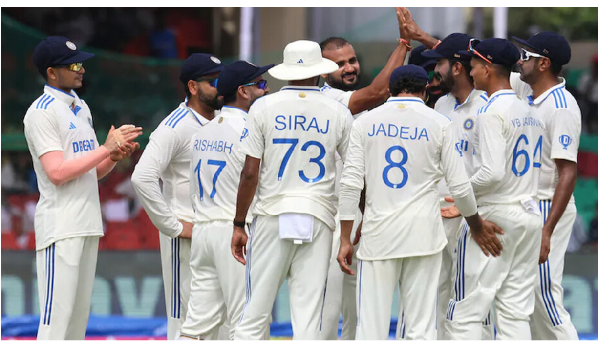
ତାହେଲେ ଭାରତ ଅନ୍ୟ ବିଶ୍ୱ ଟେଷ୍ଟ ଚମ୍ପିୟନସିପ ଫାଇନାଲର ପଏଣ୍ଟ ଟେବୁଲରେ ୧୦ ମାନ୍ୟତା ୭୧.୬୭ ବିକ୍ରୟ ପ୍ରତିଶତ ସହ ୧୯ନରେ ରହିବ ।

କାନପୁର ଦ୍ୱିତୀୟ ଟେଷ୍ଟର ପ୍ରଥମ ଦିନ କେବଳ ୩୫ ଓଭର ଖେଳ ହୋଇଥିବା ବେଳେ ବ୍ୟାଟିଂ ଦଳ ଟ୍ରିକେଟ୍ ହରାଇ ୧୦୬ ରନ କରିଥିଲା । ହେଲେ ଦ୍ୱିତୀୟ ଦିନରେ ବର୍ଷା ଯୋଗୁ ଗୋଟିଏ ବଲ ପଡ଼ି ପାରି ନାହିଁ । ବର୍ଷା ଓ ଓଦା ଆଉଟ ଫିଲ୍ଡ ଭାରତ-ବାଙ୍ଗଳାଦେଶ ମଧ୍ୟରେ ଆରମ୍ଭ ହୋଇଥିବା ଦ୍ୱିତୀୟ ଟେଷ୍ଟର ସବୁଠାରୁ ବଡ଼ ପ୍ରସଙ୍ଗ । କାନପୁରର ଗ୍ରୀମ ପାର୍କ ଷ୍ଟାଡ଼ିୟମରେ ଲଗାଣ ବର୍ଷା ଭାରତ ବିଶ୍ୱ ଟେଷ୍ଟ ଚମ୍ପିୟନସିପ ଫାଇନାଲ ଖେଳିବା ଆଗରେ କଣ୍ଠା ହୋଇ ଛିଡ଼ା ହୋଇଛି । ଭାରତର ଫାଇନାଲ ଖେଳିବା ବାଟରେ ବର୍ଷା ଏବେ ବାଧା ସୃଷ୍ଟି କରିଛି । ଦ୍ୱିତୀୟ ଟେଷ୍ଟର ପ୍ରଥମ ଦିନ କେବଳ ୩୫ ଓଭର ଖେଳ ହୋଇଥିବା ବେଳେ ବ୍ୟାଟିଂ ଦଳ ଟ୍ରିକେଟ୍ ହରାଇ ୧୦୬ ରନ କରିଥିଲା । ହେଲେ ଦ୍ୱିତୀୟ ଦିନରେ ବର୍ଷା ଯୋଗୁ ଗୋଟିଏ ବଲ ପଡ଼ି ପାରି ନାହିଁ । ଯଦି ସ୍ଥିତିବାଦୀ କାରି ରହିବ,