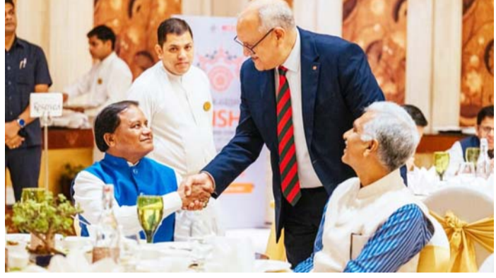
ଆସନ୍ତାବର୍ଷ ଜାନୁଆରୀ ୨୮ ଓ ୨୯ତାରିଖରେ 'ଉତ୍କର୍ଷ ଓଡ଼ିଶା-୨୦୨୫ କନକ୍ୱେଜ'

ଭୁବନେଶ୍ୱର, ୩୧୧୦ ଦୁଧଲ୍ ବ୍ୟବସାୟ ଓଡ଼ିଶାକୁ ଅଧିକ ପୁଞ୍ଜି ଆଣିବା ସହ ଆଗାମୀ ଦିନରେ ବିଦେଶୀ ପୁଞ୍ଜି ନିବେଶ ବଢ଼ାଇବା ଲକ୍ଷ୍ୟ ନେଇ ଦିଲ୍ଲୀ ଗସ୍ତରେ ଥିବା ମୁଖ୍ୟମନ୍ତ୍ରୀ ମୋହନ ଚରଣ ମାଝୀ ଗୁରୁବାର ସେଠାରେ ଆୟାସତର୍କ ମିଟ୍ କରିଛନ୍ତି । ପ୍ରାୟ ୩୪ଟି ବିଦେଶୀ ରାଷ୍ଟ୍ରପୁଞ୍ଜି ସମେତ ୯ଟି ଆନ୍ତର୍ଜାତିକ ସଂଗଠନ ପ୍ରତିନିଧିମାନଙ୍କ ସହ ଏହି ବୈଠକରେ ଯୋଗଦେଇ ମୁଖ୍ୟମନ୍ତ୍ରୀ ଓଡ଼ିଶାରେ ଶିକ୍ଷା ପ୍ରତିଷ୍ଠା ସଂକ୍ରାନ୍ତରେ ଆଲୋଚନା କରିଛନ୍ତି । ବୈଠକ ପରେ ମୁଖ୍ୟମନ୍ତ୍ରୀ କହିଛନ୍ତି ଯେ କମିଶନର, ହାଇକମିଶନର ଓ ବରିଷ୍ଠ ଅଧିକାରୀଙ୍କ ସହିତ ସକରାତ୍ମକ ଆଲୋଚନା ହୋଇଛି ।