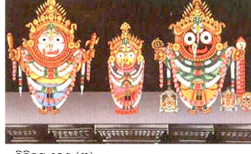
ତ୍ରିବିକ୍ରମ ବେଶ (୩)