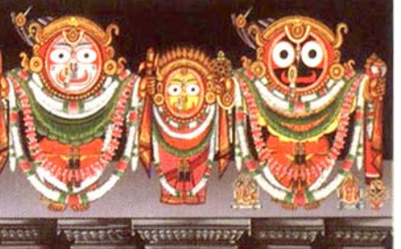
ବାଳବୃତ୍ତା ବେଶ (୨)