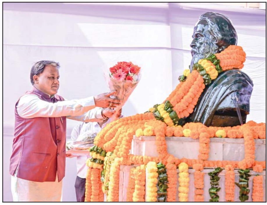
ଭୁବନେଶ୍ୱର : ୫୭ତମ ଶ୍ରୀକ୍ଷାର୍ଷିକୀ ପାଳନ ଅବସରରେ ବିଧାନସଭା ପରିସରରେ ଥିବା ପଣ୍ଡିତ ନାଳକଣ୍ଠ ଦାସଙ୍କ ପ୍ରତିମୂର୍ତ୍ତିରେ ଶ୍ରୀକ୍ଷାସୁମନ ଅର୍ପଣ କରୁଛନ୍ତି ମୁଖ୍ୟମନ୍ତ୍ରୀ ମୋହନ ଚରଣ ମାଝି ।

କଟକ, ନ୍ୟୁଜ କ୍ୟୁରୋ ଓଡ଼ିଶା ମାଧ୍ୟମିକ ଶିକ୍ଷା ପରିଷଦ (ବୋର୍ଡ) ଦ୍ୱାରା ପରିଚାଳିତ ସଂସ୍କୃତ ମଧ୍ୟମ ଏବଂ ଓଡ଼ିଶା ରାଜ୍ୟ ମୁକ୍ତ ବିଦ୍ୟାଳୟ (ପ୍ରଥମ) ବାର୍ଷିକ ପରୀକ୍ଷା ନିମନ୍ତେ ଫର୍ମପୂରଣ ପ୍ରକ୍ରିୟା ଆରମ୍ଭ ହୋଇଛି । ମଧ୍ୟମ ଛାତ୍ରଛାତ୍ରୀଙ୍କ ଫର୍ମପୂରଣ ଅଫିସ୍‌ରେ ମଧ୍ୟମରେ ସମ୍ପୂର୍ଣ୍ଣ ଶିକ୍ଷାନୁଷ୍ଠାନ ତରଫରୁ ବୋର୍ଡ ମୁଖ୍ୟ କାର୍ଯ୍ୟାଳୟରେ କରାଯିବ । ସେହିଭଳି ମୁକ୍ତ ବିଦ୍ୟାଳୟର ଛାତ୍ରଛାତ୍ରୀମାନେ ଅନୁମୋଦିତ ମଧ୍ୟମରେ ଫର୍ମ ପୂରଣ କରିବେ । ଫର୍ମପୂରଣ ପରେ ଭୋଲ ସିବୁଲ ପ୍ରଧାନ ଶିକ୍ଷକମାନେ ନିଜ ତତ୍ତ୍ୱାବଧାନରେ ରଖିବା ସହ ଏହାର ଏକ ନକଲ ବୋର୍ଡର ଆଞ୍ଚଳିକ କାର୍ଯ୍ୟାଳୟରେ ନଭେମ୍ବର ୨୦ ତାରିଖ ସୁଦ୍ଧା ଦାଖଲ କରିବେ । ଏହି ସମସ୍ତ ଫର୍ମପୂରଣ ପ୍ରକ୍ରିୟା ନଭେମ୍ବର ୧୮ ତାରିଖରେ ଶେଷ ହେବ ବୋଲି ବୋର୍ଡ ପକ୍ଷରୁ ବିଶ୍ୱସ୍ତ ପ୍ରକାଶ ପାଇଛି ।