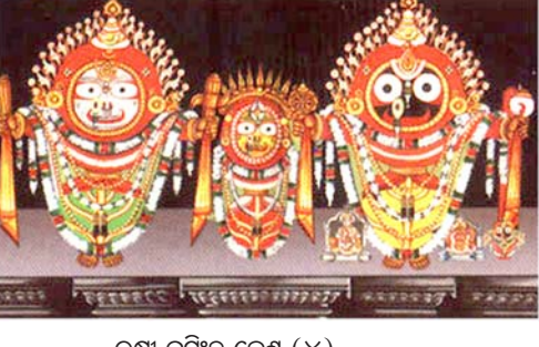
ଲକ୍ଷ୍ମୀ ନୃସିଂହ ବେଶ (୪)