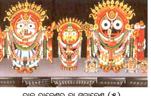
ରାଜ ରାଜେଶ୍ୱର ବା ସୁନାବେଶ (୫)

ଏହି ମାସରେ ମହାପ୍ରଭୁଙ୍କର ସକାଳୁ ଧୂପ (ରାଜଭୋଗ) ସରିବା ପରେ ପରେ ଏକ ସ୍ୱତନ୍ତ୍ର ଭୋଗ ଅନୁଷ୍ଠିତ ହୋଇଥାଏ, ଏହାକୁ ବାଳଧୂପ (ବାଳଭୋଗ) କୁହାଯାଏ । ଏହି ଭୋଗରେ ସାଧାରଣତଃ କୋରା, ଦୋରାଜା ଲିଆ, ଅଦା, ଖଇ, ନଡ଼ିଆ ଖୁଦି, ବାଉଁଶିଆ, ସେଡ଼, କମଳା, କାକୁଡ଼ି, ପଇଡ଼ ଓ କଦଳୀ ଭୋଗ କରାଯାଏ । ପରମ୍ପରା କ୍ରମେ ଶ୍ରୀକ୍ଷେତ୍ରର କେତେଗୁଡ଼ିଏ ନିର୍ଦ୍ଦିଷ୍ଟ ମଠ ଏଥିନିମନ୍ତେ ଶ୍ରୀମନ୍ଦିରକୁ ଭୋଗ ସାମଗ୍ରୀ ଯୋଗାଇ ଦେଇଥାନ୍ତି । ଭୀଷ୍ମପଞ୍ଚକର ପ୍ରଥମ ଦିନ (ଏକାଦଶୀ) ତିଥିରେ ଲକ୍ଷ୍ମୀନାରାୟଣ ବେଶ ଅନୁଷ୍ଠିତ ହୋଇଥାଏ । ଏହି ବେଶର ଅନ୍ୟନାମ ଠିଆକିଆ ବେଶ । ଉକ୍ତଦିନ ଶ୍ରୀମନ୍ଦିରରେ ଶ୍ରୀକାନ୍ତଙ୍କର ଅବକାଶ ନୀତି ପରେ ପ୍ରାୟ ୨୨