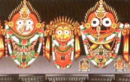
ଲକ୍ଷ୍ମୀ-ନାରାୟଣ ବେଶ (୧)

ମହାପ୍ରଭୁଙ୍କର କାର୍ତ୍ତିକ ମାସ ପଞ୍ଚକରେ ହେଉଥିବା ବେଶ