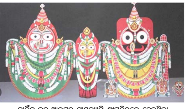
କାର୍ତ୍ତିକ ବ୍ରତ ଆରମ୍ଭରୁ ମାସବ୍ୟାପି ଶ୍ରୀମନ୍ଦିରରେ ହେଉଥିବା ମହାପ୍ରଭୁଙ୍କ ଦାମୋଦର (ଶ୍ରୀବିଷ୍ଣୁ) ବେଶ

ଚଳିତ ବର୍ଷ ପଞ୍ଚକ ୪ ଦିନ ପଡୁଥିବାରୁ ଚତୁର୍ଦ୍ଦଶୀ ଦିନର ଲକ୍ଷ୍ମୀ ନୃସିଂହ ବେଶ ହେବନାହିଁ