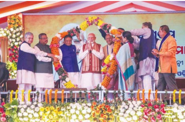
ଭୁବନେଶ୍ୱର : ତିନିଦିନିଆ ଓଡ଼ିଶା ଗଣ୍ଡରେ ଆସିଥିବା ପ୍ରଧାନମନ୍ତ୍ରୀ ନରେନ୍ଦ୍ର ମୋଦିଙ୍କୁ ବିମାନ ବନ୍ଦର ଠାରେ ସ୍ୱାଗତ ସମ୍ପର୍କିତା କାର୍ଯ୍ୟକ୍ରମ।

ମାମଲାର ପରବର୍ତ୍ତୀ ଶୁଣାଣି ଏବେ ଡିସେମ୍ବର ୨ ତାରିଖରେ ହେବ। ଉଲ୍ଲେଖଯୋଗ୍ୟ ଯେ ନଭେମ୍ବର ୧୮ ତାରିଖ ସକାଳ ସାଢ଼େ ୮ଟାରେ ରାଜଧାନୀ ଦିଲ୍ଲୀ ଓ ଏନସିଆରରେ ଗ୍ରାମ୍-୪ କଟକଣା ଲାଗୁ ହୋଇଥିଲା। ଏହି କଟକଣା ଯୋଗୁ ଦିଲ୍ଲୀକୁ ଟ୍ରକ୍ ପ୍ରବେଶ ନିଷିଦ୍ଧ ହୋଇଛି। ଏନସିଆରରେ ସଡ଼କ, ପୁଲଭଙ୍ଗର ସମେତ ବିଭିନ୍ନ ପ୍ରକଳ୍ପ ନିର୍ମାଣ କାର୍ଯ୍ୟରେ ରୋକ ଲାଗିଛି। ତେବେ ସୁପ୍ରିମକୋର୍ଟ ଏହି କଟକଣାକୁ ଷ୍ଟାଲ୍ ଓ ଶିକ୍ଷାନୁଷ୍ଠାନ ଗୁଡ଼ିକୁ ବାଦ୍ ଦେଇଥିଲେ। ଏଣୁ କୋର୍ଟ ଗତ ସାମାଜିକ ସୂଚ୍ୟ-ଏମ୍‌କ୍ୟୁ ଖୋଲିବା ପାଇଁ ବିଚାର କରିବାକୁ କହିଥିଲେ। ଉଲ୍ଲେଖଯୋଗ୍ୟ ଯେ ଗୁରୁବାର ସକାଳେ ଦିଲ୍ଲୀରେ ବାୟୁ ପ୍ରଦୂଷଣ ଓ ଡ଼ାକ୍ତର ବୃଦ୍ଧି ଦେଖାଯାଇଛି। ଏଥିରେ ଦିଲ୍ଲୀର ଏୟାର କ୍ୱାଲିଟି ବହୁତ ଖରାପ ଶ୍ରେଣୀରେ ଥିଲା। କେନ୍ଦ୍ରୀୟ ପ୍ରଦୂଷଣ ନିୟନ୍ତ୍ରଣ ବୋର୍ଡ଼ (ସିପିସିବି) ତଥ୍ୟ ଅନୁସାରେ ସକାଳ ୯ଟା ବେଳେ ଦିଲ୍ଲୀର ଏୟାର କ୍ୱାଲିଟି ଇଣ୍ଡେକ୍ସ ୩୧୧୩ ରେକର୍ଡ଼ କରାଯାଇଛି। ତେବେ ଦିନକ ପୂର୍ବରୁ ଅର୍ଥାତ୍ ଦୁଇବାର ସକାଳ ୯ଟା ବେଳେ ଏହା ୩୦୧ ଥିଲା। କାତୀୟ ରାଜଧାନୀ ବନ୍ଧକ କୁହୁଡ଼ିରେ ଆହାତ ହେବା।