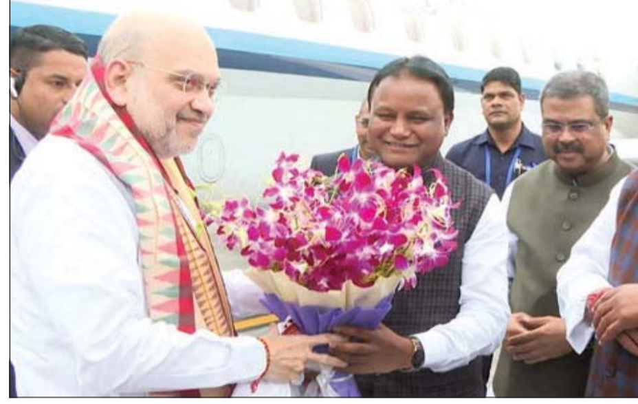
ଭୁବନେଶ୍ୱର : ଡିଜିଟି ସମ୍ମିଳନୀ ପାଇଁ ଓଡ଼ିଶା ଗଣ୍ଡରେ ଆସିଥିବା ସୁରକ୍ଷା ମନ୍ତ୍ରୀ ଅମିତ ଶାହଙ୍କୁ ଭୁବନେଶ୍ୱର ବିମାନ ବନ୍ଦର ଠାରେ ସ୍ୱାଗତ କରୁଛନ୍ତି ମୁଖ୍ୟମନ୍ତ୍ରୀ ମୋହନ ଚରଣ ମାଝୀ ଓ କେନ୍ଦ୍ର ଶିକ୍ଷା ମନ୍ତ୍ରୀ ଧର୍ମେନ୍ଦ୍ର ପ୍ରଧାନ।

ଭୁବନେଶ୍ୱର, ୨୯.୧୧.୧୧ ଦୁଧିକୂଳ, ୨୯.୧୧.୧୧ ଜଙ୍ଗଲ ସୁରକ୍ଷାରେ ଗଡ଼ିବ ୧୩୯ ଗାଡ଼ି। ଜଙ୍ଗଲ ସୁରକ୍ଷାକୁ ମଜବୁତ କରିବା ଉଦ୍ଦେଶ୍ୟରେ ଏହି ଯୋଜନା କରାଯାଇଛି। ଏହି ଯୋଜନାରେ ବିଭିନ୍ନ ଜଙ୍ଗଲ ଓ ବନ୍ୟପ୍ରାଣୀ ବିଭାଗର ୩ ପ୍ରକାରର ୧୩୯ଟି ଯାନ ଯୋଗାଇ ଦେବାର ବ୍ୟବସ୍ଥା କରାଯାଇଛି। ଏହି ଯାନଗୁଡ଼ିକ ମଧ୍ୟରେ ରହିଛି ୫୧ଟି ଅଲ-ଟେରେନ୍, ୪୧ଟି ଜଳ ସିଞ୍ଚନ ଅଗ୍ନି ନିର୍ବାପକ ଏବଂ ୪୭ଟି ଅଗ୍ନି ନିରାକରଣ ସହାୟତା ଯାନ। ରାଜ୍ୟ ଭିତ୍ତର ଉଦ୍ୟାନରେ ବନ ବାହିନୀର ମୁଖ୍ୟ ଓ ବନ୍ୟପ୍ରାଣୀ ବିଭାଗର ପ୍ରଧାନ ମୁଖ୍ୟ ବନ ସଂରକ୍ଷକ ଗାଡ଼ିଗୁଡ଼ିକ ଶୁଭାରେ କରାଯାଇ କାର୍ଯ୍ୟକ୍ରମ ରହିଛି।