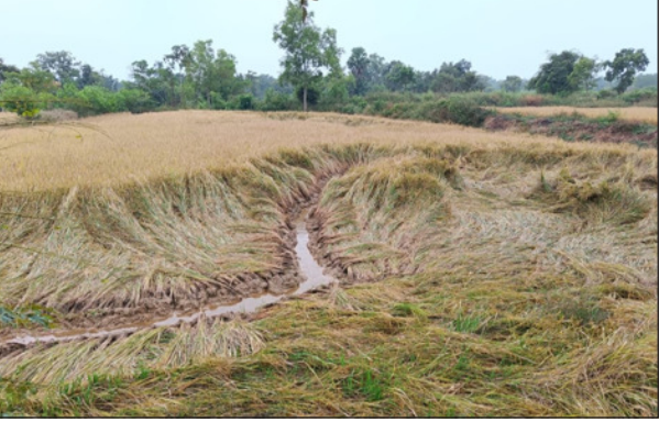
ବୁଗୁଡ଼ା, ନ୍ୟୁକ୍ ବ୍ୟୁରୋ

ଲଘୁତ୍ୱପ ପ୍ରଭାବରୁ ଦିନ ତମାମ ବୁଗୁଡ଼ା ଅଞ୍ଚଳରେ ଆକାଶ ମେଘାନ୍ଧନୁ ସାଙ୍ଗକୁ ଝିରିଝିରି ବର୍ଷାର ପ୍ରତିକୂଳ ପାଗ