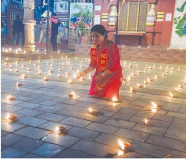
ଭୁବନେଶ୍ୱର : ରାମ ମନ୍ଦିର ପରିସରରେ ଦେବ ଦୀପାବଳି ଉତ୍ସବ ପାଳନ କରାଯାଇଛି । (ଫଟୋ : ସମ୍ବାଦ କଳିକା)

ବୁଧବାର, ୨/୧୨ ନଭେମ୍ବରରେ ମୋଟ୍ ସାମଗ୍ରୀ ଓ ସେବା ଟିକସ (ଜିଏସ୍‌ଟି) ସଂଗ୍ରହ ୮.୫% ବୃଦ୍ଧି ହୋଇ ୧.୮୨ ଲକ୍ଷ କୋଟି ଟଙ୍କା ଛୁଇଁଛି । ଗତ ବର୍ଷ ସମାନ ସମୟରେ ଏହା ୧.୬୮ ଲକ୍ଷ କୋଟି ଟଙ୍କା ରହିଛି । କେନ୍ଦ୍ର ସରକାର ଜାରି କରିଥିବା ଡାଟାରୁ ଏହା ସାମ୍ନାକୁ ଆସିଛି । ଏହି ସମୟରେ ଓଡ଼ିଶାରେ ଜିଏସ୍‌ଟି ଆଦାୟ ୪୭୦୪ କୋଟି ପରୋକ୍ଷ ସଂଗ୍ରହ ହୋଇଛି । ଏହା ଗତ ବର୍ଷ ସମାନ ସମୟରେ ୪୨୯୫ କୋଟି ଟଙ୍କାରେ ୧୦% ଅଧିକ । ରାଜ୍ୟ ଜିଏସ୍‌ଟି ଏବଂ ସମନ୍ୱିତ ଜିଏସ୍‌ଟିରେ ରାଜ୍ୟକୁ ସେବକମେଷ୍ଟ ପରେ ଚଳିତ ଆର୍ଥିକ ବର୍ଷ ଅଦ୍ୟାବଧି ୧୭,୨୫୩ କୋଟି ରହିଛି । ଏକ୍ସେସରେ ଅଭିବୃଦ୍ଧି ରହିଛି ୧୧% । ନଭେମ୍ବରରେ ମୋଟ୍ ଜିଏସ୍‌ଟି ମଧ୍ୟରେ ୩୪,୧୪୧ କୋଟିର କେନ୍ଦ୍ର ଜିଏସ୍‌ଟି, ୪୩,୦୪୭ କୋଟିର ରାଜ୍ୟ ଜିଏସ୍‌ଟି, ୯୧,୮୨୮ କୋଟିର ସମନ୍ୱିତ ଜିଏସ୍‌ଟି ଏବଂ ୧୩,୨୫୩ କୋଟିର ସେସ୍ ସାମିଲ ରହିଛି । ଏହି ଅବଧିରେ ଘରୋଇ ନେଶଦେଶରୁ ଜିଏସ୍‌ଟି ୯.୪% ବୃଦ୍ଧି ହୋଇ ୧.୪୦ ଲକ୍ଷ କୋଟି ଟଙ୍କା ରହିଛି । ସେହିଭଳି ସାମଗ୍ରୀ ଆମଦାନିରୁ ଟିକସ ୬% ବୃଦ୍ଧି ହୋଇ ୪୨,୫୯୧ କୋଟି ରହିଛି । ସରକାର ୧୯,୨୫୯ କୋଟି ଟଙ୍କାର ରିଫଣ୍ଡ ଜାରି କରିଛନ୍ତି । ରିଫଣ୍ଡ ଜାରି ପରେ ନେଟ୍ ଜିଏସ୍‌ଟି ସଂଗ୍ରହ ୧୧% ବଢ଼ି ୧.୬୩ ଲକ୍ଷ କୋଟି ରହିଛି । ଅକ୍ଟୋବରରେ ମୋଟ୍ ଜିଏସ୍‌ଟି ଆଦାୟ ୯% ବୃଦ୍ଧି ହୋଇ ୧.୮୬ ଲକ୍ଷ କୋଟି ଟଙ୍କା ରହିଥିଲା । ଯାହା ଦ୍ୱିତୀୟ ସର୍ବାଧିକ । ଘରୋଇ ବଜାରରେ ବିକ୍ରି ଓ ଅନୁପାଳନରେ ଉନ୍ନତି ଯୋଗୁ ଟିକସ ଆଦାୟରେ ଏଭଳି ଉନ୍ନତି ଆସିଥିଲା । ଅକ୍ଟୋବରରେ ୩୩,୮୨୧ କୋଟିର କେନ୍ଦ୍ର ଜିଏସ୍‌ଟି, ୪୧,୮୬୪ କୋଟିର ରାଜ୍ୟ ଜିଏସ୍‌ଟି, ୯୯,୧୧୧ କୋଟିର ସମନ୍ୱିତ ଜିଏସ୍‌ଟି ଏବଂ ୧୨,୫୫୦ କୋଟିର ସେସ୍ ଆଦାୟ ହୋଇଥିଲା । ଏପ୍ରିଲ-ନଭେମ୍ବର ଅବଧିରେ କେନ୍ଦ୍ର ସରକାର ୧୪.୫୭ ଲକ୍ଷ କୋଟିର ଜିଏସ୍‌ଟି ଆଦାୟ କରିଛନ୍ତି ବୋଲି ସୂଚନା ମିଳିଛି ।