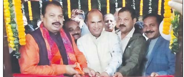
ବୌଦ୍ଧ, ନ୍ୟୁଜ୍‌ସ୍‌ପେର ବୌଦ୍ଧ ଜିଲ୍ଲା ଷ୍ଟାଡ଼ିଅମ୍ ଠାରେ ଜିଲ୍ଲା କ୍ରିକେଟ୍ ଆସୋସିଏସନର