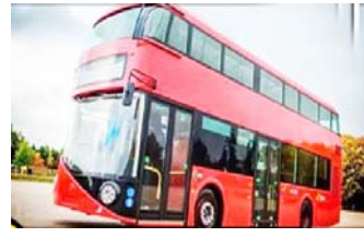
ଡେକର ଇଲେକ୍ଟ୍ରିକ ବସ ଯୋଗାଣ, ପରିଚାଳନା ଏବଂ ରକ୍ଷଣାବେକ୍ଷଣ ପାଇଁ ବସ ଅପରେଟର ଚୟନ ପାଇଁ ଏକ ଟେଣ୍ଡର ଡକାଯାଇଛି । ଏହି ୧୦ ବର୍ଷିଆ ବୁକ୍ସରେ ସମ୍ପୂର୍ଣ୍ଣ, ଅପରେସନ, (ପୃଷ୍ଠା ୭ରେ)

ଭୁବନେଶ୍ୱର, ୧୦୧୨ ଦୁଧିଲ ବ୍ୟବସାୟ ଖୁବଶୀଘ୍ର ଓଡ଼ିଶାରେ ଗଡ଼ିବ ଦୁଇ ଆକିଆ ବସ୍ । କ୍ୟାପିଟାଲ ରିଜିଅନ ସହରୀ ପରିବହନ (କୁଟ)ପକ୍ଷରୁ ଏଥିପାଇଁ ଟେଣ୍ଡର ଆହ୍ୱାନ କରାଯାଇଛି । ଖୋର୍ଦ୍ଧା, ପୁରୀ, କଟକ ଜିଲ୍ଲା ପାଇଁ ଏହି ଯୋଜନା କରାଯାଇଛି । ଏହି ଦୁଇ ଆକିଆ ବସ୍ ଗୁଡ଼ିକ ଇଲେକ୍ଟ୍ରିକ ହୋଇଥିବାରୁ ପ୍ରଦୂଷଣ ଉପରେ ମଧ୍ୟ ନିୟନ୍ତ୍ରଣ ରହିବ । ୧୦+୨ ବର୍ଷ ପାଇଁ ଗ୍ରସ କଷ୍ଟ କଣ୍ଠାକୁ (ଜିସିଏ) ମତେଲ ଅଧୀନରେ ଡବଲ-