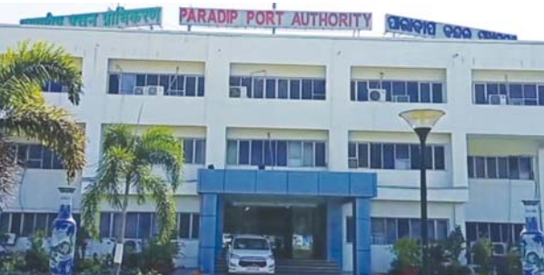
ବର୍ଷରେ ୧୫୦ ମିଲିୟନ ମେଟ୍ରିକ୍ ଟନ୍ ଅତିକ୍ରମ କରିବା ଲକ୍ଷ୍ୟ ରହିଥିବା ବନ୍ଦର ଅଧ୍ୟକ୍ଷ ପ୍ରକାଶ କରିଛନ୍ତି । ଗତ ଆର୍ଥିକ ବର୍ଷରେ

ପାରାଦୀପ, ନ୍ୟୁଜ୍ ବ୍ୟୁରୋ ପଣ୍ୟ କାରବାରରେ ରେକର୍ଡ କଲା ପାରାଦୀପ ବନ୍ଦର । ଲଗାତର ୮ ବର୍ଷ ଧରି ୧୦୦ ମିଲିୟନ ମେଟ୍ରିକ୍ ଟନ୍ ପଣ୍ୟ କାରବାର ଅତିକ୍ରମ କଲା ପାରାଦୀପ ବନ୍ଦର । ତେବେ ଗତବର୍ଷ ଉଲ୍ଲାନାରେ ୪ ମିଲିୟନ ମେଟ୍ରିକ୍ ଟନ୍ ଅଧିକ ପଣ୍ୟ କାରବାର କରିବା ସହିତ ୯ ଦିନ ପୂର୍ବରୁ ୧୦୦ ଏମଏମଟି ଅତିକ୍ରମ କରିଛି ବନ୍ଦର । ଚଳିତ ଆର୍ଥିକ