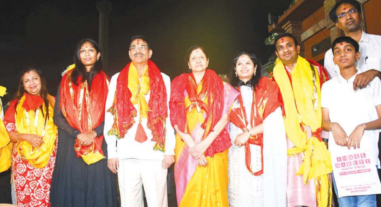
ପୁରୀ : ଭୁବନେଶ୍ୱରରେ ପଞ୍ଚମ ପାଠ୍ୟପୁସ୍ତକ ପରିବାରକୁ ଶ୍ରୀଜଗନ୍ନାଥଙ୍କୁ ଦର୍ଶନ କରିବା ଅବସରରେ ନୂତନ ରାଜ୍ୟପାଳ ଡ. ହରିବାବୁ କମ୍ବଳପତି ।

RNI Regd. No. : 52640/94 Postal Regd. No. : BN/60/25-27