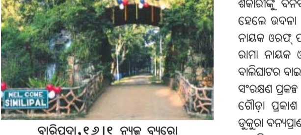
ଶିମିଳିପାଳ ଜାତୀୟ ଉଦ୍ୟାନର ଏକ ଦୃଶ୍ୟ ।

ଶିମିଳିପାଳ ଜାତୀୟ ଉଦ୍ୟାନର ଗୁରୁତ୍ଵପୂର୍ଣ୍ଣ ଅଂଶ ଖୁବ୍‌ଶୀଘ୍ର ଉପଲବ୍ଧ ହେବେ ପୋଲିସ ଫୋର୍ସ । ପ୍ରାଥମିକ ପର୍ଯ୍ୟାୟରେ ୧ ପୁଲ୍‌ଗେଟ୍ ଫୋର୍ସ ମୁକ୍ତ ହେବେ । ଜଣେ ଚାହୁଁଥିବା ସହ ମିଶ୍ରି ପାଣ୍ଡୋଲି କରିବା ସହିତ ଫୋର୍ସ ରେଡ୍ କରିବେ ବୋଲି ସୂଚନା ଦେଇଛନ୍ତି ମୟୂରଭଞ୍ଜ ଏସ୍‌ପି । ଶିମିଳିପାଳ ବ୍ୟାଘ୍ର ସଂରକ୍ଷଣ (ଏସ୍‌ଟିଆର) ପ୍ରକଳ୍ପରେ ଏକ କଳାବାଘର ହତ୍ୟା ପରେ ତତ୍ପର ହୋଇଛି ପ୍ରଶାସନ । ଶିମିଳିପାଳ ଏବଂ ବନ୍ୟପ୍ରାଣୀ ସାମଗ୍ରୀର ଅବିଧି ବ୍ୟବସାୟକୁ ବିରୋଧରେ ବଡ଼ କାର୍ଯ୍ୟାନୁଷ୍ଠାନ ଗ୍ରହଣ କରାଯାଇଛି । ଶିମିଳିପାଳ ଅଭୟାରଣ୍ୟରୁ ଶିକାର ହୋଇଥିବା କଳାବାଘ ଚମଡ଼ା ଓ ନଖକୁ ଜବତ କରାଯିବା ସହିତ ଘଟଣାରେ ଜଡ଼ିତ ୪ଜଣ