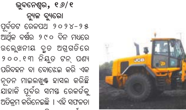
ଭୁବନେଶ୍ଵର, ୧୬/୧ ନ୍ୟୁଜ୍ ବ୍ୟୁରୋ ପୂର୍ବତଟ ରେଳପଥ ୨୦୨୪-୨୫ ଆର୍ଥିକ ବର୍ଷର ୨୯୦ ଦିନ ମଧ୍ୟରେ ଉଲ୍ଲେଖନୀୟ ଦ୍ରୁତ ଅଗ୍ରଗତିରେ ୨୦୦.୧୩ ନିୟୁତ ଟଙ୍କା ପଣ୍ୟ ପରିବହନ ବା ବୋଧେଇ କରି ଏକ ନୂତନ ମାଲଲଗୁଣ୍ଠ ହାସଲ କରିଛି ଯାହାକି ପୂର୍ବର ସମସ୍ତ ରେକର୍ଡକୁ ଅତିକ୍ରମ କରିନେଇଛି । ଏହି ସଫଳତା ଭାରତୀୟ ରେଳ ଜରିଆରେ ସର୍ବାଧିକ ପଣ୍ୟ ପରିବହନକୁ ସୂଚିତ କରିଥାଏ ଯାହାକି ପଣ୍ୟ ବୋଧେଇ ଏବଂ କାର୍ଯ୍ୟକ୍ରମ ଉତ୍କର୍ଷରେ ରେଳପଥର ନେତୃତ୍ଵକୁ ଦୃଷ୍ଟାନ୍ତମୂଳକ କରିଥାଏ । ପୂର୍ବ ଆର୍ଥିକ ବର୍ଷ (୨୦୨୩-୨୪)ରେ ପଣ୍ୟ ବୋଧେଇ କ୍ଷେତ୍ରରେ ନିଜସ୍ଵ

ରେକର୍ଡ ୨୯୫ ଦିନକୁ ଅତିକ୍ରମ କରି ପୂର୍ବତଟ ରେଳପଥ ଚଳିତ ଜାନୁଆରୀ ୧୫ ତାରିଖରେ ୨୦୦ ନିୟୁତ ଟଙ୍କା ପଣ୍ୟ ବୋଧେଇ କରି ନୂତନ ରେକର୍ଡ ସୃଷ୍ଟି କରିଛି । ଏହି ବର୍ଷର ସଫଳତା ଗତ ଆର୍ଥିକ ବର୍ଷର ୧୫ ଦିନ ପୂର୍ବରୁ ସମ୍ପନ୍ନ ହୋଇଥିଲା ଏବଂ ପୂର୍ବ ବର୍ଷ ସୃଷ୍ଟିକରେ ଏକ ଦୃଷ୍ଟାନ୍ତମୂଳକ ପ୍ରଦର୍ଶନ ସୃଷ୍ଟି କରିଥିଲା । ଯେଉଁଠାରେ ଏହା ୨୦୧୯-୨୦ ମସିହାରେ ଏହି ସଫଳତା ହାସଲ କରିବା ପାଇଁ ୩୬୬ ଦିନ ସମୟ ନେଇଥିଲା ବେଳେ