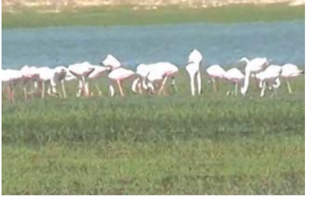
ଚିଲିକାରେ ଥିବା ପକ୍ଷୀ ଗଣନା କାର୍ଯ୍ୟର ଏକ ଦୃଶ୍ୟ ।

ବାଜୀ, ୧୬।୧ ନ୍ୟୁଜ୍ ବ୍ୟୁରୋ ଚିଲିକାରେ ହେବ ପକ୍ଷୀ ଓ ଡଲଫିନ୍ ଗଣନା । ପ୍ରତିବର୍ଷ ଭଳି ଚଳିତ ବର୍ଷ ଏହି ଗଣନା କାର୍ଯ୍ୟ ହେବ । ଗୋଟିଏ ଦିନରେ ସରିବ ପକ୍ଷୀ ଗଣନା । କିନ୍ତୁ ୩ ଦିନ ଧରି ହେବ ଡଲଫିନ୍ ଗଣନା । ଶୁକ୍ରବାର ପକ୍ଷୀ ଗଣନା ପାଇଁ ଟ୍ରେନିଂ କ୍ୟାମ୍ପ ହେବ । ଶନିବାର ହେବ ପକ୍ଷୀ ଗଣନା । ଚିଲିକା ବନ୍ୟପ୍ରାଣୀ ଭିତ୍ତିକ ନ ଅଧିକରେ ଥିବା ୫ ଟି ରେଞ୍ଜ ଗାଙ୍ଗା ବାଲୁଗାଁ, ସାତପଡ଼ା, ନୂଆପଡ଼ା, ରୟା ବନ୍ୟପ୍ରାଣୀ ବିଭାଗର ଚିଲିକା ଏରିଆରେ ହେବ ପକ୍ଷୀ ଗଣନା କାର୍ଯ୍ୟ । ପ୍ରତିବର୍ଷ ଭଳି ଚଳିତ ବର୍ଷ ଚିଲିକାକୁ କେତେ ସଂଖ୍ୟକ ଦେଶୀ-ବିଦେଶୀ ପକ୍ଷୀ ଆଗମନ ହୋଇଛି । ତାହାର ବିକ୍ ନିଖୁ ହିସାବ କରିବ ଚିଲିକା ବନ୍ୟପ୍ରାଣୀ ବିଭାଗ । ସେହିପରି ଚିଲିକାରେ କେତେ