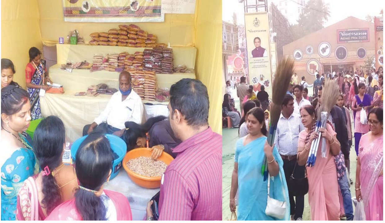
ଭୁବନେଶ୍ଵର : ଆଦିବାସୀ ମେଳାର ଶେଷ ଦିବସରେ ଗ୍ରାହକ ଓ ଦର୍ଶକମାନଙ୍କ ପ୍ରବଳ ଭିଡ଼ ।

◆ ପରିବାଦୋକାନୀ ୭ଟିରେ ଖୁସି ହୋଇଗଲା । ଏ ମାସକଯାକର ପରିବା ଦେବାକୁ ପୁରାପୁରି ରାଜି । ◆ ଗ୍ରୋସରୀ ଦୋକାନୀ ଏବେ ତୁଆଁ ବାହା ହୋଇଛି । ପ୍ରଥମେ ଅମଙ୍ଗ ହେଉଥିଲା । ମାତ୍ର ଦୁଇଦିନ ତଳେ ତା'ରା ତିନିଦିନ ପାଇଁ ବାପଘରକୁ ଚାଲିଯିବାରୁ କହିଲା-ସା ଦେଖିବା ଯାଏ ସେ ପ୍ରତିଦିନ ୨ଟି କରି ନେବ । ଆଜି ଦ୍ଵିତୀୟ କିଛି । ◆ ଘର ମାଲିକ ପ୍ରତିଦିନ ଦୁଇଟିଟିନେଟି ଲେଖା ନେଉଛନ୍ତି । ତେବେ ସେଥିରେ ସେ ସହୁଷ୍ଟ ନୁହନ୍ତି । ତାଙ୍କୁ ଅନ୍ୟ କିଛି ଦେବାକୁ ହେବ । ତେବେ ଚିନ୍ତାରେ ପଡ଼ିଛି ଚାକର ଚୋଳା ପାଇଁ । କୁର ପରେ ତା ମୁହଁରେ କ'ଣ ସବୁ ପାଇଯାଇଛି । ତମେ ଆଣିବା ଚିନ୍ତା କରିବନି । ମୋ ପାଖରେ ପାଖାପାଖି ଆଉଟି ୭୦ଟି ବାକିଛି । ଏ ମାସର ଆରମ୍ଭରେ ତଳିଯିବ ।