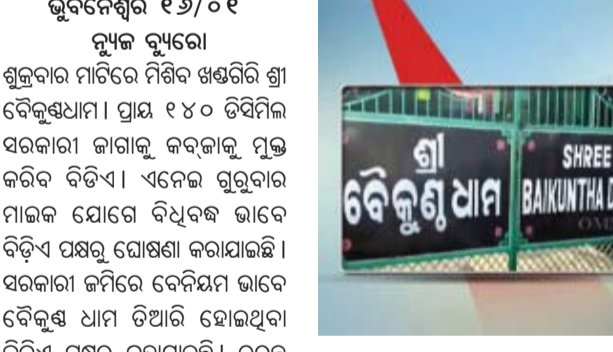
ଭୁବନେଶ୍ଵର, ୧୬/୦୧ ନ୍ୟୁଜ୍ ବ୍ୟୁରୋ ଶୁକ୍ରବାର ମାଟିରେ ମିଶିବ ଖଣ୍ଡଗିରି ଶ୍ରୀ ବୈକୁଣ୍ଠଧାମ । ପ୍ରାୟ ୧୪୦ ଡିଗ୍ରୀର ସରକାରୀ ଜାଗାକୁ କବଜାକୁ ମୁକ୍ତ କରିବ ବିଡ଼ିଏ । ଏନେଇ ଗୁରୁବାର ମାଲିକ ଯୋଗେ ବିଧିବଦ୍ଧ ଭାବେ ବିଡ଼ିଏ ପକ୍ଷରୁ ଘୋଷଣା କରାଯାଇଛି । ସରକାରୀ ଜମିରେ ବେନିୟମ ଭାବେ ବୈକୁଣ୍ଠ ଧାମ ତିଆରି ହୋଇଥିବା ବିଡ଼ିଏ ପକ୍ଷରୁ କୁହାଯାଇଛି । ତୁରନ୍ତ ସେ ସ୍ଥାନ ଛାଡ଼ି ଯିବାକୁ ପରାମର୍ଶ ଦିଆଯାଇଛି । ନଚେତ୍, ଉଚ୍ଚେଦ ସମୟରେ କୌଣସି ଦୁର୍ଘଟଣା ଘଟିଲେ ସେଥିପାଇଁ ସରକାର ଏବଂ ବିଡ଼ିଏ ଦାୟୀ ରହିବେ ନାହିଁ ବୋଲି ଘୋଷଣା କରାଯାଇଛି । ଦିନ ୧୨ଟା ସୁଦ୍ଧା ଉଚ୍ଚେଦ ଶେଷ କରିବାକୁ ଲକ୍ଷ୍ୟ ରଖା ଯାଇଥିବା ଘୋଷଣା କରାଯାଇଛି । ଗତ ନଭେମ୍ବର ୧୮ ତାରିଖରେ ସାଧାରଣ ପ୍ରଶାସନ, ବିଡ଼ିଏ ଓ ଭୁବନେଶ୍ଵର ତହସିଲଦାର ମିଳିତ ଚିମ୍, ଶ୍ରୀବୈକୁଣ୍ଠଧାମ ଆଗ୍ରମରେ ୨ ଘଣ୍ଟା ଧରି ମାପପତ୍ର କରିଥିଲା । ପାଖାପାଖି ୮ କୋଟି ଟଙ୍କା ମୂଲ୍ୟର ସରକାରୀ ଜମିରେ ବେଆଇନ ମଞ୍ଜୁର, କୋଠା ଆଉ ରୋଷଶାଳା ନିର୍ମାଣ ହୋଇଥିବା ଦର୍ଶାଯାଇଥିଲା । ଏ ସମ୍ପର୍କରେ

ଯୋଗାସନ ଶିକ୍ଷାକେନ୍ଦ୍ର ବୋଲି ସତ୍ୟପାଠ ଦାଖଲ କରିଥିଲେ । ୨୦୨୨ରେ ସ୍କୁଲ ଓ ଗଣଶିକ୍ଷା ବିଭାଗ ପକ୍ଷରୁ ସାଧାରଣ ପ୍ରଶାସନ ବିଭାଗକୁ ଲେଖାଯାଇଥିବା ଚିଠିକୁ ଦାଖଲ କରାଯାଇଥିଲା । ଉକ୍ତ ଚିଠିରେ ଗଣଶିକ୍ଷା ବିଭାଗ ଏହି ଜମିକୁ ଗ୍ରହଣ ନାମରେ କରିବା ଲାଗି ସୁପାରିଶ କରିଥିବା ଦର୍ଶାଯାଇଥିଲା । ହାଇକୋର୍ଟ ମଧ୍ୟ ବିଡ଼ିଏର ଉଚ୍ଚେଦ ଉପରେ ରହିତାଦେଶ କାରି କରିଥିଲେ । ହାଇକୋର୍ଟ ସାଧାରଣ ପ୍ରଶାସନ ବିଭାଗକୁ ଜବାବ୍ ମାଗିବା ପରେ ଆଗ୍ରମର ଜାଲିଆଡ଼ି ଜଣାପଡ଼ିଥିଲା । ଗତ ୧୦ ତାରିଖରେ ହାଇକୋର୍ଟ ବିଚାରପତି ଜଷ୍ଟିସ୍ ବି.ପି.ରାଉତରାୟ ଉଚ୍ଚେଦ ରହିତାଦେଶକୁ ହଟାଇଥିଲେ ।