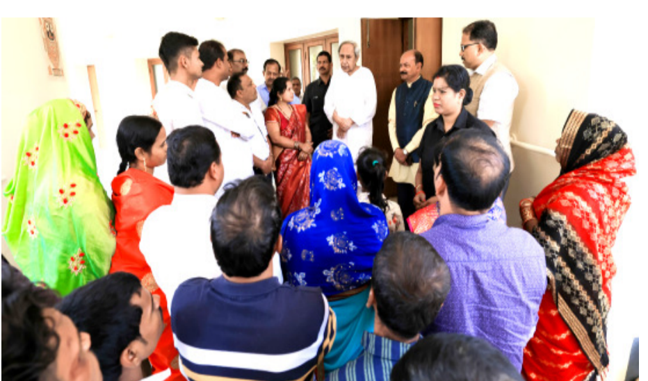
ଭୁବନେଶ୍ୱର : ବିଜେଡିରେ ଯୋଗ ଦେବା ପରେ ହିଝିଲିକାକୁ ବୁଲେ ବୁଲୁଥିବା ପଞ୍ଚାୟତର ସରପଞ୍ଚ, ଖୁର୍ଦ୍ଧା ସଭ୍ୟଙ୍କ ସମେତ କର୍ମୀ ନବୀନ ନିବାସରେ ବକର ପୁସ୍ତିମୋ ନବୀନ ପଞ୍ଚନାୟକଙ୍କୁ ଭେଟୁଛନ୍ତି ।