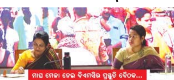
ମାଘ ମେଳା ନେଇ ବିଏମସିର ପ୍ରସ୍ତୁତି ବୈଠକ...

ଭୁବନେଶ୍ୱର, ୧୮/୧ ନ୍ୟୁଜ୍ ବ୍ୟୁରୋ ଆସନ୍ତା ଫେବୃଆରୀ ୪ରୁ ୧୨ ପର୍ଯ୍ୟନ୍ତ ଚାଲିବ ଖଣ୍ଡଗିରି ମେଳା । ଭୁବନେଶ୍ୱରର ଏହି ମେଳାକୁ ସରସ ସୁନ୍ଦର କରିବା ପାଇଁ ବିଏମସି ପ୍ରସ୍ତୁତ ବୈଠକ ବସିଥିଲା । ବହୁ ପୁର, ଦୂରାନ୍ତରୁ ଏବଂ ଓଡ଼ିଶା ଭିତରୁ ଅନେକ ସାଧୁ ସଂଗ୍ରହ ସମାଗମକୁ ଦୃଷ୍ଟିରେ ରଖି ତଳିତ ଥର ନୂଆ କରି ୧୦୦୦ ସାଧୁଙ୍କୁ ରେଷ୍ଟ ବ୍ୟବସ୍ଥା କରିବ ବିଏମସି । ସାଧୁସମୂହ ରହିବା ପାଇଁ ଶୈତାଳୟ, ପିକବା ପାଣି ବ୍ୟବସ୍ଥା ପାଇଁ ମାଷ୍ଟରପ୍ଲାନ କରିଛି ବିଏମସି । ଖଣ୍ଡଗିରି ଉପରେ ସ୍ଥାୟୀ ପାଣି ବ୍ୟବସ୍ଥା ମଧ୍ୟ କରାଯିବ । ସାଧୁ ସମୁଦାୟଙ୍କ ଆସିବାକୁ ନେଇ ହୋମ ଯଜ୍ଞ ଏବଂ ରହିବାର ସମ୍ପୂର୍ଣ୍ଣ ବ୍ୟବସ୍ଥା କରାଯାଇଛି । ଏହାପରେ ବିଏମସି ନେଇ ବିଭାଗ ବିଏମସିର ସମ୍ପୂର୍ଣ୍ଣ ବ୍ୟବସ୍ଥା କରାଯାଇଛି । ଅଧିକାରୀ ଅଧିକ ଶୈତାଳୟ ସହ ଲାଗତ ବ୍ୟବସ୍ଥାକୁ ସଠିକ କରାଯିବ ବୋଲି