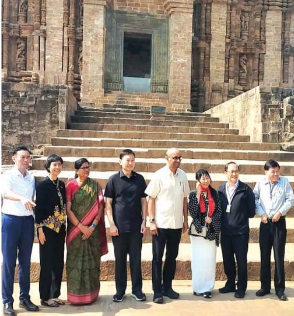
ଭୁବନେଶ୍ୱର : ଓଡ଼ିଶା ଗସ୍ତରେ ଆସିଥିବା ସିଙ୍ଗାପୁର ରାଷ୍ଟ୍ରପତି ଥର୍ମନ ଶନ୍ଦୁଗରନୁମ୍ ଓ ତାଙ୍କ ପତ୍ନୀ କୋଣାର୍କ ମନ୍ଦିର ଏବଂ ଐତିହ୍ୟ ଗ୍ରାମ ରଘୁରାଜପୁର ବୁଲି ଦେଖୁଛନ୍ତି ।

ଅନୁଯାୟୀ ଆହୁଳା ମାଲୁଥିବା ଲୋକଙ୍କର କାମ ତଦାରଖ ପାଇଁ ୪ଜଣ ଷ୍ଟିଅରିଂ ମ୍ୟାନେଜର, ତିନିଜଣ ଏରିଆ ଷ୍ଟିଅରିଂ ମ୍ୟାନେଜର ରହିବେ । ନୂଆ ବ୍ୟବସ୍ଥା ଅନୁଯାୟୀ ଆହୁଳା ମାଲୁଥିବା ବ୍ୟକ୍ତିଙ୍କର କାର୍ଯ୍ୟ ସମାପନ କରାଯିବା ପରେ ସେମାନଙ୍କୁ ସେମାନଙ୍କର କାମ ଅନୁଯାୟୀ ପ୍ରୋସ୍ତାହନ ଭରା ଦିଆଯିବ । ଏପରି ଯଦି କରାଯାଏ ତେବେ ଆସନ୍ତା ବର୍ଷ ଭାରତୀୟ ନୌଚାଳନାରେ ନିଶ୍ଚିତ ଭାବେ ବିଜୟ ହେବେ ବୋଲି କମିଟି ମତ ଦେଲେ । ଏହି ନିୟୋଜିତ ସରକାରଙ୍କୁ କେତେକ ପ୍ରସ୍ତାବ ଦିଆଗଲା । ଏହି ପ୍ରସ୍ତାବ