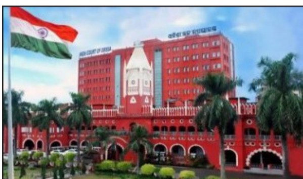
କର୍ଷିତ୍ତ ଗୌରୀଶଙ୍କର ଶତପଥୀ ଏପରି ରାୟ ଦେଇଛନ୍ତି । ଜଣେ ପତ୍ନୀଙ୍କ ପବିତ୍ରତା ହେଉଛି ଅତ୍ୟୁଚ୍ଚ

କଟକ, ୧୮/୦୧ ନ୍ୟୁଜ୍ ବ୍ୟୁରୋ ପ୍ରମାଣ ନଥାଇ ସ୍ତ୍ରୀ ଚରିତ୍ର ଉପରେ ସ୍ୱାମୀ ଆପତ୍ତି ଉଠାଇଲେ ସ୍ତ୍ରୀ ଅଲଗା ହୋଇ ରହିବାର ଯଥେଷ୍ଟ କାରଣ ବୋଲି ଧରାଯିବ । ଅନ୍ୟପଟରେ ସିଆରପିସିର ଧାରା ୧୨୫(୪)ରେ ତାଙ୍କୁ ଉତ୍ତରାଧିକାରୀ ଦାବିକୁ ବଞ୍ଚିତ କରାଯାଇପାରିବ ନାହିଁ ବୋଲି ହାଇକୋର୍ଟ ଏକ ଗୁରୁତ୍ୱପୂର୍ଣ୍ଣ ରାୟ ପ୍ରକାଶ କରିଛନ୍ତି । ଏକ ବୈବାହିକ ବିବାଦ ତଥା ଭରଣସମ୍ପତ୍ତି ମାମଲାରେ ପରିବାର ଅଦାଲତଙ୍କ ଆଦେଶକୁ କାଏମ ରଖିବା ସହ