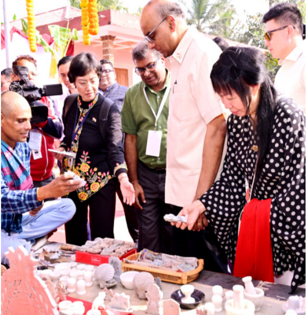
ଭୁବନେଶ୍ୱର : ଓଡ଼ିଶା ଗସ୍ତରେ ଆସିଥିବା ସିଙ୍ଗାପୁର ରାଷ୍ଟ୍ରପତି ଥର୍ମନ ଶନ୍ଦୁଗରନୁମ୍ ଓ ତାଙ୍କ ପତ୍ନୀ କୋଣାର୍କ ମନ୍ଦିର ଏବଂ ଐତିହ୍ୟ ଗ୍ରାମ ରଘୁରାଜପୁର ବୁଲି ଦେଖୁଛନ୍ତି ।