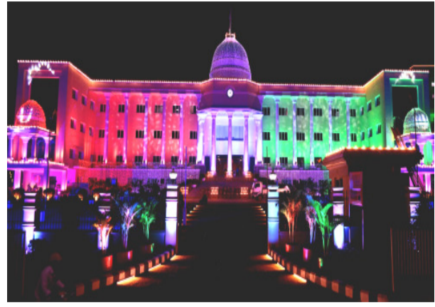
ଭୁବନେଶ୍ୱର : ସାଧାରଣତନ୍ତ୍ର ଦିବସ ଉତ୍ସବ ପାଇଁ ଅବସରରେ ରାଜଧାନୀ ସ୍ଥିତ ବିଭିନ୍ନ ସରକାରୀ ସୌଧ ରଙ୍ଗୀନ ଆଲୋକମାଳାରେ ସଜ୍ଜିତ ।