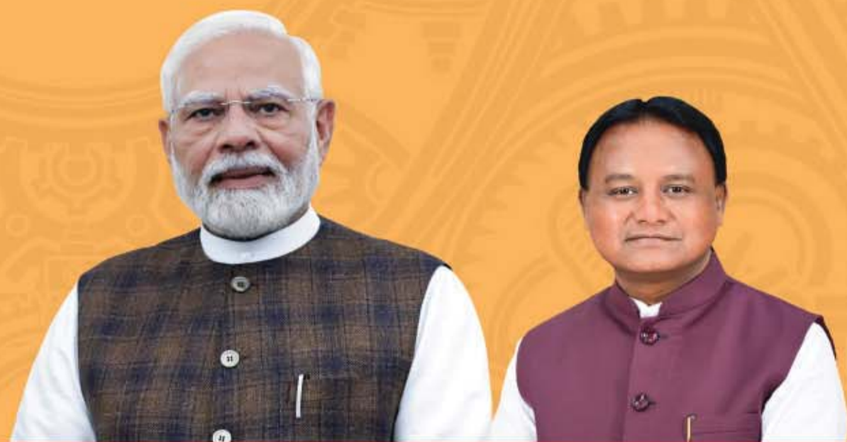
Shri Narendra Modi Prime Minister

Hon'ble Prime Minister, Shri Narendra Modi inaugurates the Utkarsh Odisha – Make in Odisha Conclave 2025 today, we invite industry leaders and entrepreneurs to be a part of this transformational journey.