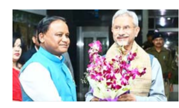
ପ୍ରବାସୀ ଭାରତୀୟ ଦିବସ ପରିଚିତ ଫିଡ଼ବ୍ୟାକ ଦେଇଛନ୍ତି । ରାଜ୍ୟ ସରକାରଙ୍କ ଆତିଥେୟତାକୁ ନେଇ ପରିଚିତ ଫିଡ଼ବ୍ୟାକ ଆସିଛି । ଭବିଷ୍ୟତରେ ଓଡ଼ିଶାରେ ଏକାକ କାର୍ଯ୍ୟକ୍ରମ ଆୟୋଜନ ପାଇଁ ଗୁରୁତ୍ୱ ଦିଆଯିବ । ପୂର୍ତ୍ତନାୟୋଗ୍ୟ, ୧୮ତମ ପ୍ରବାସୀ ଭାରତୀୟ ଦିବସ ସମ୍ମିଳନୀ (ପୃଷ୍ଠା ୭ରେ)

ନୂଆଦିଲ୍ଲୀ/ଭୁବନେଶ୍ୱର, ୩୧।୧ ନୁଆଲ୍ କୁମ୍ଭୋ ମୁଖ୍ୟମନ୍ତ୍ରୀ ମୋହନ ଚରଣ ମାଝୀଙ୍କୁ ବୈଦେଶିକ ବ୍ୟାପାର ମନ୍ତ୍ରୀ ସୁବ୍ରତମାମିକ ଜୟଶଙ୍କର ପ୍ରଶଂସା କରିଛନ୍ତି । ଗତ ଜାନୁଆରୀ ୮ରୁ ୧୦ ତାରିଖ ପର୍ଯ୍ୟନ୍ତ ଭୁବନେଶ୍ୱରରେ ଜନତା ମଜଦାନରେ ଆୟୋଜିତ ୧୮ତମ ପ୍ରବାସୀ ଭାରତୀୟ ଦିବସ ସମ୍ପର୍କରେ ସହିତ ଆୟୋଜନ ପାଇଁ ମୁଖ୍ୟମନ୍ତ୍ରୀଙ୍କୁ ସେ ପ୍ରଶଂସା କରିଛନ୍ତି । ମୁଖ୍ୟମନ୍ତ୍ରୀଙ୍କୁ ଏକ ଚିଠି ଲେଖି ବୈଦେଶିକମନ୍ତ୍ରୀ ଏହି ପ୍ରଶଂସା କରିଛନ୍ତି । କେନ୍ଦ୍ରମନ୍ତ୍ରୀ ଶ୍ରୀ ଜୟଶଙ୍କର କହିଛନ୍ତି,