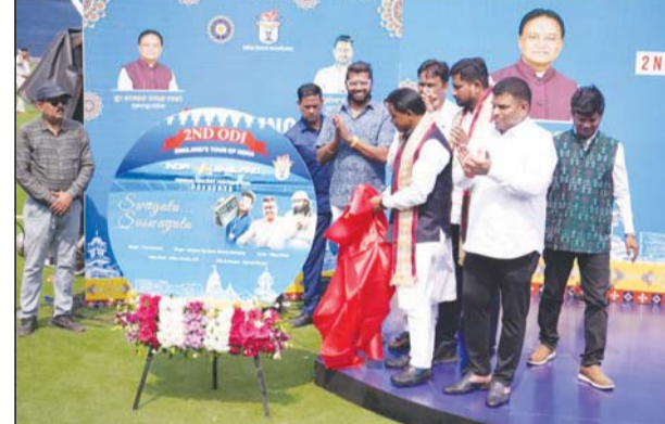
କଳାହାଣ୍ଡିର କଳାମାଟିରେ ପ୍ରସ୍ତୁତ ହୋଇଛି । କିନ୍ତୁ ଆୟୋଜକ ଓଡ଼ିଆ ରାହୁଁଛନ୍ତି ବୁଲ୍ ସମ୍ବଲ ପିପିଏଲ ହିଁ ମ୍ୟାର୍ ହେବ । କାରଣ ପୂର୍ବରୁ ଏହି ପିପିଏଲ ଇଡ଼ିଆରେ ହୋଇଛି, ହେଲେ ତୃତୀୟ ନିଷ୍ପତ୍ତି ରହିବ ମ୍ୟାର୍

ସମସ୍ତ ସହଯୋଗ କରିବେ । ମ୍ୟାର୍ ସମ୍ପର୍କ ଆୟୋଜନ ଆମ ସମ୍ମାନର କଥା ବୋଲି ମୁଖ୍ୟମନ୍ତ୍ରୀ କହିଛନ୍ତି । ସୂଚନାଯୋଗ୍ୟ ଯେ, ଆସନ୍ତା ୯ ତାରିଖରେ ଖେଳାୟିତ ଇଣ୍ଡିଆ-ଜଂଲଣ ଏକଦିବସୀୟ ମ୍ୟାର୍ । ବାରବାଟୀ ଷ୍ଟାଡ଼ିୟମରେ ପାଇଁ ଏବେଠାରୁ ପିପିଏଲ ଏବଂ ଆଉଟଫିଲ୍ଡ ଉପରେ ସ୍ୱତନ୍ତ୍ର ନଜର ରଖିଛି ଆୟୋଜକ ଓଡ଼ିଆ । ତେବେ ବର୍ତ୍ତମାନର ଟ୍ରେଣ୍ଡ ହେଉଛି ହାଲ ଷ୍ଟୋରି ମ୍ୟାର୍ । ତାକୁ ଆଖିରେ ରଖି ବାରବାଟୀର ପିପିଏଲ ପ୍ରସ୍ତୁତ କରାଯାଇଛି । ଯଦିଓ ପଡ଼ିଆ ମଝିରେ ୫ଟି ପିପିଏଲ ପ୍ରସ୍ତୁତ ହୋଇଛନ୍ତି । କିନ୍ତୁ ଫେବୃୟାରୀ ୯, ଓଡ଼ିଆରେ ପାଇଁ ୨ଟି ପିପିଏଲ ଫୋକସ୍ ରଖାଯାଇଛି । ମ୍ୟାର୍‌ରେ ଶାୟାଯାଇଥିବା ନାଲି ମାଟିରେ ଗୋଟିଏ ପିପିଏଲ, ଅନ୍ୟତ