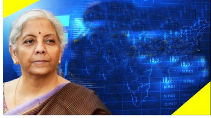
ପ୍ରତିଶତକୁ ହ୍ରାସ ପାଇଛି । ଅର୍ଥନୈତିକ ସର୍ତ୍ତରେ କୁହାଯାଇଛି ଯେ ୨୦୨୪-୨୫ ଆର୍ଥିକ ବର୍ଷର ପ୍ରଥମ ୯ ମାସରେ ଦେଶର ମୋଟ ଉତ୍ପାଦିତ (ସାମଗ୍ରୀ ଓ ସେବା)ରେ ୬ ପ୍ରତିଶତ ଅଧିକୃଷ୍ଟ ଘଟିଛି । ଯେତେଲିଭନ, ରତ୍ନ ଓ ଅଳକାରକୁ ବାଦ ଦେଲେ ସେବା ଓ ଉତ୍ପାଦିତ ସାମଗ୍ରୀରେ ୧୦.୪ ପ୍ରତିଶତ ବୃଦ୍ଧି ଘଟିଛି । ଏହା ସୁଖଦ ଯେ ଭାରତର ଉତ୍ପାଦିତ, କୃଷି ଏବଂ ଉତ୍ପାଦିତ ସାମଗ୍ରୀ ବିଶ୍ୱସ୍ତରୀୟ ଆହ୍ୱାନର ମୁକାବିଲା ପାଇଁ ପ୍ରସ୍ତୁତ ଥିଲା । ଲୋହିତ ସାଗର ଘଟଣା, ଯୁକ୍ତେନ ଯୁଦ୍ଧ ଏବଂ ପାମାଗା କୋନାଲରେ ସାମ୍ପ୍ରତିକ ମନୁଡ଼ି ଯୋଗୁଁ ବିଶ୍ୱ ବାଣିଜ୍ୟରେ ବାଧା ସୃଷ୍ଟି ହେବା ସହିତ ଅନେକ ଦେଶ ସଂରକ୍ଷଣବାଦୀ ମାନସିକତାକୁ ପ୍ରୋତ୍ସାହନ (ପୃଷ୍ଠା ୭ରେ)

ନୂଆଦିଲ୍ଲୀ, ୩୧।୧ ଶୁକ୍ରବାର ଲୋକସଭାରେ ଉପସ୍ଥାପିତ ଅର୍ଥନୈତିକ ସର୍ତ୍ତରେ କୁହାଯାଇଛି ଯେ ପ୍ରତିକୂଳ ବୈଶ୍ୱିକ ପରିସ୍ଥିତି ସମ୍ମୁଖୀନ ଭାରତର ଉତ୍ପାଦିତ କ୍ଷେତ୍ରର ପ୍ରଦର୍ଶନ ସମ୍ଭୋଷକମକ ରହିଛି । ଭାରତର ବୈଦେଶିକ ମୁଦ୍ରା ଭଣ୍ଡାର ୨୦୨୪ ଡିସେମ୍ବର ଶେଷ ସୁଦ୍ଧା ଏହା ୬୪୦.୩ ବିଲିୟନ ଆମେରିକୀୟ ଡଲାର ଥିଲା । ସେହିପରି ସେପ୍ଟେମ୍ବର ୨୦୨୪ ସୁଦ୍ଧା ଏହା ଭାରତର ୭୧୧.୮ ବିଲିୟନ ଆମେରିକୀୟ ଡଲାରର ବୈଦେଶିକ ରଣ ରହିଥିଲା । ସର୍ବୋଚ୍ଚରେ ଦର୍ଶାଯାଇଛି ଯେ ମୋଟ ଘରୋଇ ଉତ୍ପାଦ ତୁଳନାରେ ବିଦେଶୀ ରଣର ଅନୁପାତ କ୍ରମ ୨୦୨୪ରେ ୧୮.୮ ପ୍ରତିଶତ ଥିବା ବେଳେ ସେପ୍ଟେମ୍ବର ୨୦୨୪ରେ ୧୯.୪ ପ୍ରତିଶତକୁ ବୃଦ୍ଧି ପାଇଥିବା ବେଳେ ବୈଦେଶିକ ମୁଦ୍ରା ଭଣ୍ଡାର ଅନୁପାତ କ୍ରମ ୨୦୨୪ରେ ୨୦.୩ ପ୍ରତିଶତକୁ ୨୦୨୪ ସେପ୍ଟେମ୍ବରରେ ୧୮.୯