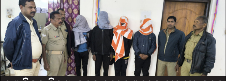
୫ ଅଭିଯୁକ୍ତ ଗିରଫ: ବନ୍ଧୁକ ସମେତ ଅନେକ ମାରଣାସ୍ତ୍ର ଜବତ