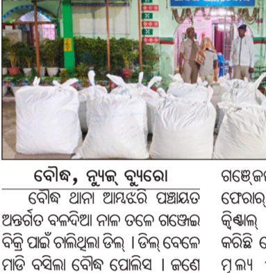
ବୌଦ୍ଧ, ନ୍ୟୁଜ୍ ବ୍ୟୁରୋ

ବୌଦ୍ଧ ଥାନା ଆଖପାଖ ପଞ୍ଚାୟତ ଅନ୍ତର୍ଗତ ବଳଦିଆ ନାଳ ତଳେ ଗଞ୍ଜେଇ ବିକ୍ରି ପାଇଁ ଚାଲିଥିଲା ତିଳ । ତିଳ ବେଳେ ମାଟି ବସିଲା ବୌଦ୍ଧ ପୋଲିସ । ଜଣେ