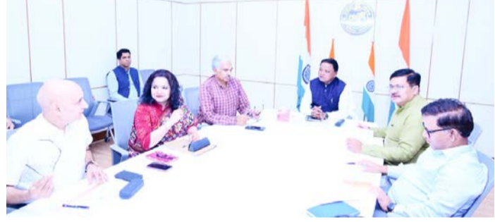
ଜୟଦେବ ବିହାରୀ ନନ୍ଦନକାନନ ପର୍ଯ୍ୟନ୍ତ ଏକ ଏଲିଭେଟର୍ କରାଯିବ, ପଟିଆ ଷ୍ଟେସନ ଛକରୁ ପୁଅଲି ମୌଳୀ ପର୍ଯ୍ୟନ୍ତ ଦୟା ଷ୍ଟେସନ କେନାଲ ରାସ୍ତା ନିର୍ମାଣ, ସୁନ୍ଦରପଦାରୁ ଜଟଣା ରାସ୍ତାର ପ୍ରଶସ୍ତିକରଣ, ଏବଂ କଟକର ସହିଷାଳ-ରେଲ୍ ବିହାର ଦେଇ ଏକାମ୍ର ଛକ, ମୁଖିକମ୍ପ ଓ ଶିଶୁଭବନ ଛକରେ ଗାଡି

ଭୁବନେଶ୍ୱର, ୩୧।୧ ନୁଆଲ୍ କୁମ୍ଭୋ ମୁଖ୍ୟମନ୍ତ୍ରୀ ମୋହନ ଚରଣ ମାଝୀ ଶୁକ୍ରବାର ଲୋକସଭାରେ ପୂର୍ବ ବିଭାଗର କାର୍ଯ୍ୟକ୍ରମ ସମାପ୍ତ କରି ରାଜ୍ୟ ସରକାରଙ୍କ ପକ୍ଷରୁ ପରିକଳ୍ପିତ ବିଭିନ୍ନ ନୂତନ ପ୍ରକଳ୍ପ ଗୁଡ଼ିକ ତୁରନ୍ତ କାର୍ଯ୍ୟକାରୀ କରିବା ପାଇଁ ନିର୍ଦ୍ଦେଶ ଦେଇଛନ୍ତି । ବର୍ତ୍ତମାନ ସୁଦ୍ଧା ବଜେଟ୍ ପରିମାଣର ୭୨ ପ୍ରତିଶତ ଖର୍ଚ୍ଚ ହୋଇଥିବା ବେଳେ ଆର୍ଥିକ ବର୍ଷ ଶେଷ ସୁଦ୍ଧା ଶତ ପ୍ରତିଶତ ଖର୍ଚ୍ଚ କରିବା ପାଇଁ ମୁଖ୍ୟମନ୍ତ୍ରୀ ନିର୍ଦ୍ଦେଶ ଦେଇଛନ୍ତି । ବୈଠକରେ ଭୁବନେଶ୍ୱରର ସମନ୍ୱିତ ବିକାଶ ଯୋଜନା ସହିତ ଗ୍ରାଫିକ୍ ଭିଡ଼ ହ୍ରାସ ଯୋଜନା ସମ୍ପର୍କରେ ଆଲୋଚନା ହୋଇଥିଲା । ଆଲୋଚନାରେ ଜଣାଯାଇଛି ଯେ, ଏଥିପାଇଁ