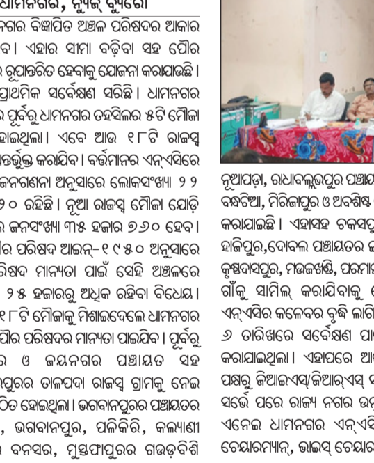
ଧାମନଗର, ନ୍ୟୁଜ୍ ବ୍ୟୁରୋ

ଧାମନଗର, ନ୍ୟୁଜ୍ ବ୍ୟୁରୋ ଧାମନଗର ବିଜ୍ଞାପିତ ଅଞ୍ଚଳ ପରିଷଦର ଆକାର ବୃଦ୍ଧି ପାଇବ । ଏହାର ସୀମା ବଢ଼ିବା ସହ ପୌର ପରିଷଦରେ ରୁପାନ୍ତରିତ ହେବାକୁ ଯୋଜନା କରାଯାଇଛି । ଏଥିଲାଗି ପ୍ରାଥମିକ ସର୍ବେକ୍ଷଣ ସରିଛି । ଧାମନଗର ଏନ୍ଏସ୍ଏଲିଭର ପୂର୍ବରୁ ଧାମନଗର ଡେଭିଲପମେଣ୍ଟ ଅଞ୍ଚଳ ଥିଲା । ଏହାକୁ ଧାମନଗର ପୌର ପରିଷଦରେ ରୁପାନ୍ତରିତ କରିବା ପାଇଁ ଧାମନଗର ପୌର ପରିଷଦର ପ୍ରକଳ୍ପ ଅଧିକ ସମ୍ପୂର୍ଣ୍ଣରେ ଆହୋରାତ୍ର ଧାରଣା ପ୍ରଦାନ ପାଇଁ ବସିଥିଲେ । ଆସନ୍ତା ମାର୍ଚ୍ଚ ୧୫ ତାରିଖ ସୁଦ୍ଧା ରାସ୍ତା କାର୍ଯ୍ୟ ସମ୍ପୂର୍ଣ୍ଣ କରାଯିବ ବୋଲି ଠିକା ସଂସ୍ଥା ଆୟୋଜନକାରୀ ମାନଙ୍କୁ ନିଜର ପ୍ରତିଶ୍ରୁତି ଦେବାପରେ ଧାରଣା ପ୍ରଦାନ ହୋଇଥିଲା । ଅନ୍ୟପକ୍ଷେ ରାସ୍ତା ବିଭିନ୍ନ ସ୍ଥାନରେ ଗଲପୋଲ ନିର୍ମାଣ ଚାଲିଥିବା ବେଳେ ଏହି କାର୍ଯ୍ୟ ମଧ୍ୟରେ ଗାଳିଥିବା ସ୍ଥାନର ଲୋକେ ଯିବା ଆସିବାରେ ନାନା ଅସୁବିଧାର ସମ୍ମୁଖୀନ ହେଉଛନ୍ତି । ମିଳିଥିବା ସୂଚନା ଅନୁଯାୟୀ ଚୌଦ୍ୱାର ଗାଆଁ ଛକ ଓ ଧୂମାବତୀ ନିକଟରେ ନିର୍ମାଣାଧୀନ ଅଣ୍ଡରପାସ୍ କାର୍ଯ୍ୟ ଆସନ୍ତା ଫେବୃୟାରୀ ୨୮ ତାରିଖ ସୁଦ୍ଧା ଶେଷ କରିବା ପାଇଁ ବି. ବି. ବର୍ମା ଠିକା ସଂସ୍ଥା କିଛିଟ ପ୍ରତିଶ୍ରୁତି ଦେଇଥିବା ଜଣାପଡ଼ିଛି । ଠିକାସଂସ୍ଥା ଗତ ସପ୍ତକ ‘ଏନ୍ଏସ୍ଏଲିଭର ଡେକୋରାଲ ପ୍ରୋଜେକ୍ଟ ପ୍ରକଳ୍ପ ନିର୍ଦ୍ଦେଶକଙ୍କୁ ଗତ ୨୭ ତାରିଖ ଦିନ ଏକ ପତ୍ର ଲେଖି ଏ ସମ୍ପର୍କରେ ଅବଗତ କରାଯାଇଥିବା ଜଣାପଡ଼ିଛି । ସୂଚନାଯୋଗରେ ରାସ୍ତା କାମ ସମ୍ପୂର୍ଣ୍ଣ କରିବା ଦିନେ ଜାଗରଣା ପଞ୍ଚର ବରଷାର ଆୟୋଜନ, ରାସ୍ତାରେ ଯାଏ ଏବଂ ଧାରଣା ଆଦି କାର୍ଯ୍ୟକୁ ମଧ୍ୟ ଠିକାସଂସ୍ଥା କାର୍ଯ୍ୟର ଗତି ଦୃଷ୍ଟିକରି କରିବା ଆରମ୍ଭ କରିଥିବା ଚୌଦ୍ୱାରରେ ଚର୍ଚ୍ଚା ବିଷୟ ହୋଇଛି ।