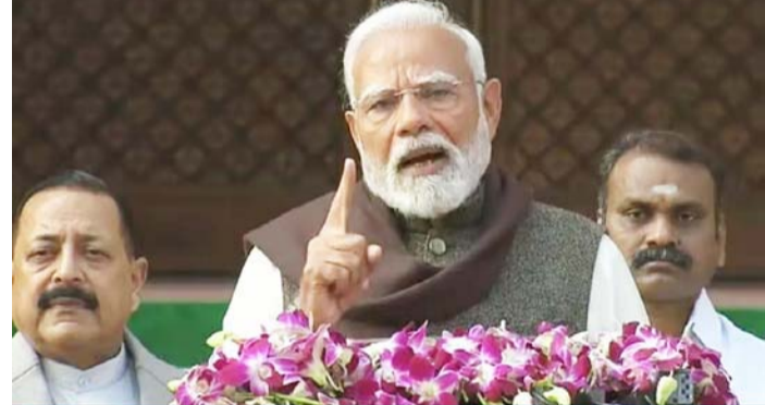
ମହିଳା ଶକ୍ତି ବୃଦ୍ଧି ପାଇଁ ଅନେକ ଗୁରୁତ୍ୱପୂର୍ଣ୍ଣ ନିଷ୍ପତ୍ତି ନିଆଯିବ । ପ୍ରଧାନମନ୍ତ୍ରୀ ଆହୁରି କହିଛନ୍ତି ଯେ, ବିକାଶର ଦୁତ ଗତି ହାସଲ କରିବାକୁ ହେଲେ ଅନେକ ସଂସ୍କାର ଆବଶ୍ୟକତା ରହିଛି । ପ୍ରତ୍ୟେକ କ୍ଷେତ୍ରରେ ଜନ ଭାଗିଦାରୀ ହେଲେ

ନୂଆଦିଲ୍ଲୀ, ୩୧।୧ ଶନିବାର ସଂସଦରେ ବଜେଟ୍ ଉପସ୍ଥାପନ କରିବେ ଅର୍ଥମନ୍ତ୍ରୀ ନିର୍ମଳା ସୀତାରାମଣୀ । ଏହାପୂର୍ବରୁ ଶୁକ୍ରବାର ଦେଶବାସୀଙ୍କୁ ସମୋ୍ଧନ କରିଛନ୍ତି ପ୍ରଧାନମନ୍ତ୍ରୀ ନରେନ୍ଦ୍ର ମୋଦି । ଦେବୀ ଲକ୍ଷ୍ମୀଙ୍କୁ ପ୍ରଣାମ କରି ଅଭିବାଦନ ଜଣାଇଛନ୍ତି ପ୍ରଧାନମନ୍ତ୍ରୀ । ସେ କହିଛନ୍ତି ଶନିବାର ଉପସ୍ଥାପିତ ହେବାକୁ ଥିବା ବଜେଟ୍ ଦେଶରେ ନୂତନ ଆର୍ଥିକଶାସ୍ତ୍ର ସୃଷ୍ଟି କରିବ । ପ୍ରଧାନମନ୍ତ୍ରୀଙ୍କ ସମୋ୍ଧନ ପରେ ଏଥର ବଜେଟ୍ କାହାକୁ ଅଧିକ ସୁଧାକର ତାହାକୁ ନେଇ ଆରମ୍ଭ ହୋଇଛି କଟକନାଟକ । ପ୍ରଧାନମନ୍ତ୍ରୀ ନିଜ ଅଭିଭାଷଣରେ କହିଛନ୍ତି, ଦେଶର ପ୍ରତ୍ୟେକ ମହିଳା ସମ୍ମାନ ଏବଂ ସମାନ ଅଧିକାର ପାଇବା ଜରୁରୀ । ଆମକୁ ମହିଳା ଶକ୍ତିର ଗୌରବ ପ୍ରତିଷ୍ଠା କରିବାକୁ ପଡ଼ିବ ଏବଂ ଏହି ବଜେଟ୍ ଅଧିବେଶନରେ