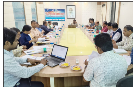
କେନ୍ଦ୍ରରେ, ନ୍ୟୁଜ୍ ବ୍ୟୁରୋ