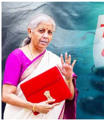
ସରକାର ନୂଆ ଟିକସ ବ୍ୟବସ୍ଥାକୁ ପ୍ରୋତ୍ସାହନ କରିବାକୁ ଚେଷ୍ଟା କରୁଛନ୍ତି । ଗତ କିଛି ବଜେଟ୍ରେ, ବ୍ୟକ୍ତିଗତ ଟିକସରେ ପରିବର୍ତ୍ତନ ମଧ୍ୟ ପ୍ରସ୍ତାବ ଦିଆଯାଇଥିଲା, ଯାହା ପରିବର୍ତ୍ତନ କେବଳ ସେହି ବ୍ୟକ୍ତିଗତ ଟିକସ ପାଇଁ କରାଯାଇଥିଲା, ଯେଉଁମାନେ ନୂତନ ଟିକସ ବ୍ୟବସ୍ଥାକୁ ବାଧିଥିଲେ । ୨୦୨୩-୨୪ ଆର୍ଥିକ ବର୍ଷ ପାଇଁ ଆୟକର ରିଟର୍ଣ୍ଣ ବାଧ୍ୟତା କରିବା ସମୟରେ, ୭୨ ପ୍ରତିଶତ

ବଜେଟ୍ ୨୦୨୫ ପୂର୍ବରୁ ବଡ଼ ଘୋଷଣା! କମିଟି ପ୍ରୋତ୍ସାହନ ଦର । ଏଥିପାଇଁ, ଉତ୍ପାଦ ଶୁଳ୍କ ହ୍ରାସ କରାଯାଇପାରେ । ବର୍ତ୍ତମାନ ପ୍ରୋତ୍ସାହନ ଉପରେ ୧୯.୯୦ ଟଙ୍କା ଏବଂ ଡିଜେଲ ଉପରେ ୧୫.୮୦ ଟଙ୍କା ଶୁଳ୍କ ଲାଗୁ ହେଉଛି । ଏହା ବ୍ୟତୀତ, ଇଲେକ୍ଟ୍ରୋନିକ୍ସ ଉପରେ ଆମଦାନୀ ଶୁଳ୍କ ହ୍ରାସ ଯୋଗୁଁ ମୋବାଇଲ୍ ଭଳି ଜିନିଷ ଶସ୍ତା ହୋଇପାରେ । ଅର୍ଥନୈତିକ ବିଶେଷଜ୍ଞଙ୍କୁ ସାହାଯ୍ୟ କରିବା ପାଇଁ ୧୦ ଲକ୍ଷ ଟଙ୍କା ପର୍ଯ୍ୟନ୍ତ ଆୟକର କରମୁକ୍ତ କରିପାରିବ । ଏଥିସହ, ୧୫୭୦ ଲକ୍ଷ ଟଙ୍କା ଆୟ ଉପରେ ୨୫% ଟିକସର ଏକ ନୂଆ ବର୍ଗ ପ୍ରଚଳନ କରିପାରିବ । ବର୍ତ୍ତମାନର ଟିକସ ଗଠନରେ ଛଅଟି ବର୍ଗ ଅଛି । ସେହିପରି ପ୍ରଧାନମନ୍ତ୍ରୀ କିଷାନ ସମ୍ମାନ ନିଧି ଯୋଜନାରେ, ବାର୍ଷିକ ୬୫୦ ଟଙ୍କା ଟଙ୍କା ୧୨୫୦ ଟଙ୍କାକୁ (ପୃଷ୍ଠା ୭ରେ)