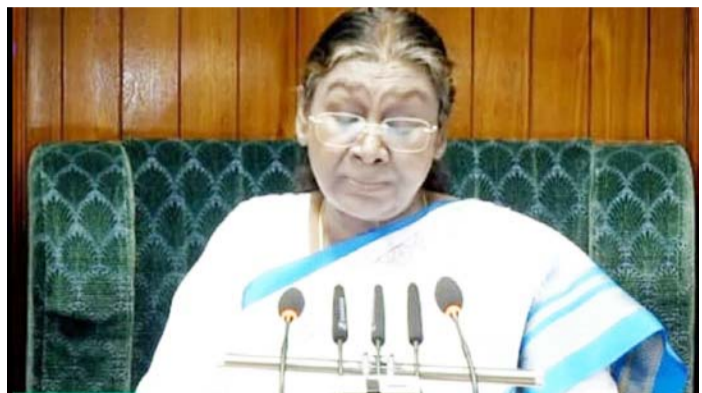
ଆପଣାକାର ୧୫ ବର୍ଷ ପୂରଣ ହେବା ଉତ୍ସବ ମନାଇଥିଲା ଏବଂ କିଛି ଦିନ ପୂର୍ବରୁ ହିଁ ଭାରତ ଗଣରାଜ୍ୟ ୭୫ ବର୍ଷର ଯାତ୍ରା ପୂରଣ କରିଛି । ସେ ସମସ୍ତଙ୍କ ପକ୍ଷରୁ ବାବା ସାହେବ ଆମେଦକର ଓ ସମ୍ପାଦନା ନିର୍ଦ୍ଦେଶକ ସମସ୍ତ ଲୋକଙ୍କୁ ଶ୍ରଦ୍ଧାଞ୍ଜଳି ଅର୍ପଣ କରିଛନ୍ତି । ରାଷ୍ଟ୍ରପତି ତାଙ୍କ ଅଭିଭାଷଣରେ ଦେଶରେ ହେଉଥିବା ବିକାଶ କାର୍ଯ୍ୟର ବି ଉଲ୍ଲେଖ

ନୂଆଦିଲ୍ଲୀ, ୩୧।୧ ସଂସଦର ମିଳିତ ଅଧିବେଶନ ଉଦ୍‌ଘାଟନ ଅବସରରେ ରାଷ୍ଟ୍ରପତି ତ୍ରୈପଦୀ ମୁର୍ମୁ କହିଛନ୍ତି ଯେ, ମୋର ସରକାର ଭାରତର ବିକାଶ ଯାତ୍ରାର ଏହି ଅମୃତକାଳକୁ ଅଭୁତପୂର୍ବ ଉପଲବ୍ଧି ମାଧ୍ୟମରେ ନୂଆ ଉର୍ଦ୍ଧା ପ୍ରଦାନ କରୁଛନ୍ତି । ତୃତୀୟ କାର୍ଯ୍ୟକାଳରେ ତିନିଗୁଣା ଦୁତ ଗତିରେ କାମ ହେଉଛି । ଆଜି ଦେଶ ବଡ଼ ନିଷ୍ଠା ଓ ନୀତିକୁ ଅଧିକାରୀ ଗତିରେ ଲାଗୁ ହେବା ଦେଖିଛି । ରାଷ୍ଟ୍ରପତି ସଂସଦର ମିଳିତ ଅଧିବେଶନକୁ ସମୋ୍ଧିତ କରିବା ଅବସରରେ ସରକାରଙ୍କ କାର୍ଯ୍ୟଧାରା ଉପରେ ଶୁଣି ବ୍ୟକ୍ତ କରିଛନ୍ତି । ସେ କହିଛନ୍ତି ଯେ, ଏବେ ଦୁଇମାସ ପୂର୍ବରୁ ଆମେ ଆମର ସମ୍ପାଦନାକୁ