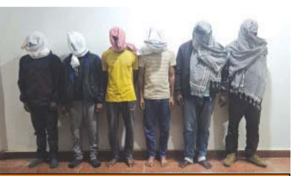
୩ କୋଟି ୫୧ ଲକ୍ଷ ନଗଦ ଟଙ୍କା ଜବତ

କଳାହାଣ୍ଡି ୧/୨ ନ୍ୟୁଜ ବ୍ୟୁରୋ ବନ୍ଧାହେଲେ ୮ ଦୁର୍ଦ୍ଦାନ୍ତ ଆକ୍ରମଣୀଙ୍କୁ ଡକାୟତ । ସେମାନଙ୍କ ଠାରୁ ଜବତ ହୋଇଛି ସାତେ ୩ କୋଟିରୁ ଅଧିକ ଟଙ୍କା । କଳାହାଣ୍ଡି ପୋଲିସ ଏକ ଆକ୍ରମଣୀଙ୍କୁ ଡକାୟତ ଗ୍ୟାଙ୍ଗକୁ ଗିରଫ କରିବା ପରେ ସେମାନଙ୍କ ଠାରୁ ଟଙ୍କା ଭଣ୍ଡାର ହୋଇଛି । ଗତ ୩୦ ତାରିଖରେ ଘଟିଥିଲା ଏହି ସଂଗଠିତ ଡକାୟତ । ଏକ ବୋଲେରୋରେ ୮ ଜଣ ଡକାୟତ ଆସି ଧର୍ମଗଡ଼ରେ ଥିବା ଏକ ଦେଶୀ ମଦ ଭାରିରେ ରାତି ଅଧରେ ପଶିଥିଲେ । ବନ୍ଧୁକ ଏବଂ ମାରଣଶକ୍ତ ଦେଖାଇ ଟଙ୍କା ଲୁଚିଥିଲେ । ଯେଉଁ ବୋଲେରୋରେ ଡକାୟତମାନେ ଆସିଥିଲେ ସେହି ବୋଲେରୋରେ ୬ ଜଣ ଡକାୟତ ଫେରାର ହୋଇଯାଇଥିଲେ । ବାକି ୨ ଜଣ ସେଠାରୁ ବୋଟି ବୋଟି ରାଷ୍ଟ୍ରାରେ ଯାଉଥିବା ବେଳେ ପୋଲିସ ଗାଡ଼ିକୁ ଲିଫ୍ଟାଗିଥିଲେ । ପୋଲିସ ଏମାନଙ୍କ