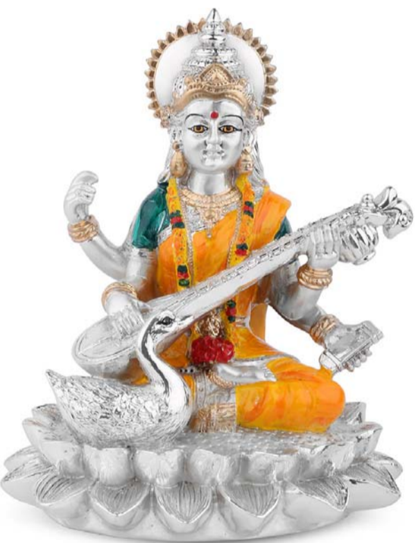
ମହାଲକ୍ଷ୍ମୀ ୩. ମହା ସରସ୍ୱତୀ ୪.ସୌ ମହାଶକ୍ତି, ମହାଲକ୍ଷ୍ମୀ ଧନ ଓ ଦୁର୍ଗାଦେବୀ ଦେବୀ ଏବଂ ୫.ମହା ସରସ୍ୱତୀ ବିଦ୍ୟାର ବାତ୍ରୀ । ଏହି ତ୍ରି ମହାଶକ୍ତି ଭିତରେ ମହାସରସ୍ୱତୀ ସର୍ବ କନିଷ୍ଠା । ସମସ୍ତ କଳା ସାହିତ୍ୟ, ସଙ୍ଗୀତ, ନାଟ୍ୟ, ନୃତ୍ୟ, କଳା, ଭାବ୍ୟର୍ଯ୍ୟ ଭିତରେ ମହା ସରସ୍ୱତୀ ହିଁ ଆନନ୍ଦମୟ ସ୍ୱରୂପରେ ବିଦ୍ୟାମାନ ରହିଥାନ୍ତି । ତାଙ୍କୁ ବାକଦେବୀ ମଧ୍ୟ

ପୁସ୍ତକ ଏବଂ ମାଳା ଥିଲା । ବ୍ରହ୍ମାଙ୍କ କହିବାପରେ ଦେବୀ ବାଣୀ ବଜାଇବାକୁ ଆରମ୍ଭ କଲାପରେ ସଂସାରର ସବୁ ଜୀବଜନ୍ତୁ ବାଣୀଶକ୍ତି ପ୍ରାପ୍ତ କରିଲେ । ପଞ୍ଚମୀ ରାବିକେ, ଭ୍ରମର ଗୁଣ୍ଡ ଗୁଣ୍ଡ ଶବ୍ଦ କଲେ, ନଦୀ କଳ କଳ ନାଦରେ ବହିବାରେ ଲାଗିଲା । ମାତା ଶୁକ୍ଳ ପଞ୍ଚମୀ ଦିନ ଦେବୀ ପ୍ରକଟ ହୋଇଥିବାରୁ ତାଙ୍କ ନାମ ହେଲା ସରସ୍ୱତୀ । ଏହି ପଞ୍ଚମୀର ଅନ୍ୟ ନାମ ହେଲା ବସନ୍ତ ପଞ୍ଚମୀ । ପୁରାଣ ଅନୁସାରେ ଭଗବାନ କୃଷ୍ଣ ମା'ଙ୍କ ଉପରେ ପ୍ରସନ୍ନ ହୋଇ ବରଦାନ ଦେଲେ କି ଭକ୍ତମାନଙ୍କ ଦ୍ୱାରା ଏହିଦିନ ତାଙ୍କର ଆରାଧନା କରାଯିବା ସରସ୍ୱତୀଙ୍କୁ ଶାରଦା, ଭଗବତୀ, ବାଣୀବାଦିନୀ, ହଂସବାହିନୀ ଦେବୀ ବୋଲି ମଧ୍ୟ କୁହାଯାଏ । ଶକ୍ତି ଉପାସନା ଭାରତୀୟ ସଂସ୍କୃତିରେ ବହୁ ପ୍ରାଚୀନ ଅଟେ । ମାତୃଶକ୍ତି ପୂଜା ବୈଦିକ ଯୁଗରୁ ଆରମ୍ଭ ହୋଇ ଆସୁଅଛି । ମାତୃଶକ୍ତି ହିଁ ସୃଷ୍ଟି, ସ୍ଥିତି, ପ୍ରକାଶର ମୂଳ ଉତ୍ସ । ଭାରତୀୟ ଶକ୍ତିପରମ ବିଚାରଧାରୀ ଅନୁଯାୟୀ ଯେଉଁ ତ୍ରିଶକ୍ତିର ପରିକଳ୍ପନା କରାଯାଇଛି ସେମାନେ ହେଲେ ୧.ମହାଶକ୍ତି ୨.