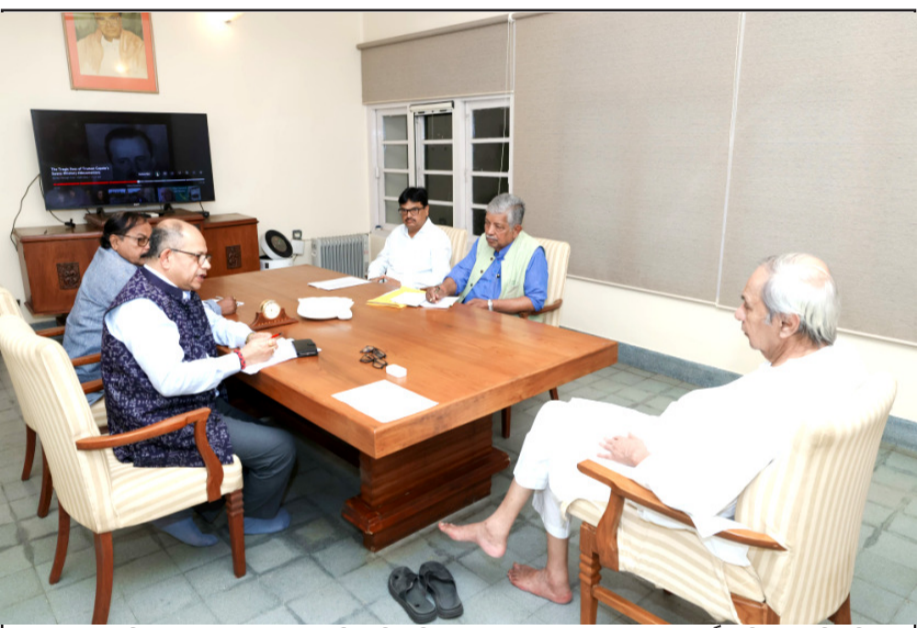
ଭୁବନେଶ୍ୱର : ବିରୋଧୀ ଦଳ ନେତା ତଥା ବିଜେଡି ସୁପ୍ରିମୋ ନବୀନ ପଟ୍ଟନାୟକ ୧୬ତମ ଅର୍ଥ କମିଶନକୁ ବିଆସିବାକୁ ଥିବା ସ୍ୱାରକପତ୍ର ସଂପର୍କରେ ଦଳର ବରିଷ୍ଠ ନେତାମାନଙ୍କ ସହ ଆଲୋଚନା କରୁଛନ୍ତି ।

ସିଆରପିଏସ୍ ଯବାନମାନେ ମିଳିତ ଅପରେସନ୍ କରିଥିଲେ । ସେହିପରି ସୁରକ୍ଷାକର୍ମୀଙ୍କ ଜୋରଦାର ଅପରେସନ୍ ପରେ ଭୟଭୀତ ହୋଇ ଆତ୍ମସମର୍ପଣ କଲେ ୧୦ ମାଓବାଦୀ । ଏମାନେ ସମସ୍ତେ ହେଉଛନ୍ତି ଆଜ୍ଞା ଓଡ଼ିଶା ବର୍ତ୍ତର ସ୍ୱେଶାଳ ଜୋନାଲ କମିଟିର ସଦସ୍ୟ । ସେମାନଙ୍କ ମଧ୍ୟରୁ ୪ ଜଣଙ୍କ ମୃତ୍ୟୁ ଉପରେ ପୂର୍ବରୁ ୧ ଲକ୍ଷ ଟଙ୍କା ପୁରସ୍କାର ରାଶି ଘୋଷଣା କରାଯାଇଥିବା ବେଳେ ୬ ଜଣଙ୍କ ମୃତ୍ୟୁ ଉପରେ ୫ ଲକ୍ଷ ଟଙ୍କା ପୁରସ୍କାର ରାଶି ଘୋଷଣା କରାଯାଇଥିଲା । ଆତ୍ମସମର୍ପଣ ପରେ ଏମାନଙ୍କୁ ସରକାରଙ୍କ ନିୟମ ଅନୁସାରେ ଅଭିଯାନ କରାଯିବ ବୋଲି ବିଜାପୁର ଏସପି କହିଛନ୍ତି । ମାତ୍ରମୂଳ ଭାରତ ଗଠନ ହେବା ଲାଗି ତାରିଖ ଘୋଷଣା ହେବା ପରେ ୨୦୨୪ରେ ଛତିଶଗଡ଼ରେ ୧୮୯ ଜଣ ମାଓବାଦୀ ଆତ୍ମସମର୍ପଣ କରିଛନ୍ତି । ସେହିଭଳି ୫୮ ଜଣ ମାଓବାଦୀ ପୁରୁଣାକର୍ମୀଙ୍କ ଭୂମିରେ ପ୍ରାଣ ହରାଇଛନ୍ତି ।